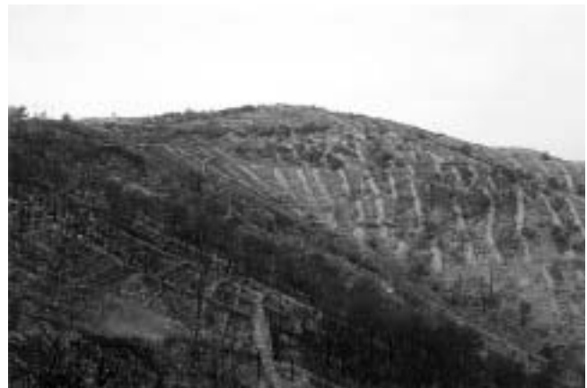
Obronci južnog ruba kotline između sela Grablje i uvale Konopljkova.