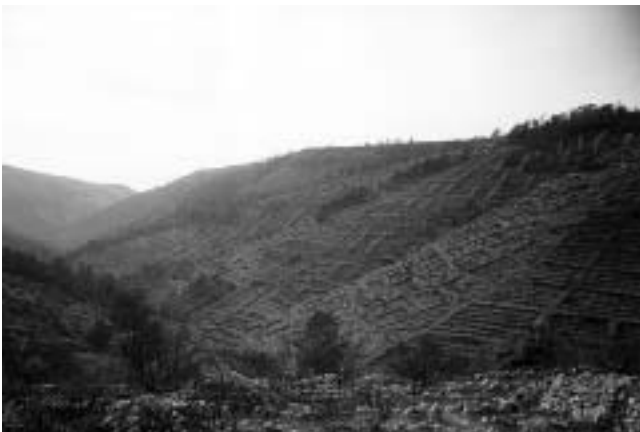
Obronci sjevernog ruba kotline između sela Grablje i uvale Dubovica.