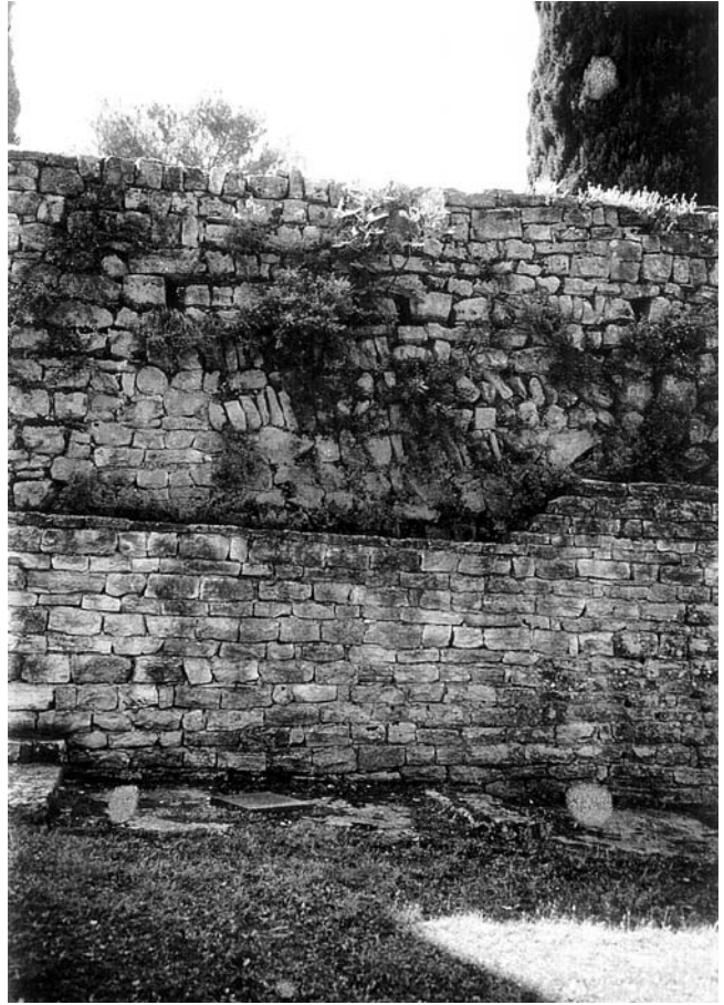
Reprezentativni objekt iz 1./2. st., struktura istočnog zida