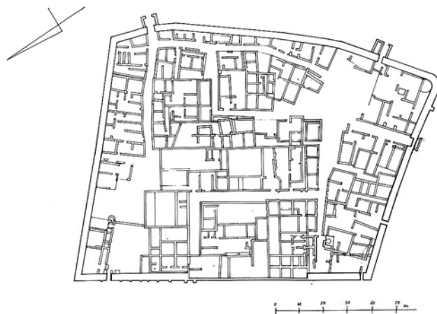
Kasnoantičko naselje, tlocrt – prema geodetskoj snimci (Tutek 2006.)