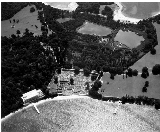
Uvala Madona – zračna snimka