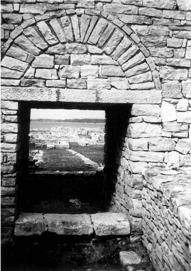
Jugoistočni ulaz u kasnoantičko naselje u uvali Madona