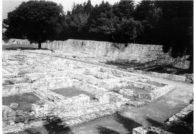
Kasnoantičko naselje – struktura naselja, komunikacije