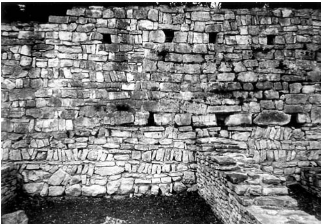
Fortifikacije naselja – struktura zida, vidljive dvije faze gradnje