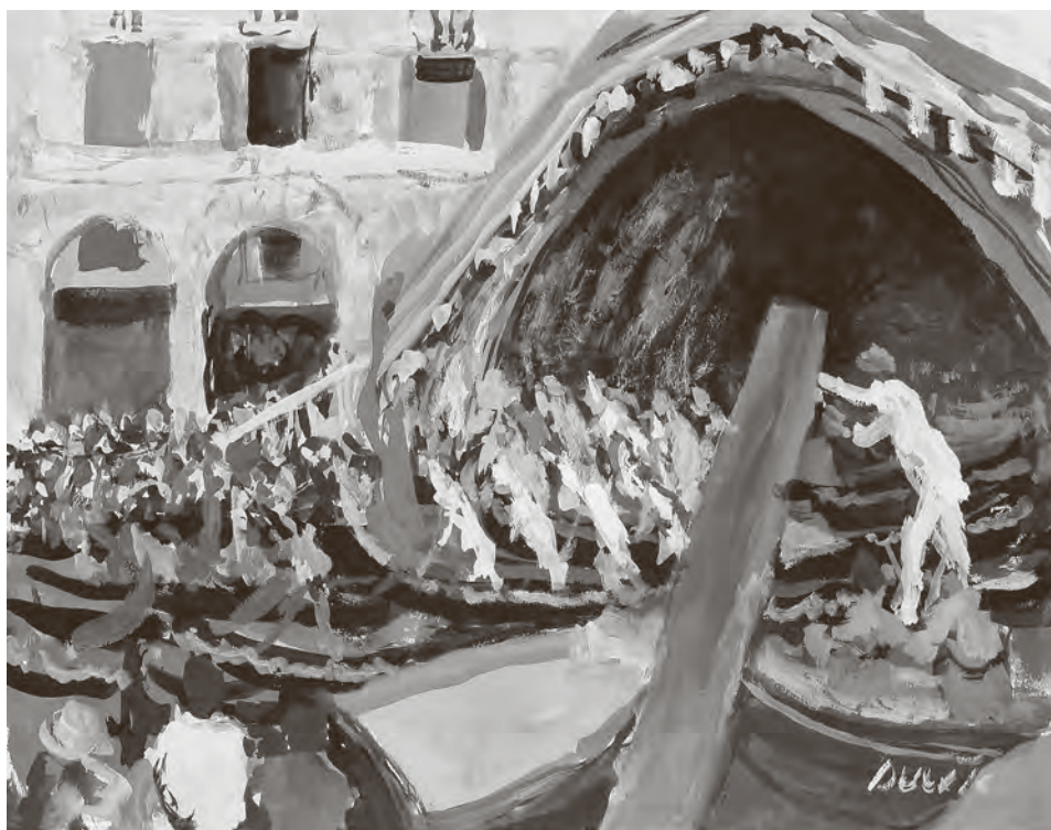
↑ Ivo Dulčić, Venecijanska regata (Venecija), 1952, Moderna galerija

nego ima i ponekih vraćanja unatrag ili pogleda unaprijed, sa svrhom da se razmatrana pojava što bolje osvijetli. Ipak, organizacija građe omogućuje cjelovitu informiranost i hermeneutičku uronjenost, a moramo pridodati i “užitak u tekstu”.