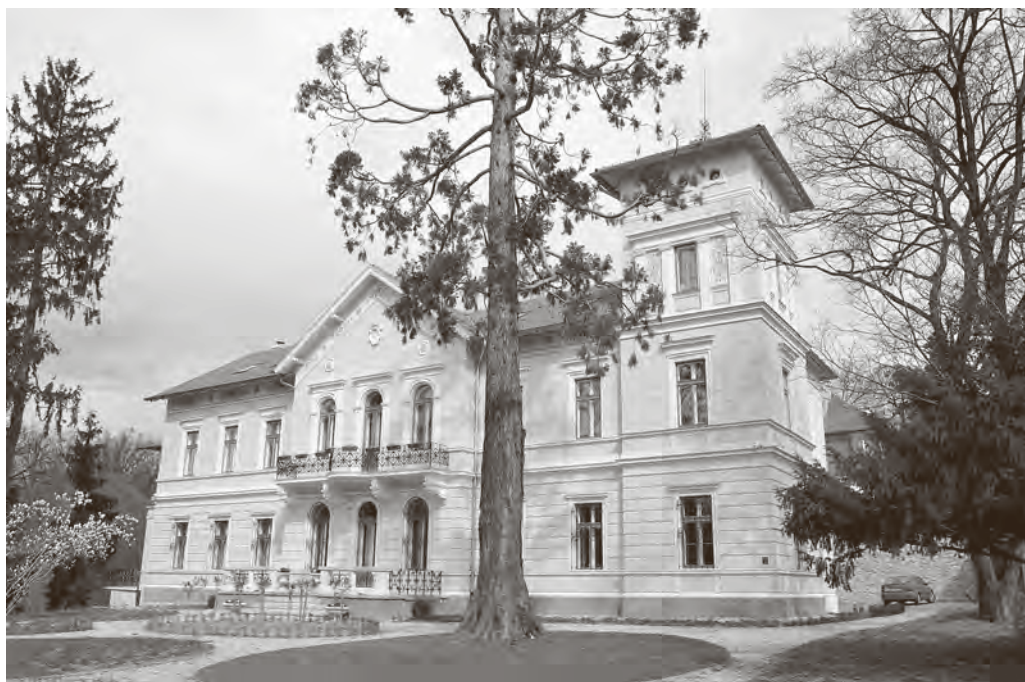
↑ Vila Živković-Adrowski-Lubienski, Jurjevska 27