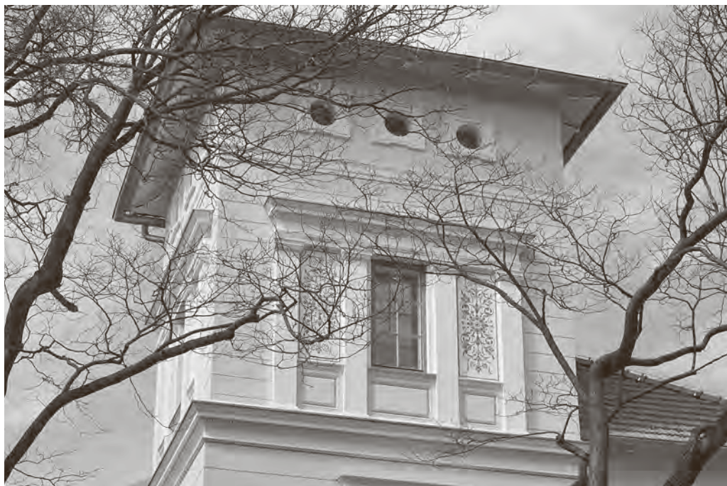
↑ Toranj vile nakon obnove

fotografija te drugih slikovnih priloga, kao i velikim brojem bilježaka, referenci i bibliografijom. Zahvaljujući autorovu živom pripovijedanju i interpretaciji ovog materijala, svaki isplaćeni račun i pronađeni nacrt postaje jednako važan kao i cijela galerija likova koji živo izranjaju tijekom čitanja, bilo da je riječ o uglednim vlasnicima i graditeljima ili o njihovim vrtlarima i služavkama. Knjiga koja je ponajprije pisana kao znanstvena i stručna analiza arhitektonskog spomenika u Damjanovićevoj obradi tako postaje svojevrsan “napeti” roman kulturno-