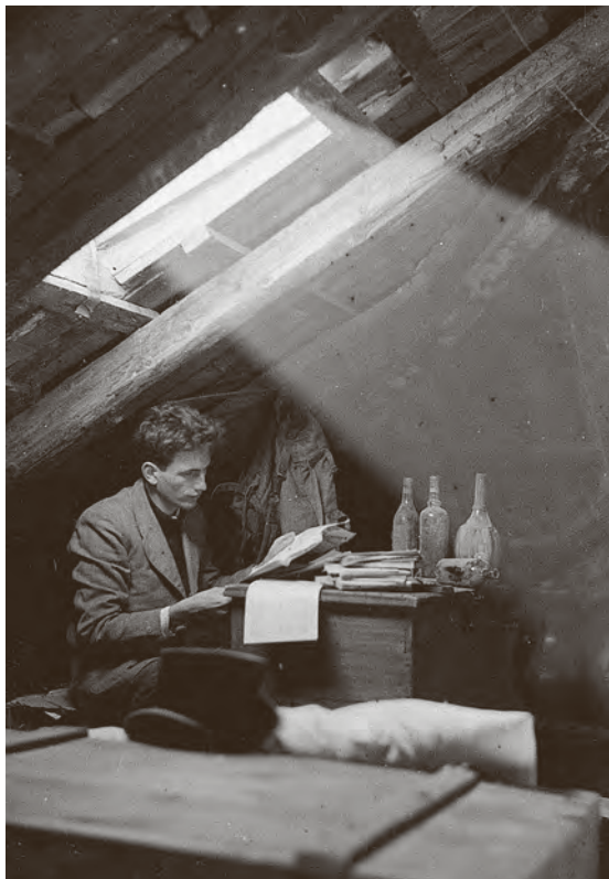
↑ Nenad Gattin, prvi autoportret iz gimnazijskih dana, oko 1947.

Majstor fotografije i cijenjeni povjesničar umjetnosti Nenad Gattin puna je četiri desetljeća posvetio istraživanjima kulturne baštine i spomeničkog korpusa u Hrvatskoj i regiji. Njegovim fotografskim studijama prethodio je uvijek temeljit istraživački rad o nekom umjetničkom djelu ili objektu graditeljske baštine zbog čega u njegovim snimkama, odnosno serijama i danas prepoznajemo izvanrednu vizualnu kvalitetu. Njegov je autorski senzibilitet vrlo rano bio i međunarodno prepoznat, čemu su, dakako, pridonijele višegodišnje kampanje i terenska snimanja povijesnoumjetničkih cjelina i nacionalnih korpusa na čitavom području jugoslovenskih zemalja (primjerice barokna skulptura Slovenije). Njegovi profesori, autoriteti i kasnije suradnici, bili su ugledni istraživači, povjesničari umjetnosti poput Branka Fučića, Cvite Fiskovića, Radovana Ivančevića, Grge Gamulina, Milana Preloga, Vere Horvat Pintarić, Mladena Pejakovića i drugih; već od studentskih dana angažirali su ga u svojim istraživanjima i terenskom radu (od 1954. godine). Fotografija koju je