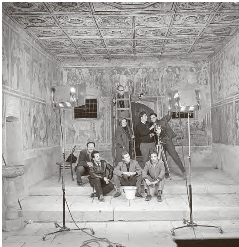
↑ Split, Dioklecijanova palača, 1960-ih (inv. br. neg. 2268A), Fotoarhiv Nenad Gattin/IPU