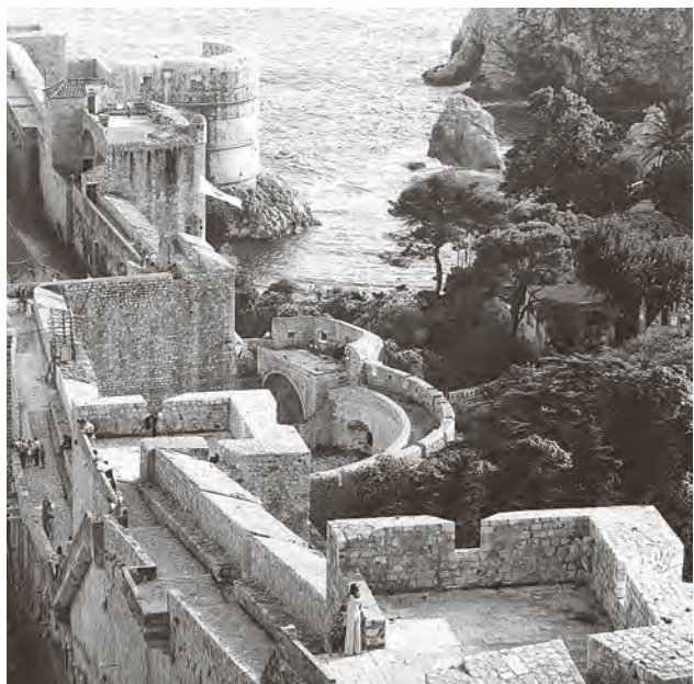
↓ Dubrovnik, zidine, 1970. (inv. br. neg. 6097)

Uz povjerenje obitelji i nasljednika, tim je činom osobni arhivskih fond i fotografski korpus umjetničkih spomenika i graditeljske baštine postao dijelom mnogo šireg konteksta u kojem se dokumentiraju, istražuju i valoriziraju umjetnički fenomeni, osobe, djela i spomenička graditeljska baština u Hrvatskoj. Simbolički je barem djelomično time ostvarena i Gattinova davna ideja o centralnom mjestu na kojem bi se za potrebe temeljnih povijesnumjetničkih istraživanja okupljao što iscrpniji fotografski korpus umjetničkih spomenika i graditeljske baštine: “Centralni fotoarhiv umjetničkih spomenika, povezan sa svim institucijama od naučnih do turističkih, omogućio bi ne samo da naša umjetnička baština i suvremena umjetnost budu sustavno dokumentirane, nego da budu ispravno interpretirane, te da se naučna obrada i popularizacija spomenika vrši pomoću fotografija, koje uz dokumentacionu ispravnost prenose i stvarnu likovnu vrijednost djela koje reproduciraju.” (Čovjek i prostor, br. 110, svibanj 1962.)