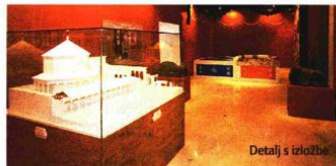
Detalj s izložbe

fičkim oblikovanjem opisuje Palaču s više od stotinjak fotografija, zajedno s nacrtima, tlocrtima i rekonstrukcijama izvornih stanja. Sve zajedno pruža jedan novi doživljaj Dioklecijanove palače, ali i cara koji slovi za jednog od najvažnijih rimskih imperatora. Prigoda u Muzeju grada Splita uključivat će sve do 17. listopada edukativne sadržaje kao što su stručna vodstva, pedagoške radionice i predavanja, pa je za posjetitelje svakog četvrtka u 19 organizirano besplatno stručno vodstvo. Projekt je ostvaren u suradnji s Institutom za povijest umjetnosti, Centrom "Cvito Fisković" i povezan je s turističkim sektorom, vrijedan u predstavljanju Splita i njegove baštine kao kulturno-povijesnog i turističkog središta.