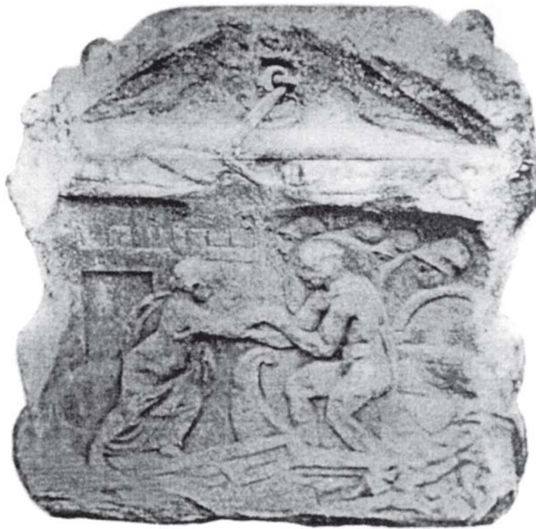
Stela iz bjelovarske župne crkve Stele from Bjelovar parish church

Jedan od najcjelovitijih likovnih opisa događanja u Tauridi i kod nje (ne i čitava Orestija) javlja se na velikom nadgrobnom spomeniku Gaja Spektancija Priscijana iz Šempetra kod Celja, i on je zapravo polazišna točka za razrješavanje mnogih drugih fragmenata. 18 Odavno je poznat i sarkofag iz Weimara, 19 koji također sadrži mnoge elemente mita. Taj je sarkofag izrađen u radionicama u samom Rimu. Konačno, važan je primjerak antički sarkofag iz Tebe, koji je doduše preostao u fragmentima, ali ga je ipak bilo moguće prilično dobro rekonstruirati. 20