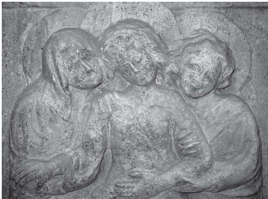
Pavao iz Sulmone, grobni spomenik biskupa de Cardinalibus, detalj (Senj, katedrala) Paolo da Sulmona, Tomb of bishop de Cardinalibus, detail, Senj, cathedral