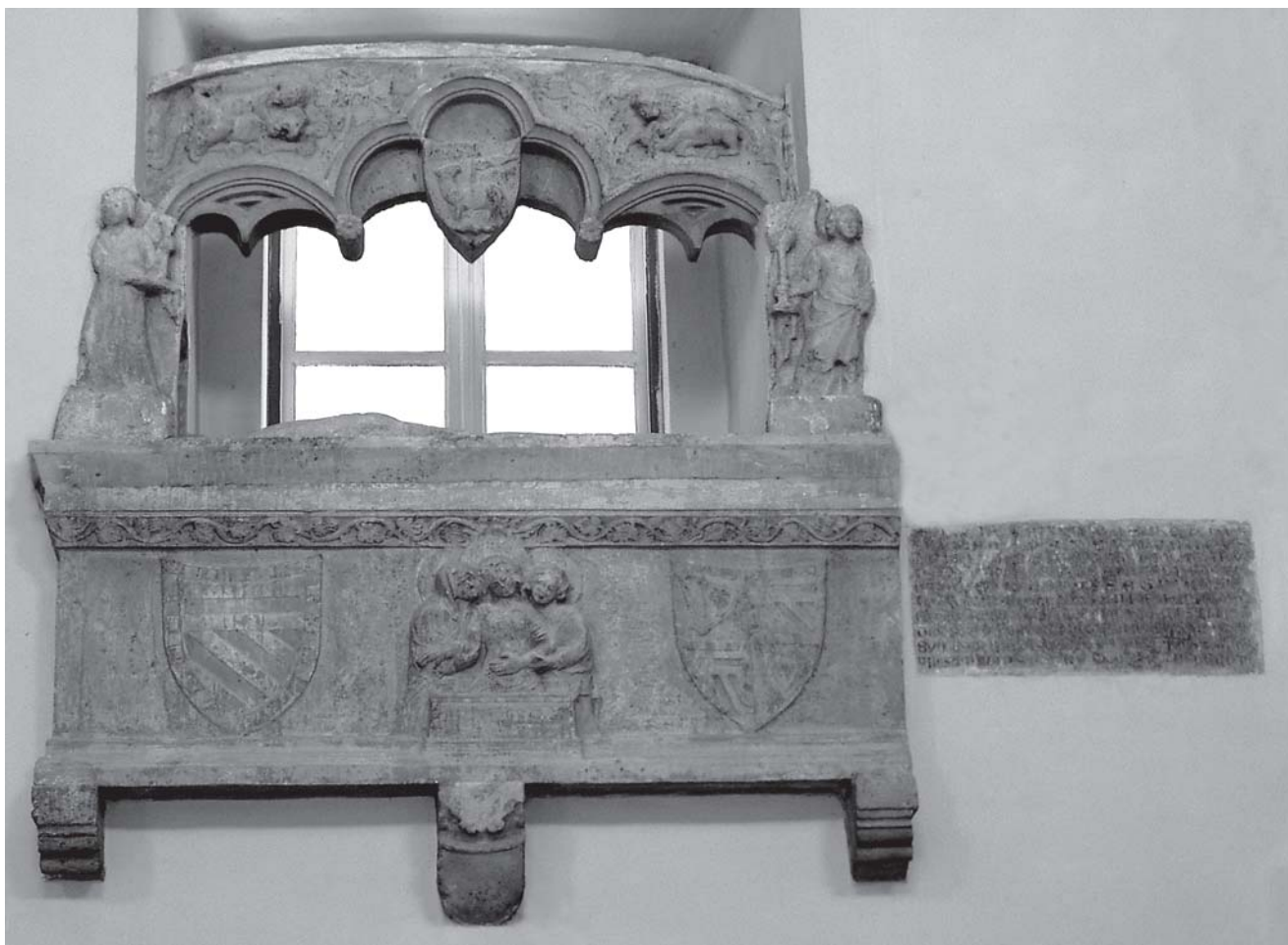
Pavao iz Sulmone, grobni spomenik biskupa de Cardinalibus (Senj, katedrala) Paolo da Sulmona, Tomb of bishop de Cardinalibus, Senj, cathedral

zgrabio jelena, a s lijeve reljef Herakla (?) na leđima lava. Luk je izvorno bio postavljen nešto povišenije u odnosu na sarkofag, te je vjerojatno zatvarao nišu nad njim. 7