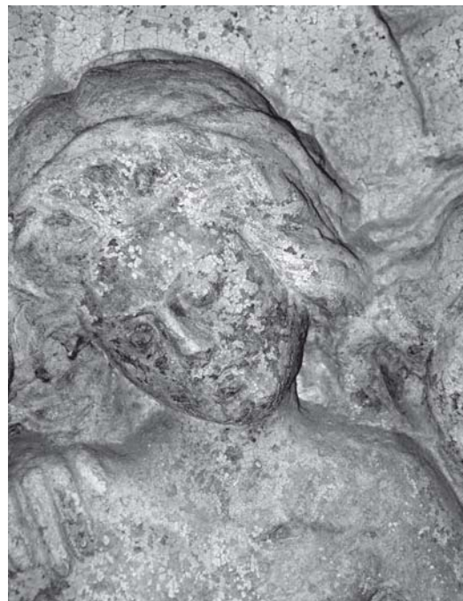
Pavao iz Sulmone, grobni spomenik biskupa de Cardinalibus, detalj (Senj, katedrala) Paolo da Sulmona, Tomb of bishop de Cardinalibus, detail, Senj, cathedral