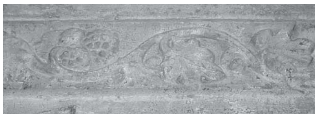
Pavao iz Sulmone, grobni spomenik biskupa de Cardinalibus, detalj (Senj, katedrala)

Paolo da Sulmona, Tomb of bishop de Cardinalibus, detail, Senj, cathedral