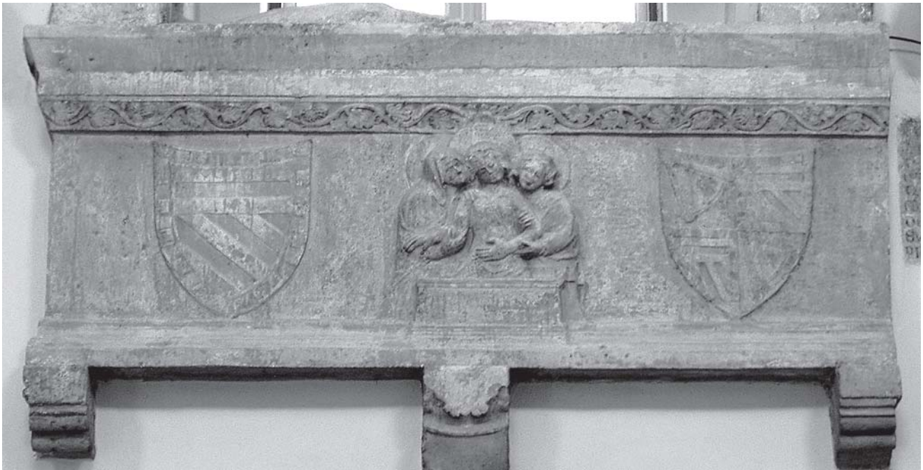
Pavao iz Sulmone, grobni spomenik biskupa de Cardinalibus, sarkofag (Senj, katedrala) Paolo da Sulmona, Tomb of bishop de Cardinalibus, sarcophagus, Senj, cathedral