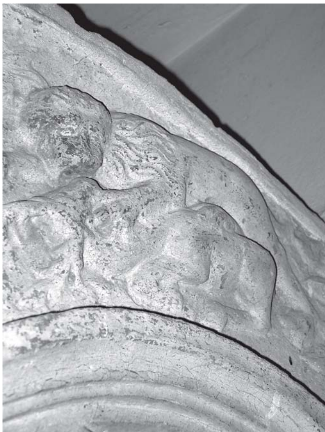
Pavao iz Sulmone, grobni spomenik biskupa de Cardinalibus, detalj (Senj, katedrala) Paolo da Sulmona, Tomb of bishop de Cardinalibus, detail, Senj, cathedral

va arhitektonska struktura upućuju na činjenicu da Pavao iz Sulmone nije bio samo kipar, nego i graditelj. 20