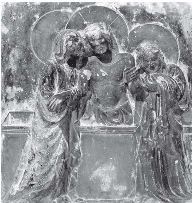
Pavao iz Sulmone, Oplakivanje (Zadar, Stalna izložba crkvene umjetnosti)

Paolo da Sulmona, Mourning, Permanent exhibition of religious art (Stalna izložba crkvene umjetnosti), Zadar