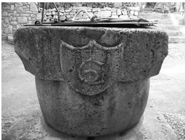
5 Kruna zdenca u dvorištu sklopa Gverini u Salima Water well in the courtyard of the Gverini complex in Sali

Uza začelje starije kuće priljubljena je četverokatna kula kvadratnog tlocrta (4,95 x 7,25 m) s malim pravokutnim