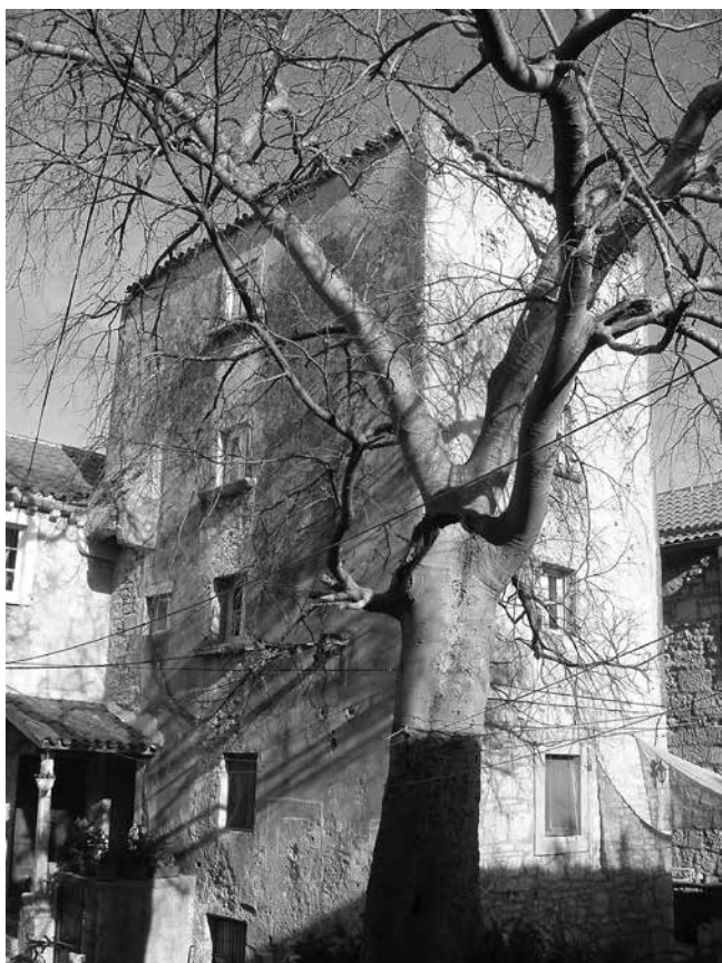
4 Kula sklopa Gverini u Salima Tower of the Gverini complex in Sali

dvorište s cisternom i vrt s kapelom. Taj dio sklopa ograđen je visokim zidom s triju strana, dok se na jugoistočnoj nalazi stambena kuća recentno podignuta na mjestu velike barake iz 17. stoljeća. U pozadini sklopa nalazi se veliki vrt na tri terase kojem se prilazi kroz lučni portal postavljen po sredini jugozapadnog ogradnog zida (sl. 3.).