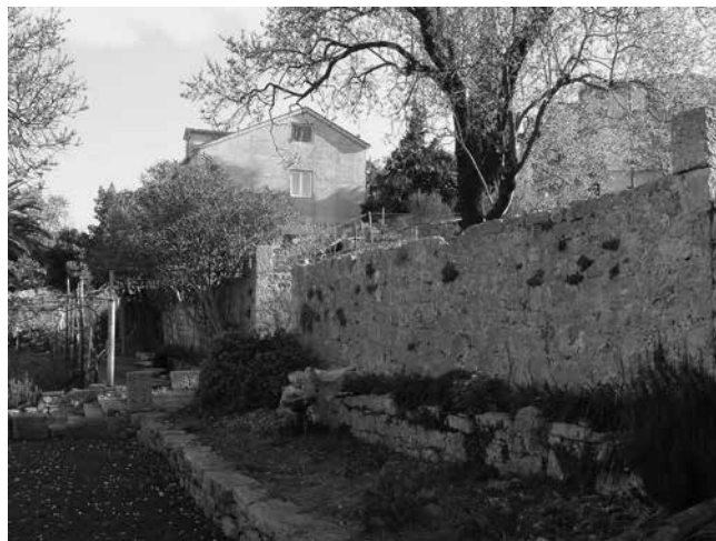
10 Veliki vrt sklopa Gverini u Salima

View to the central promenade in the large garden at the Gverini complex in Sali