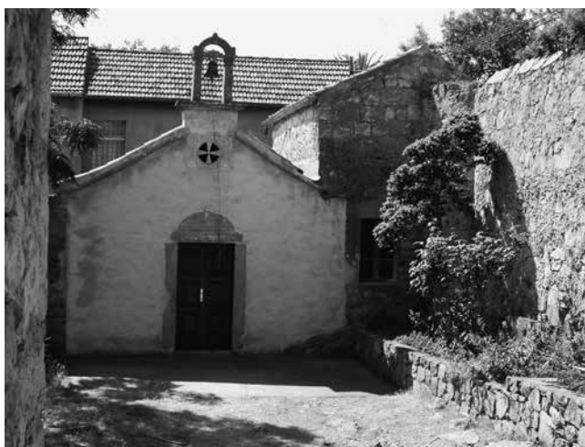
6 Pročelje kapele sv. Nikole u Salima Façade of St Nicholas chapel in Sali

prozorima na svakom katu i bretešom na drugom katu (sl. 4.). Dvorišni ulaz u kuću i ulaz u kulu postavljeni su jedan pokraj drugoga. Zaštićeni su malom nadstrešnicom koju drži poligonalni stupić s jednostavnim kapitelom, poput onih koji služe za nošenje pergole. Kuća i kula su s dvije strane zatvarale dvorište popločano kaldrmom, gdje se nalazi i zdenac s kamenom krunom jednostavnog oblika, na kojoj je u plitkom reljefu istaknut grb s inicijalima Hilarija Gverinija (sl. 5.). Preostali prostor do gornjeg ogradnog zida s jugozapadne strane, sve do kapele u zapadnom kutu sklopa, zauzimao je prostor vrta na povišenoj terasi.