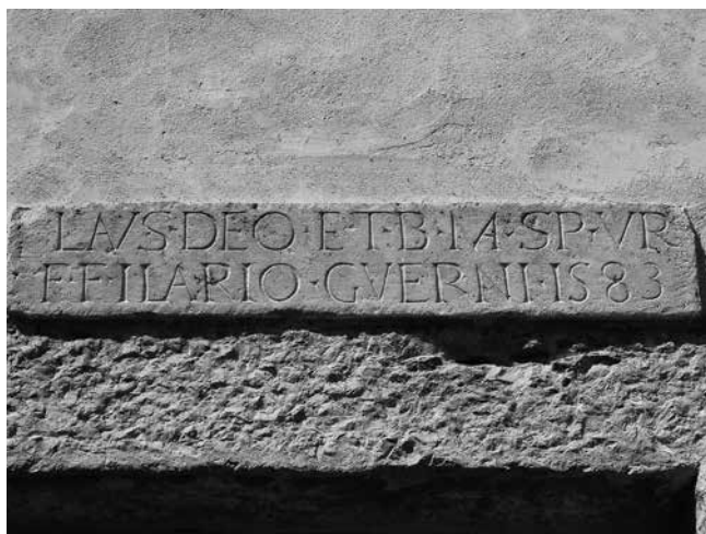
7 Natpis na kapeli sv. Nikole u Salima Inscription on St Nicholas chapel in Sali