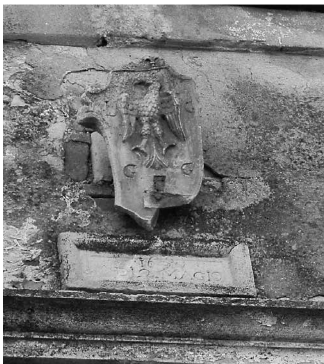
8 Ploča s natpisom i grb na sjevernoj kući sklopa Gverini u Salima

Plaque with an inscription and a coat of arms on the northern house of the Gverini complex in Sali