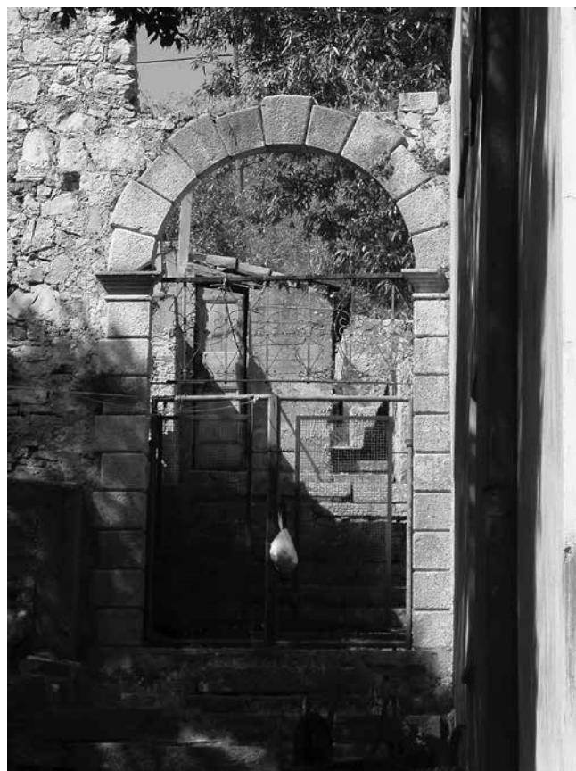
3 Vrtni portal sklopa Gverini u Salima Garden portal at the Gverini complex in Sali

Plan of the Gverini complex in Sali, according to the cadastre maps of Dalmatia (State Archive in Zadar, Mape catastali 1830, Comune Sale): 1 south eastern house, 2 tower, 3 chapel, 4 north western house, 5 hut, 6 garden house, a main entrance, b garden portal, c large garden