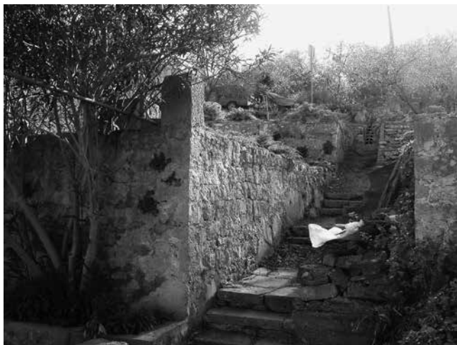
9 Pogled na središnju šetnicu velikog vrta sklopa Gverini u Salima

View to the central promenade in the large garden at the Gverini complex in Sali