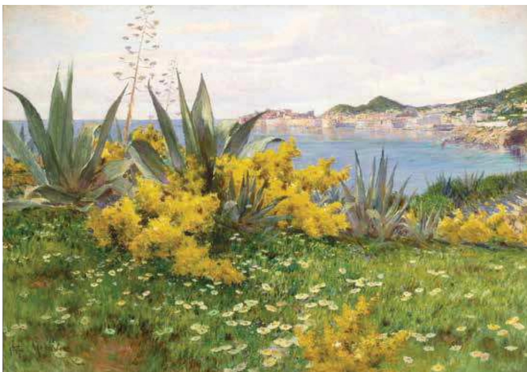
11 M. C. Medović, Pogled na Dubrovnik , 1909., ulje na platnu, 71 × 103 cm, Društvo sveučilišnih nastavnika i drugih znanstvenika, Zagreb

E. J. Schindler, Sea Bay, 1888, oil on canvas, 59 × 106 cm, Narodni muzej Slovenije, Ljubljana, Inv. No. N 7867