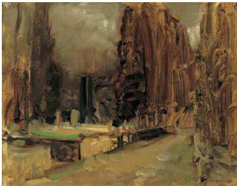
6 E. J. Schindler, Groblje u Gružu kod Dubrovnika (Studija za Pax) , 1887./1888., ulje na drvu, 26 × 32,5 cm, ©Belvedere, Wien Inv. br. 5568