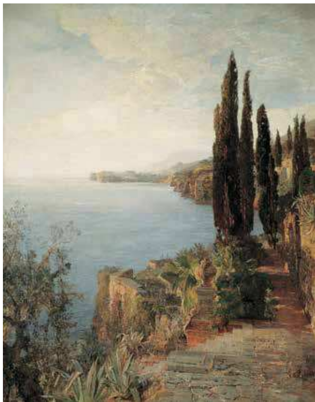
8 E. J. Schindler, Na dalmatinskoj obali kod Dubrovnika , 1888., ulje na platnu, 152 × 120 cm, ©Belvedere, Wien Inv. br. 3734