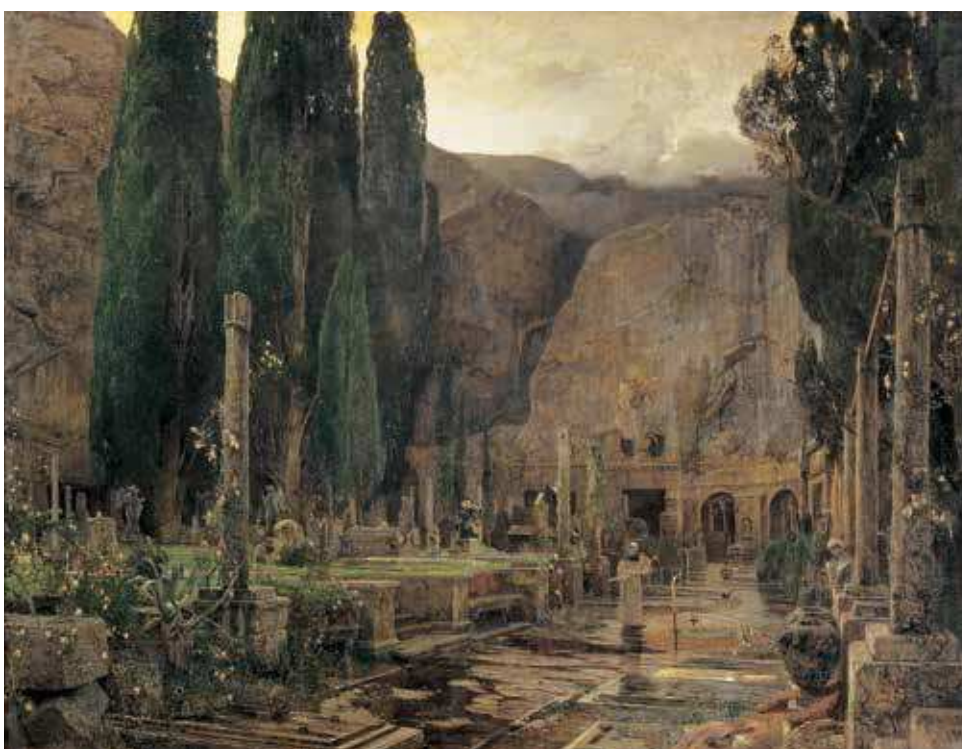
7 E. J. Schindler, Pax. Groblje u Gružu kod Dubrovnika , 1891., ulje na platnu, 207 × 271 cm, ©Belvedere, Wien Inv. br. 2548