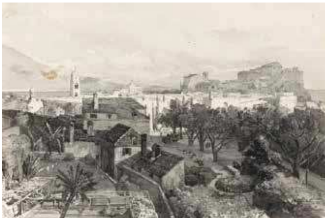
4 E. J. Schindler, Dubrovnik: pogled sa sjevera , 1888., akvarel, ilustracija za Kronprinzenwerk (Europeana Travel ÖNB 9833208)

E. J. Schindler, Dubrovnik: View from the North , 1888, watercolour, illustration for Kronprinzenwerk (Europeana Travel ÖNB 9833208)