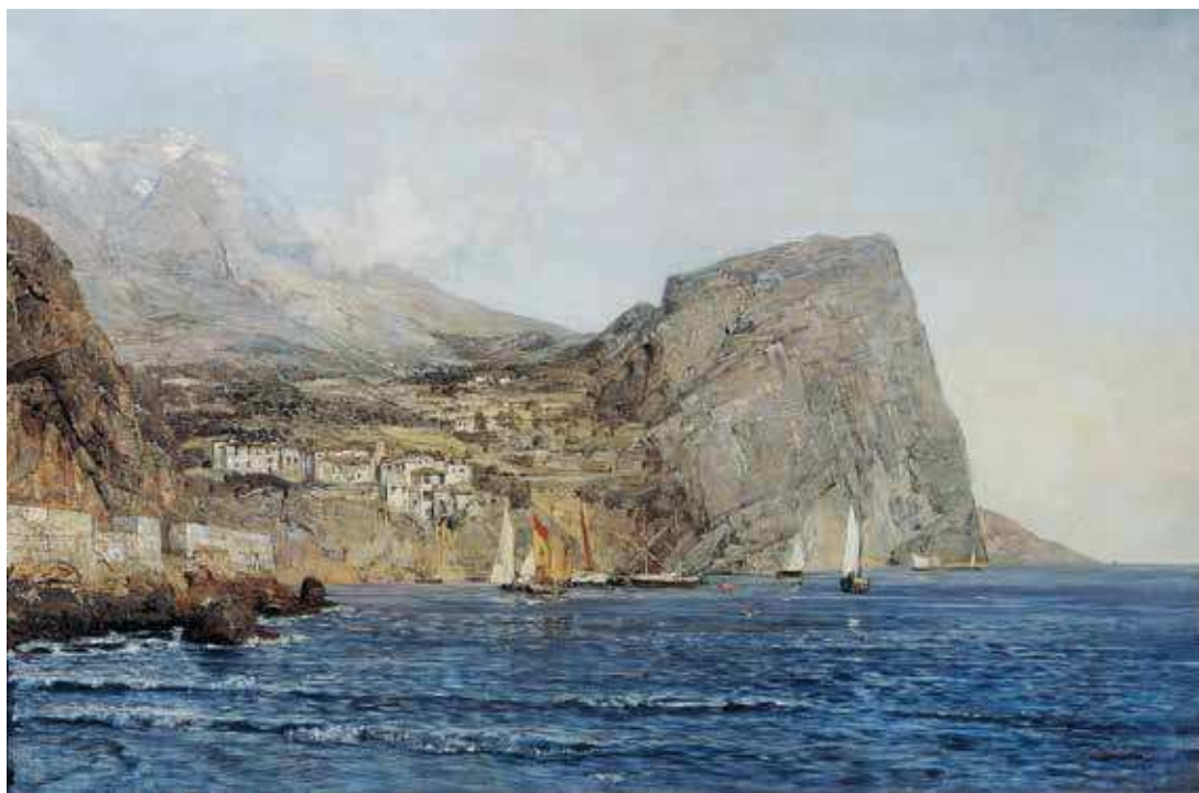
9 E. J. Schindler, Dalmatinska obala , 1890., ulje na platnu, 71 × 106 cm, ©Belvedere, Wien Inv. br. 5971

Medović po povratku iz Rima, od svibnja 1886. do listopada 1888. godine boravi u Dubrovniku, što se poklapa sa Schindlerovim zimskim putovanjem Dalmacijom. 22 Na temelju Medovićevih dnevnika zabilješki saznajemo za njegov susret sa Schindlerom u Dubrovniku i preporuku koju mu daje za nastavak studija na Akademiji likovnih umjetnosti u Münchenu kod profesora Ludwiga Löffftza te za kraći Medovićev boravak kod Schindlera u Plankenbergu. Medović je zabilježio: »Skroz tu istu godinu (1887., op. a.) došao je u Dubrovnik prof. Schindler iz Beča, glasoviti krajolični slikar (Landschaftsmaler) on je došao kod mene u društvu g. grofa Mata Pučića (Pozza) i bio mi je predstavljen, vidio je moje stvari i vrlo su ga zanimale i zauzeo se da bih ja išao u Monakovo u Akademiju te pisao svom prijatelju glasovitom profes. Lefftzu, i preporučio mu da me uzme u njegovu školu; istodobno poslao mu je 2 moje studije. Lefftz mu je odgovorio da samo neka dođem da će me rado primiti u svoju školu. (...) Na prolasku iz Beča u Monakov povratio