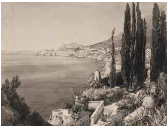
5 E. J. Schindler, Dubrovnik: pogled s istoka , 1888., akvarel, predložak za ilustraciju u Kronprinzenwerk (Europeana Travel ÖNB 9833215)

E. J. Schindler, Dubrovnik: View from the North , 1888, watercolour, illustration for Kronprinzenwerk (Europeana Travel ÖNB 9833208)