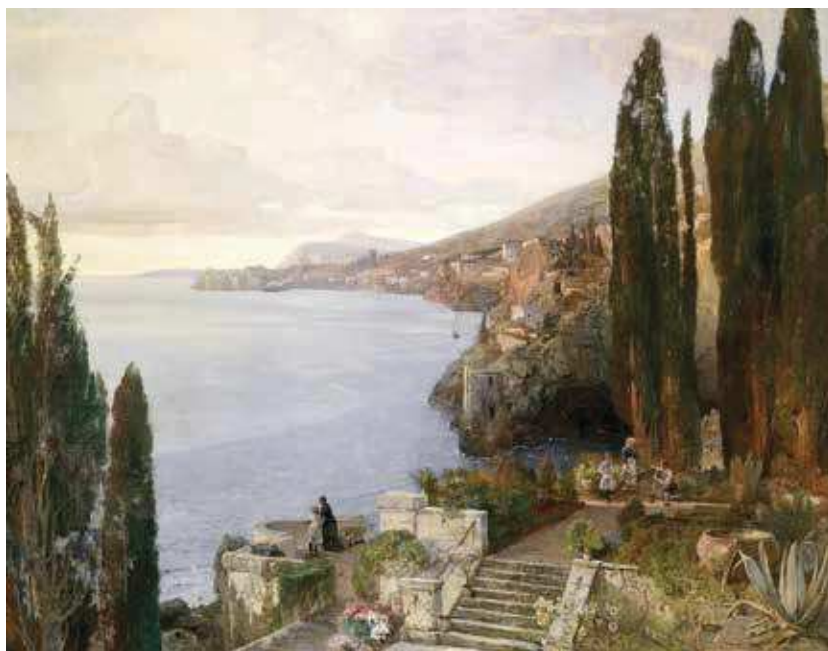
3 E. J. Schindler, Pogled na Dubrovnik , 1890., ulje na platnu, 140 × 180 cm, Dorotheum, Wien

E. J. Schindler, Sea Cliffs near the Fortress of St Laurence in Ragusa, 1887/1888, oil on wood, 26 × 32 cm, ©Wien Museum Inv. No. HMW 24895