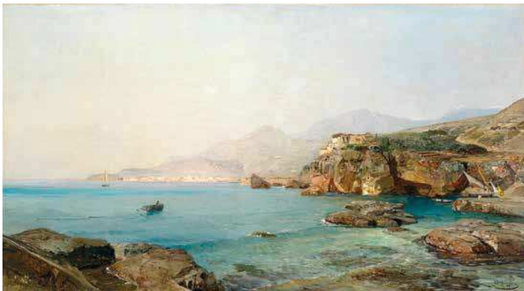
10 E. J. Schindler, Morski zaljev , 1888., ulje na platnu, 59 × 106 cm, Narodni muzej Slovenije, Ljubljana, Inv. br. N 7867

E. J. Schindler, Sea Bay, 1888, oil on canvas, 59 × 106 cm, Narodni muzej Slovenije, Ljubljana, Inv. No. N 7867