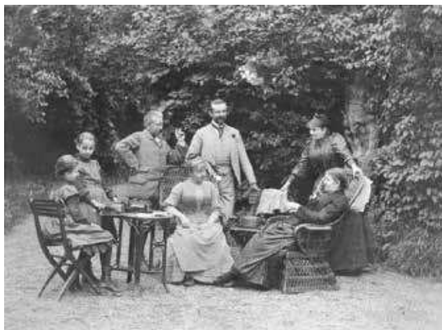
1 Schindler s obitelji i prijateljima u perivoju dvorca Plankenberg, oko 1889. Slijeva: Alma Schindler, Margarethe (Grete) Schindler, Emil Jakob Schindler, Carl Moll, Anna Bergen Schindler

Schindler with his family with friends in the park of the Plankenberg castle, around 1889. From the left: Alma Schindler, Margarethe (Grete) Schindler, Emil Jakob Schindler, Carl Moll, Anna Bergen Schindler