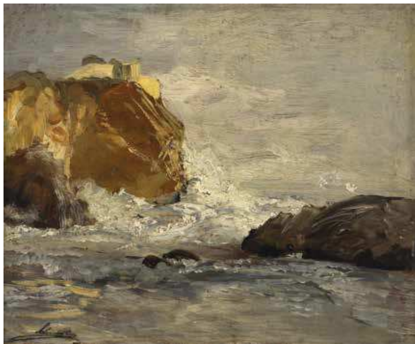
2 E. J. Schindler, Morske stijene kod tvrđave Lovrijenac u Dubrovniku , 1887./1888., ulje na dasci, 26 × 32 cm, ©Wien Museum Inv. br. HMW 24895

E. J. Schindler, Sea Cliffs near the Fortress of St Laurence in Ragusa, 1887/1888, oil on wood, 26 × 32 cm, ©Wien Museum Inv. No. HMW 24895