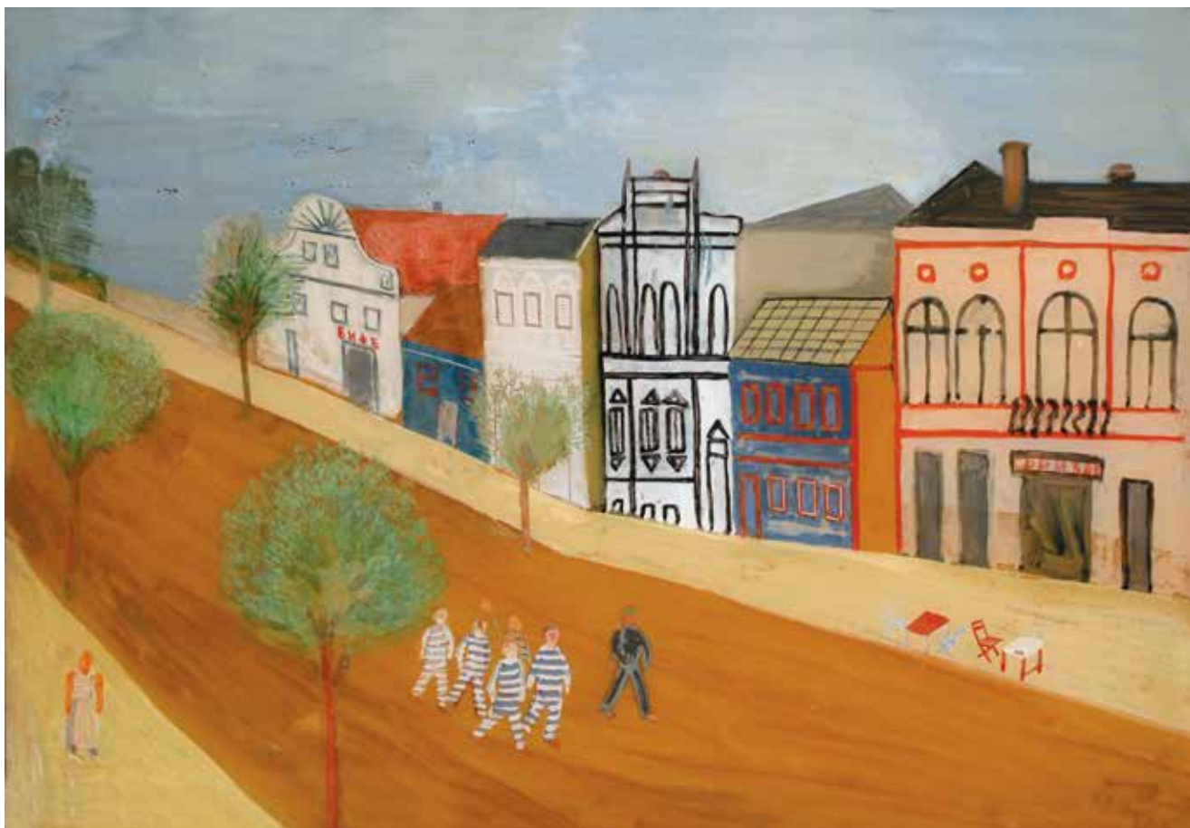
1. Željko Hegedušić, Motiv iz Srijemske Mitrovice , 1934., Moderna galerija, Zagreb Željko Hegedušić, A Motif from Srijemska Mitrovica , 1934, Modern Gallery , Zagreb

uličnih fasada. Glavni protagonist je ulica sama, a slikom prevladava opći dojam uznemirujuće praznine, unatoč tome što se u središtu donjeg dijela kompozicije pojavljuje omanja skupina zatvorenika praćena zatvorskim čuvarom. Štoviše, dijelovi motivskog inventara slike – skupina ljudi koja korača posred ulice, zatim usamljen prolaznik u donjem lijevom kutu slike te napuštene stolice sa stolovima na nogostupu – samo pojačavaju taj neuobičajen dojam. Hegedušić je na ovoj slici iznimno deskriptivan; važno mu je prugastim odjelima pokazati da su naslikani ljudi zatvorenici, pažljivo zatim iscrtava sve detalje na fasadama, a natpisima daje do znanja da su ulični lokali prikazani na slici bife i frizer. Upravo će se tim mjestimičnim detaljnim opisivanjem, a posebice ispisivanjem cimera – znakova kojim se označava djelatnost pojedinoga uslužnog ili trgovačkog objekta – uklopiti u opću zemljašku deskriptivnost. Također, težnja plošnom prikazivanju i produktivan suživot linije i plohe obilježja su koja ovo Hegedušićevo djelo dodatno približavaju načinu slikanja koji je zagovarao njegov stariji brat. Ipak, unatoč željenoj pojednostavljenoj koncepciji, koja posjeduje izrazite »infantilističke« tendencije u perspektivnom prikazu, 17 Željko Hegedušić stvara djelo koje je kao cjelina znatno drukčije od onoga što je trebala biti socijalna umjetnost ili kritički realizam Udruženja umjetnika Zemlja. Naime, kritika suvremenog društva na Motivu iz Srijemske