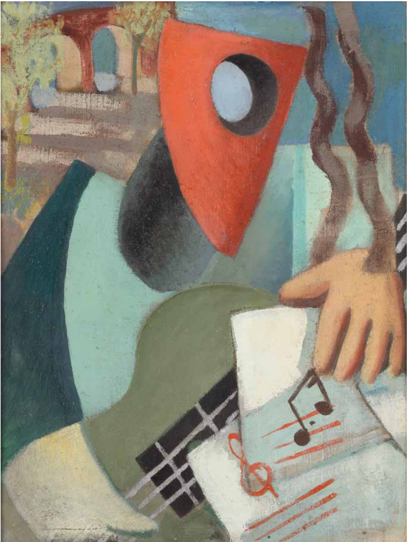
4. Željko Hegedušić, Kompozicija , oko 1935., Moderna galerija, Zagreb Željko Hegedušić, Composition, around 1935, Modern Gallery, Zagreb