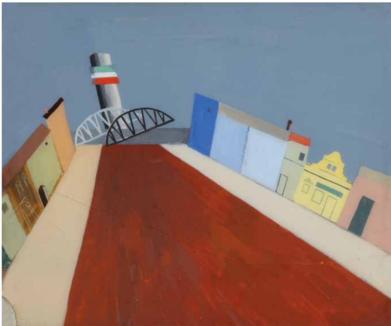
2. Željko Hegedušić, Parobrodarska ulica , 1934., Moderna galerija, Zagreb Željko Hegedušić, Parobrodarska Street , 1934, Modern Gallery , Zagreb

pokazao je izrazitu stvaralačku samosvojnost: uklopio se – bez egzaltiranoga kritičkog usmjerenja – u očekivan plošan prikazivački način, a specifičnim artikulacijama nadrealnih ozračja istodobno je obogatio nevelik korpus nadrealističkih priklopa u hrvatskome međuratnom slikarstvu. Baveći se ulicom kao metaforom za prazninu i izmijenjeno stanje svijesti, a zatim i znakom otuđenosti pojedinca u suvremenom društvu, umjetnik je zapravo svjesno zakoračio na područje avangarde. 23 Ipak, nije nastavio putem redukcije gradskog krajolika i razrade poetike praznine u nadrealističkom ključu, pa će tih par sačuvanih slika na staklu nastalih sredinom tridesetih u Srijemskoj Mitrovici ostati samo apartna epizoda unutar korpusa hrvatskoga modernog slikarstva. 24