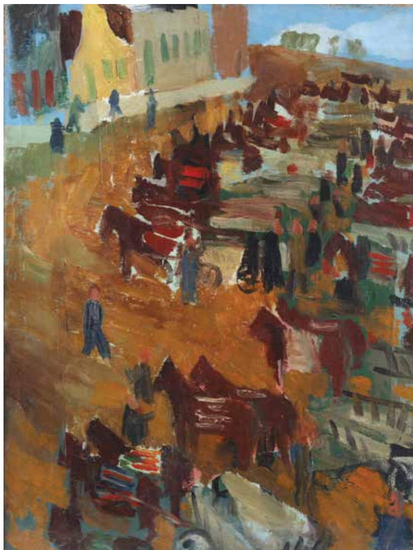
3. Željko Hegedušić, Žitna pijaca u Mitrovici , 1935., Moderna galerija, Zagreb

Željko Hegedušić, Grain Market in Mitrovica, 1935, Modern Gallery, Zagreb