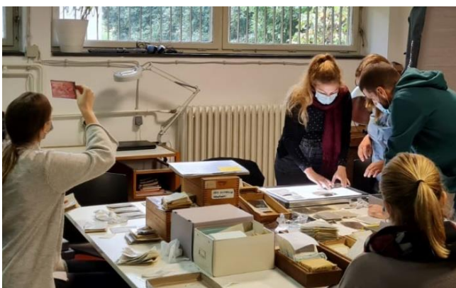
Samostalni rad u fototeci Instituta

Intenzivni hands-on trening u trajanju od 12 tjedana (voditeljica: Irena Šimić) odvijao se uživo u Institutu za povijest umjetnosti, a organiziran je kroz tematske module pod vodstvom stručnjaka iz različitih polja.