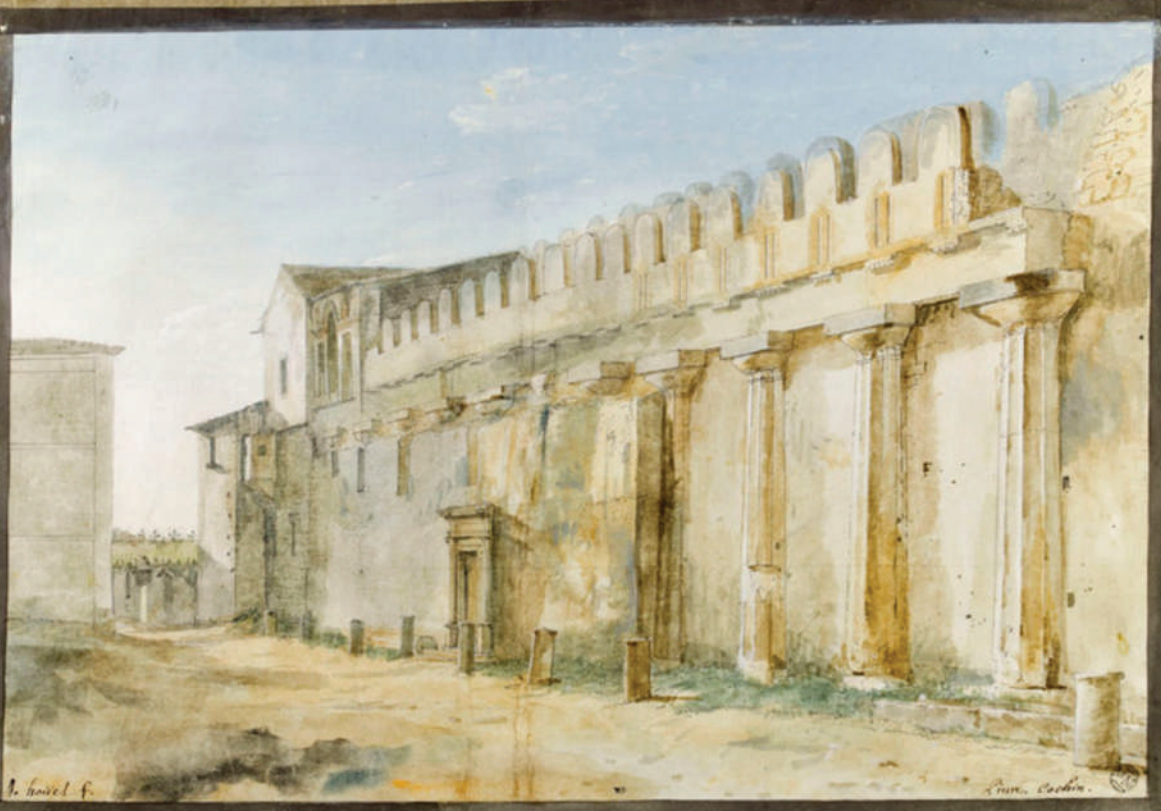
Vue d'une partie latérale du temple de nosse, dont on a fait la cathédrale de Beauvais — planche gravée 104 —