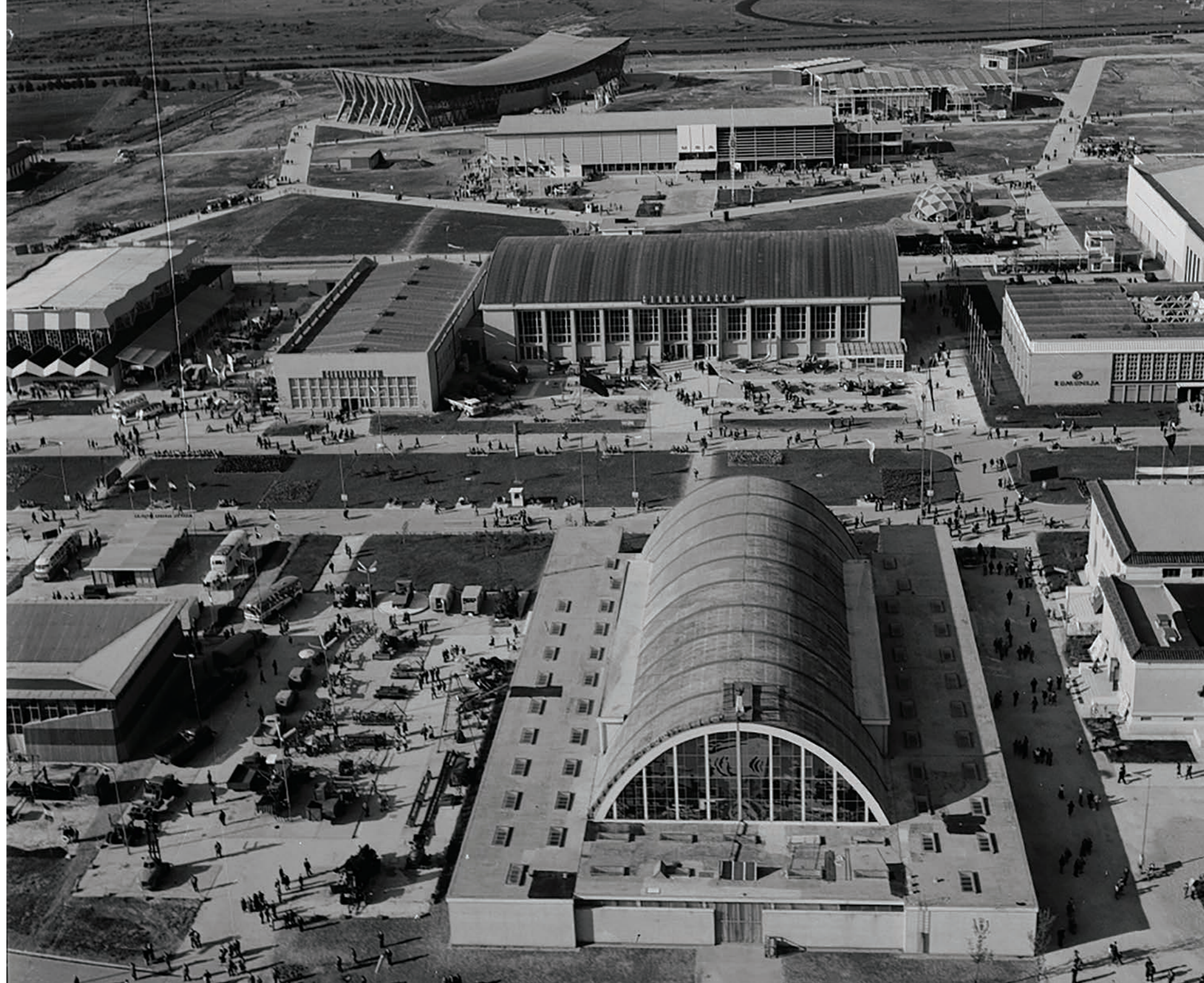
Pogled na Aleju nacija, 1956.

Odluka da se 1955. godine krene u izgradnju novog sajamskog prostora na desnoj obali Save rezultirala je gradnjom jednog od najvećih sajmišta u poslijeratnoj Europi te omogućila stvaranje infrastrukturnih preduvjeta potrebnih za razvoj Novog Zagreba. U periodu od 1956. do 1990. podignuto je preko 50 što paviljonskih što pomoćnih zgrada koje su iz godine u godinu ugošćavale trgovce, tvrtke i posjetitelje iz cijeloga svijeta. Tijekom pedesetih Zagreb je jedno od rijetkih mjesta na kojemu neposredno trguju zemlje Istočnog i Zapadnog bloka, da bi šezdesetih Velesajam bio trgovinsko i diplomatsko ogledalo politike nesvrstanosti s najvećim brojem zemalja trećeg puta koje izlažu svoje proizvode. Paralelno, posjetitelji osim općih izložbi uzoraka, pohode izložbe suvremenog odijevanja, dizajna i načina oblikovanja životnog prostora, izložbe knjiga i tehnike, edukativne formate povezane s emancipacijom žena, razvojem turističkih navika i kulturne događaje. Izvan sajamskih termina neki od paviljona služe kao setovi za impozantne filmske setove, drugi za kulturne i sportske priredbe.