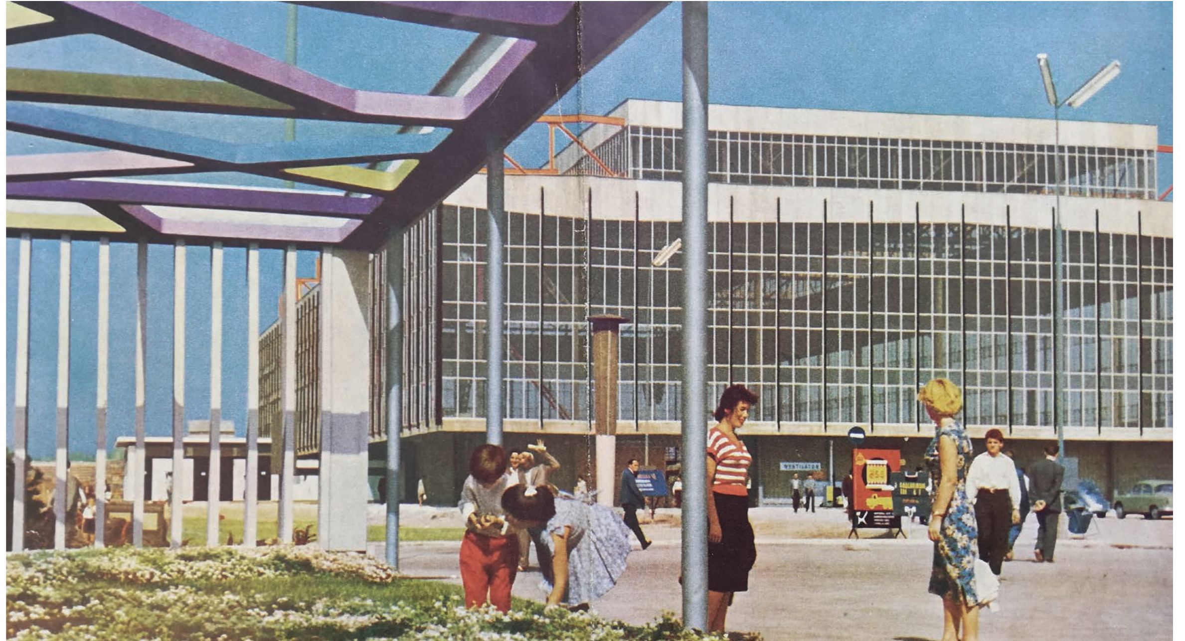
HR-DAZG-1172. Katalozi. JZV 1959.,9