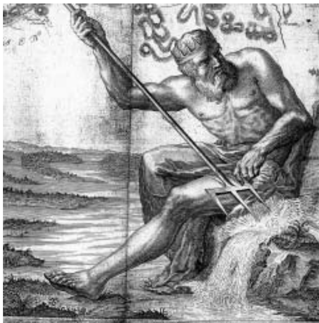
Dio umjetničke ilustracije Müllerove karte Ugarske iz 1769. godine.