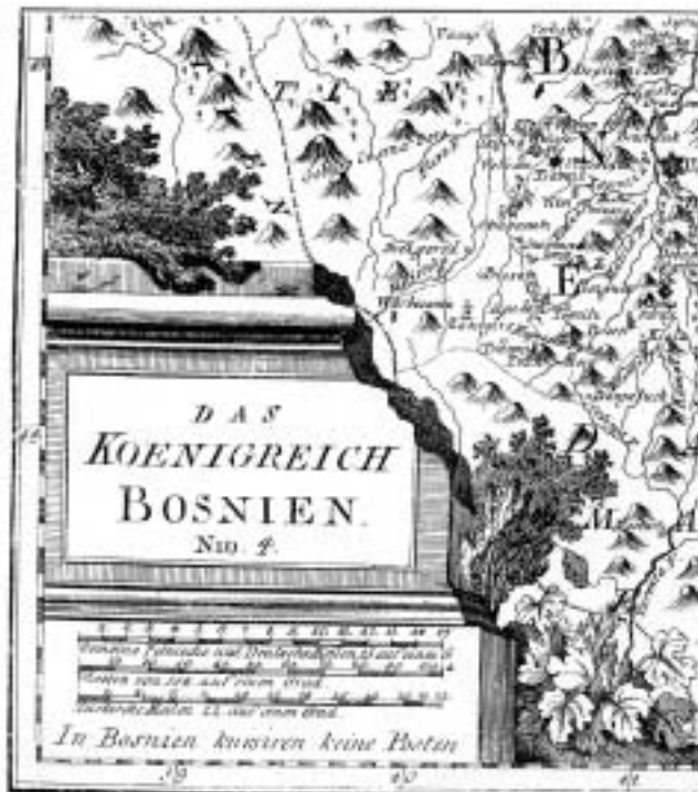
Klasicistička kartuša s Reillyeve karte Bosne iz 1790. godine.