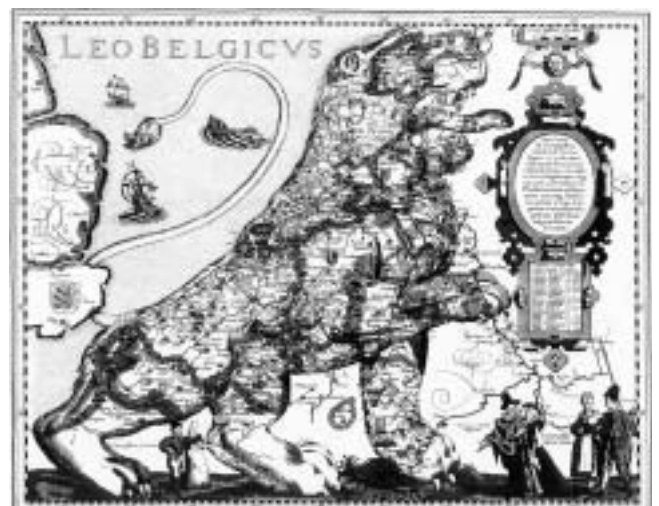
Belgija na karti Michaela Aitzingera iz 1581. godine.