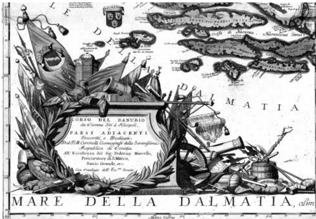
Barokna kartuša s Coronellijeve karte Podunavlja iz 1688. godine inspirirana mletačko-turskim ratovima.