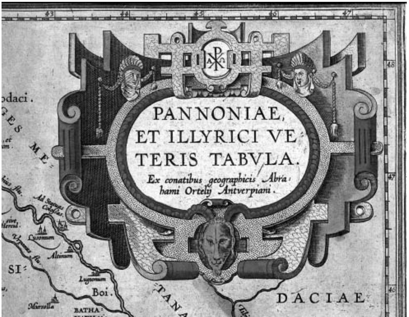
Kasnorenesansna kartuša s karte Ilirika Abrahama Orteliusa iz 1572.