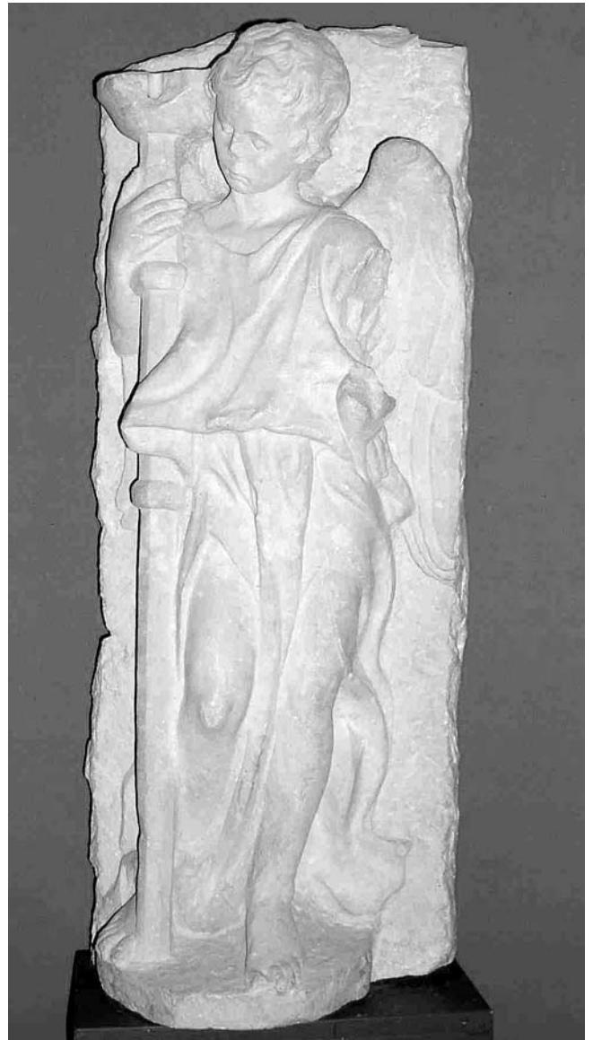
Anđeo bakljonoša (Lapidarij u sklopu Muzeja grada Trogira)