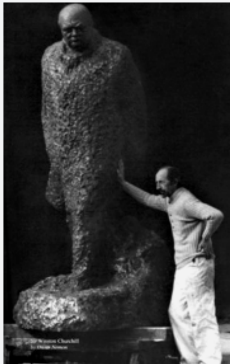
Oscar Nemon, Sir Winston Churchill, oko 1960.

Veoma je interesantan Nemonov susret s Winstonom Churchillom, u Marakeshu 1951. godine. Slučajan susret postao je početkom prijateljstva koje će ishoditi mnogim premijerovim portretima. Među brojnim Churchillovim portretima svakako je najpoznatiji onaj što ga je kipar oblikovao 1965. godine, kao narudžbu britanske vlade povodom premijerove smrti. Brončani odljev djela danas je smješten s lijeve strane predvorja Donjeg doma britanskog parlamenta. Čitav je ulaz u Donji dom protkan simbolikom. Naime, prilikom bombardiranja Londona taj je dio parlamentarnih odaja u znatnoj mjeri bio uništen.