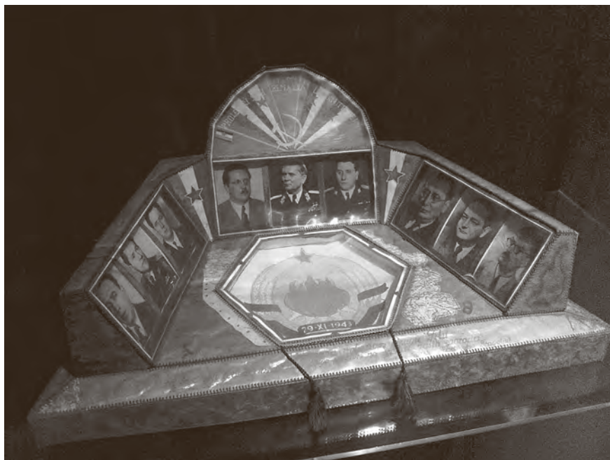
o Iz postava izložbe Refleksije vremena, Klovićevi dvori str. 62-66