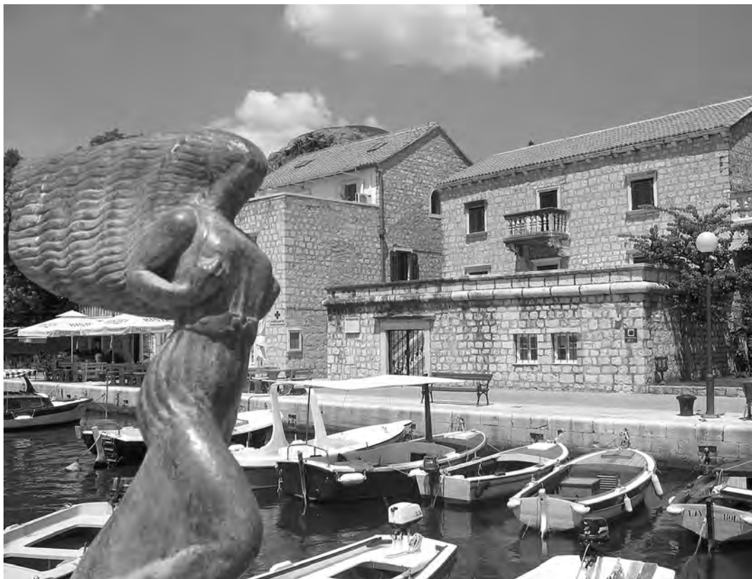
↑ Galerija umjetnina "Branislav Dešković" u Bolu na Braču

zahvaljujući svojoj upornosti, uspijeva najveći broj djela nabaviti otkupom, uz financijsku potporu nekadašnjeg općinskog i republičkog fonda za kulturu, ali i donacijama umjetnika i institucija. 6 Ta se praksa nastavlja. Donacija Šime Perića izbor je s izložbe u prizemlju galerije u ljeto 2013.