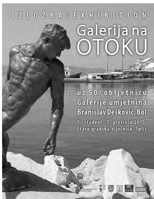
↑ Plakat izložbe

Umjetnine iz fundusa Galerije umjetnina Branislav Dešković na mnogim su retrospektivama hrvatskih umjetnika ili u pregledima hrvatske umjetnosti moderne zauzimale istaknuto mjesto. Prisetimo se samo retrospektivne izložbe Jurja Plančića u Muzejskom prostoru Zagreb (danas Galeriji Klovičevi dvori) 1996., i retrospektive Ignjata Joba u Umjetničkom paviljonu u Zagrebu 1998., na kojima su neka od ključnih djela opusa obojice umjetnika bila upravo iz bolske galerije. U vlasništvu galerije je i antologijska slika našeg magičnog realizma, Pučića (1923.) Jerolima Miše. Međutim, zbog neprihvatljivih uvjeta, galerija nije imala kontinuitet izlaganja i njezin je vrijedni fondus sve do 2010. većinom bio nedostupan javnosti. Godine 1981. otvoren je privremeni, tzv. ljetni postav galerije i tom je prigodom bio promoviran do nedavno jedini katalog galerije. 1 Stoga je izložba u Splitu ujedno i