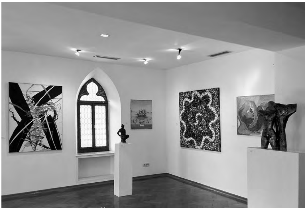
↑ Postav izložbe na drugom katu, Stara gradska vijećnica, Split.

Iako utemeljena 1963., galerija dugo nije imala primjeren prostor za izlaganje i pohranu umjetnina; prva izložba održala se 1967. u prostoriji uprave hotelskog poduzeća Zlatni rat; od 1968. do 1974. stalni je postav bio u prostorijama Kulturno-umjetničkog društva Josip Bodlović, a kada je 1978. konačno dobila vlastiti prostor ni on nije zadovoljavao sve uvjete. 4 Idejna koncepcija galerijske zbirke, kako ju je dolično zamislio njezin utemeljitelj, bila je prikupljanje djela hrvatske moderne i suvremene umjetnosti čiji su autori zavičajno, emocionalno ili na neke druge načine bili povezani s otokom Bračem iako su, u manjem broju, zastupljeni i autori koji nisu bili posebno vezani za otok. Galerija nosi naziv po velikom kiparu hrvatske moderne, rodnom iz Pučišća, i u njezinom je fundusu zaokružen presjek stvaralaštva Branislava