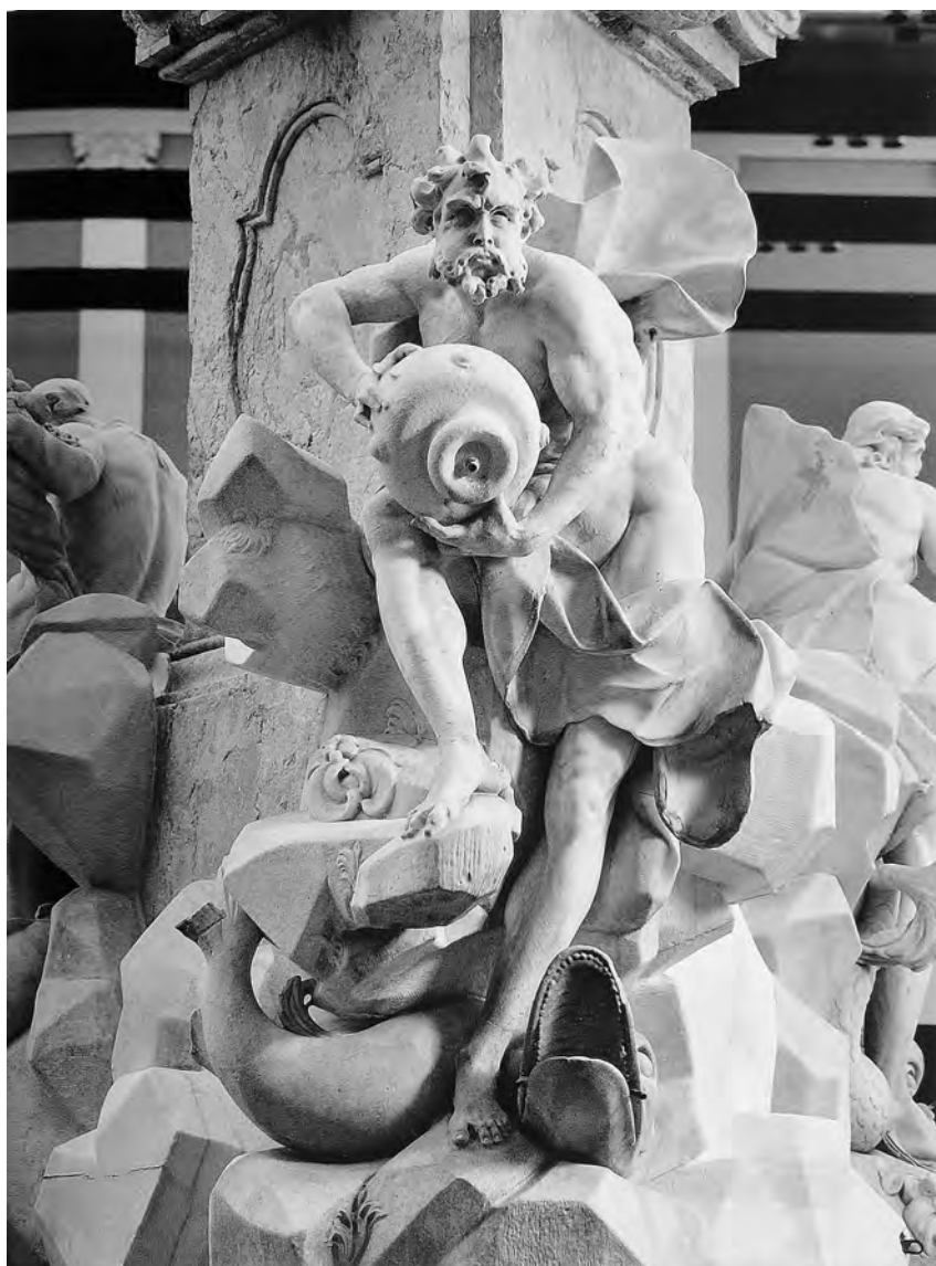
← Francesco Robba, Riječno božanstvo , Fontana triju kranjskih rijeka na Mestnom trgu u Ljubljani, Narodna galerija, Ljubljana

umjetnike toga razdoblja – primjerice, u propitivanju mogućnosti oblikovanja površine i volumena draperija, koja su se nametnula i pod rimskim utjecajem, a koja svjedoče o paralelnim istovremenim traženjima novih stilskih mogućnosti. Time se nagoviješta zaključak epohe baroknog kiparstva; simbolički podcrtano, iste godine kada u Zagrebu umire Robba, u Veneciji je rođen Canova, koji uvodi kiparstvo u klasicizam.