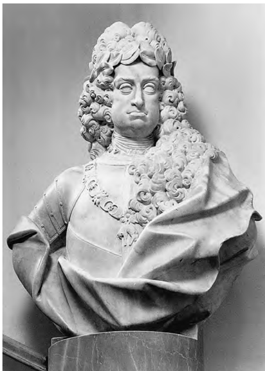
↑ Francesco Robba, Karlo VI , Gradski muzej, Ljubljana