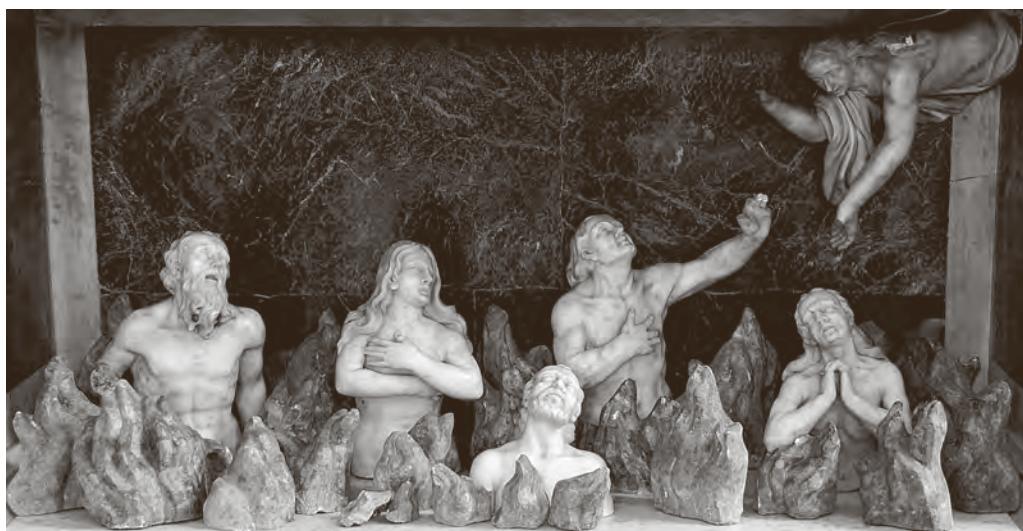
↑ Detalj oltarne niše sa skulpturama Duša u čistilištu

u posljednjoj četvrtini godine održano više javnih predavanja, nekoliko organiziranih vođenja po inače nedostupnom samostanu te izložba plakata na otvorenom.