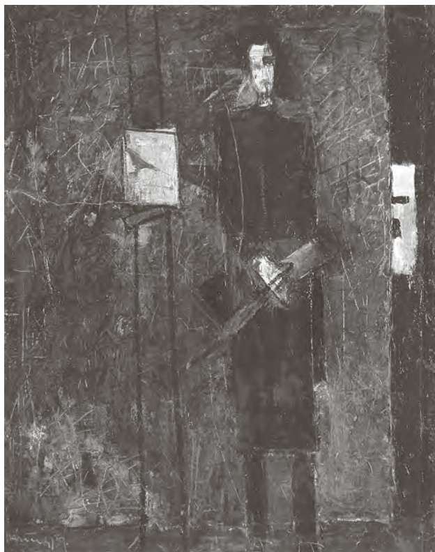
← Ljubo Ivančić, Autoportret sa štafelajem , 1957., reprodukcija iz kataloga.

a pojavio se oko 1640., dakle, neposredno prije nego što je sugrađanin Philipsa Angela II. – isto iz Leidena, ali slaviji, Rembrandt – slikao remek-djelo grupnoga portreta poznato pod nazivom Noćna straža i to upravo u vrijeme kada slika jedan od svojih slavniha autoportreta, onaj iz Nacionalne galerije u Londonu, u dobi od 34 godine, na vrhuncu slave, prikazujući se nehajno naslonjen na pregradu između gledatelja i sebe, laktom izbačenim prema van, u tradiciji najslavnijih portreta umjetnika renesanse, primjerice kao što je Rafael naslikao Baldassarea Castiglionea (na portretu u Louvreu) ili Tizian Girolama Barbariga (sada isto u Nacionalnoj galeriji u Londonu) ili kao što se naslikao Albrecht Dürer na autoportretu iz 1498. u dobi od 26 godina (sada u Pradu u Madridu).