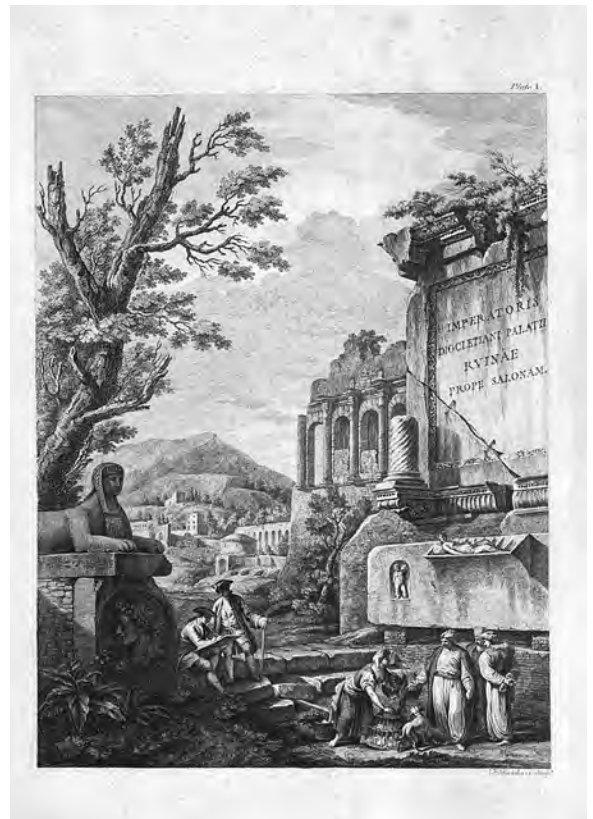
↑ Francesco Bartolozzi, Frontispis, 33.4 x 43.2 cm, iz: Robert Adam, Ruins of the Palace of the Emperor Diocletian in Spalatro in Dalmatia , London 1764.

No, neospornu kvalitetu ove “knjige o knjizi”, u njezinu pomno projektiranom tekstualno-grafičkom zagrljaju, čini sveobuhvatna analiza i valorizacija te sistematizacija ključnih aspekata interakcije Roberta Adama i Dioklecijanove palače. Riječ je o ciljanom propitivanju polazišnih okolnosti stvaranja Adamove knjige i širenja njezinog utjecaja na arhitekturu u razdoblju klasicizma. Već u uvodnom dijelu, iscrpnim pregledom dosadašnjih istraživanja, knjiga se nameće