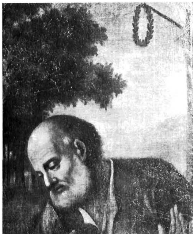
G. M. Zaffoni ( Il Calderari ), Porodenje , detalj. Gradski muzej, Poredone