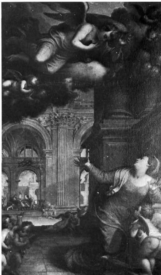
Antonio da Faenza, Navještenje . Galerija »Benko Horvat«, Zagreb

Već me je odavno ovo zagrebačko Navještenje frapiralo čudesnom strukturom prostora. S bogatom arhitekturom posve klasičnog, visokorenesansnog smjera, ovaj slikar-arhitekt gradi prostor s upravo fantastičnom monumentalnošću, tako da bismo bili skloni datirati je mnogo kasnije, ili barem pri kraju njegova umjetničkog djelovanja (spominje se, kako izgleda, do 1533), kad isto takvu bramantesknu arhitekturu (i rimsku) ne bismo već 1514. imali na lijepim »vratima« orgulja u Palazzo Apostolico u Loretu. I ovdje kao i tamo nije Antonijeva arhitektura samo monumentalna nego i »duboka«; naš slikar, naime, na svim svojim oltarnim palama svoje »arhitektonske enterijere« virtuosno produbljuje, na našoj slici gotovo u beskraj, do daleke pozadine. 2