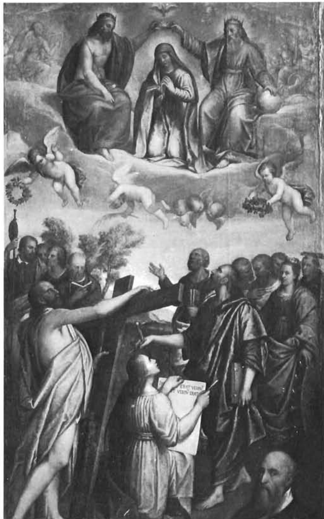
Bernardino Licinio, oltarna pala . Strossmayerova galerija, Zagreb