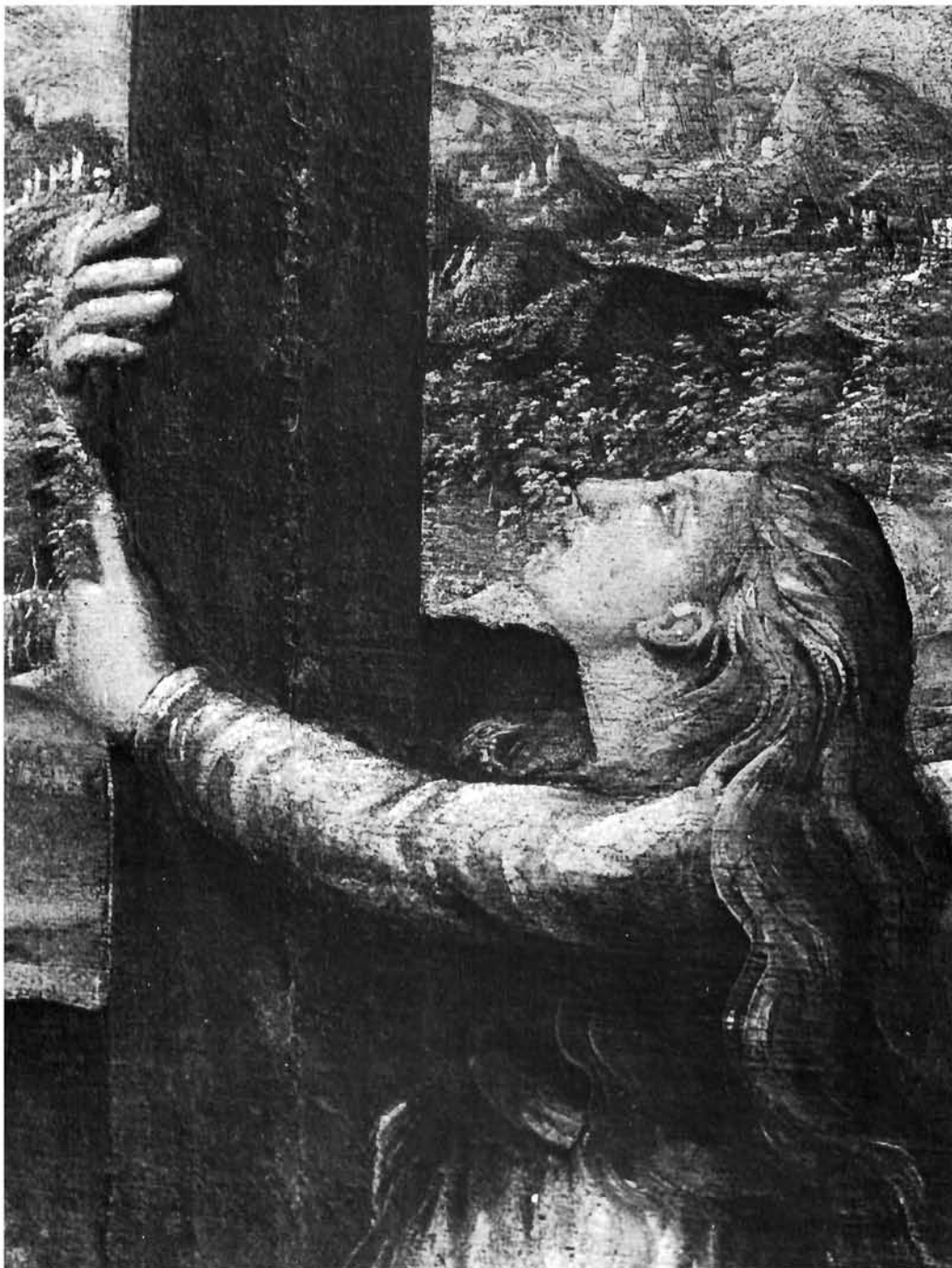
Luka Longhi, Raspeće , detalj. Stalna izložba crkvene umjetnosti, Zadar