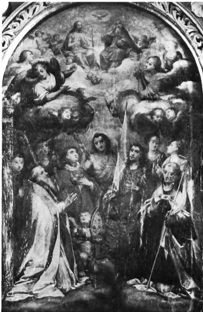
Giulio Licinio, Sveto Trojstvo sa svecima . Crkva M. B. Trsatske, Rijeka

u dobrom stanju, a mogu, na žalost, objaviti samo slabu snimku iz vremena predratne fotografske kampanje prof. Artura Schneidera. U gloriји, iznad oblaka, nalazi se Sv. Trojstvo , ali je glavni prizor u donjem dijelu slike, gdje je, finim i delikatnim Giulijevim načinom, prikazano devet svetačkih likova. Oštećenost pale ne dopušta nam točniju valorizaciju, ali čini se da se ona dobro uklapa u opus Giulija Licinija, kojega je nedavno opsežnije proučila Luisa Vertova. Cio niz morfoloških i stilskih oslonaca može se naći na njegovim radovima ( Parisov sud , u Sabaudi, u Torinu). Slične anđele, one veće, nalazimo u Grazu na slici Mrtvi Krist poduprijet od anđela (Dijecezanski muzej), dok adekvatne glave žena možemo zapaziti na slici Korijolan i rimske matrone , nekad u zbirci Morrison u Basildon Park. Zatim su tu mnoge glavice kerubina (npr. na Bogorodici na prijestolju sa svecima u Sv. Petru Mučeniku u Muranu). 5