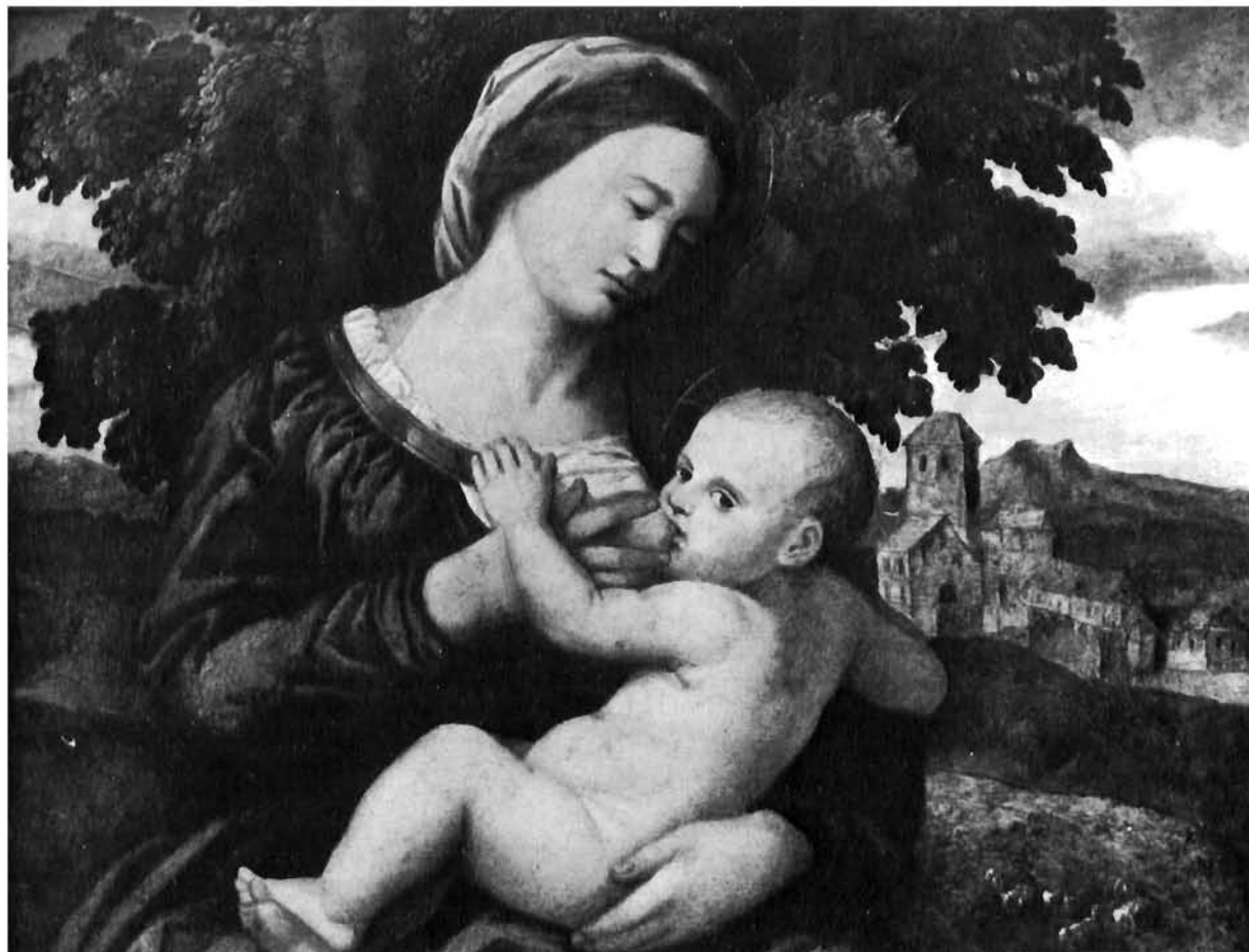
Giulio Licinio, Bogorodica s Isusom . Gradski muzej, Novi Sad

Drugi se naš prijedlog odnosi na mnogo kasniju oltarnu palu u franjevačkoj crkvi na Trsatu (Rijeka). Ona se ne nalazi