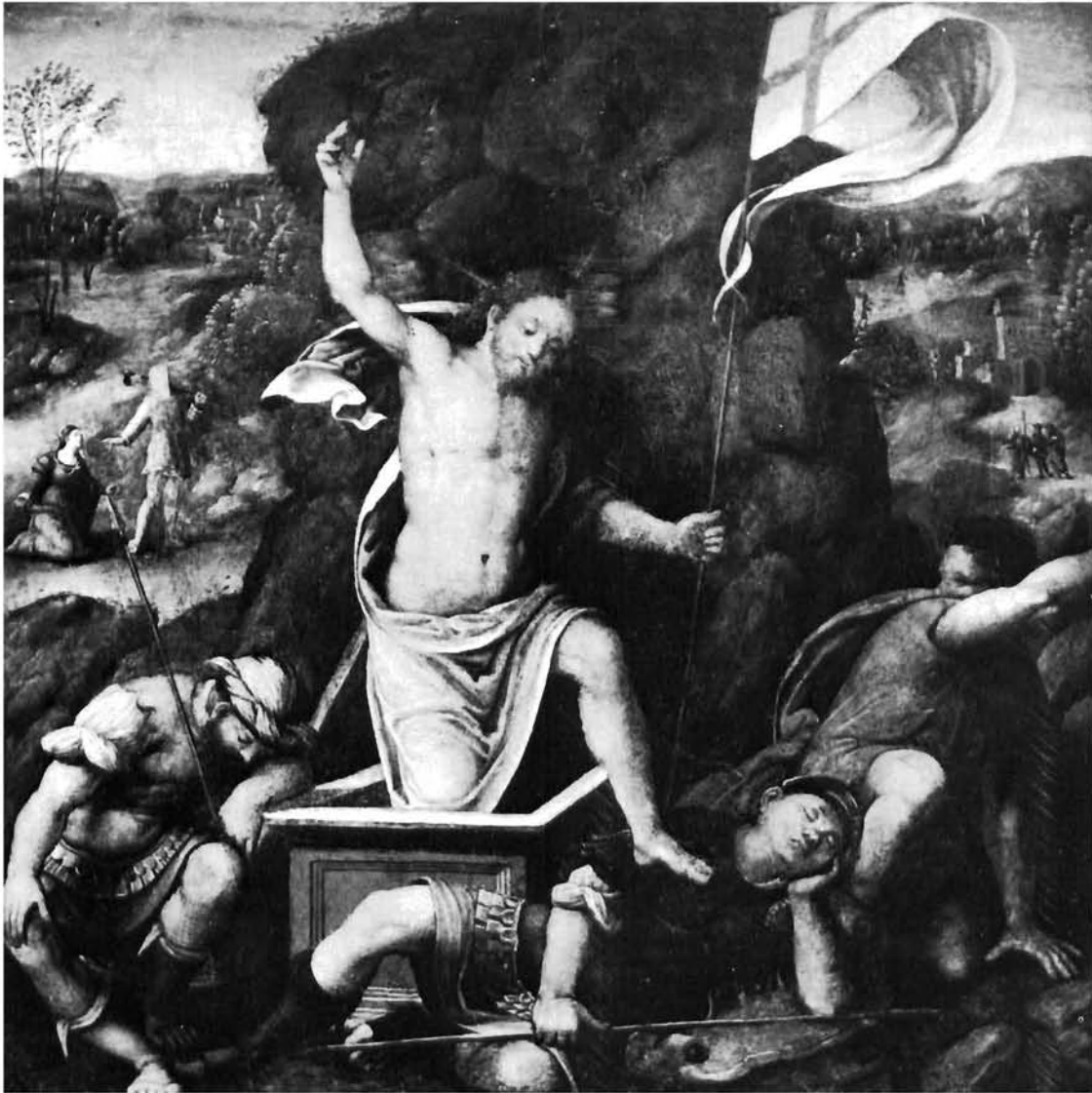
Camillo Filippi (?), Uskrsnuće. Strossmayerova galerija, Zagreb