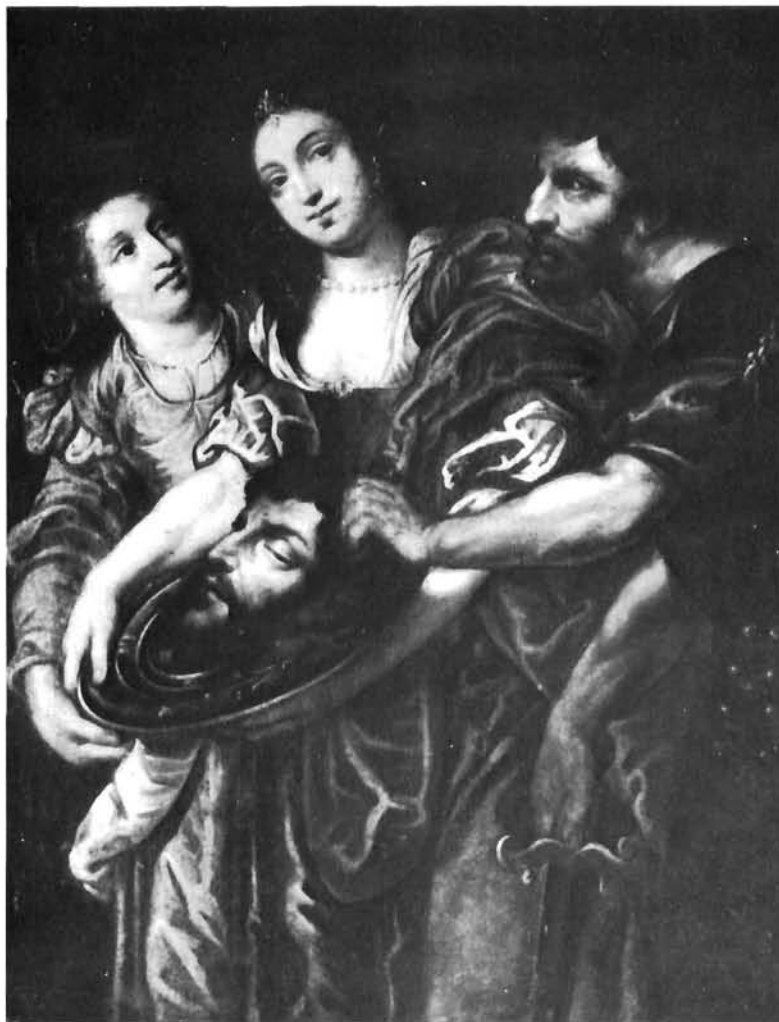
Camillo Ballini, Saloma s glavom sv. Ivana . Priv. zbirka, Beograd