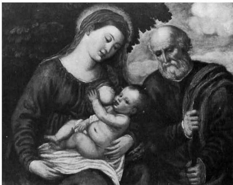
Nepoznati mletački slikar 16. stoljeća, Sveta obitelj . Privatno vlasništvo, Graz