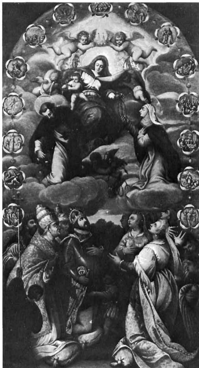
Baldassare d'Anna, Gospa od Ruzarija . Osor, župna crkva