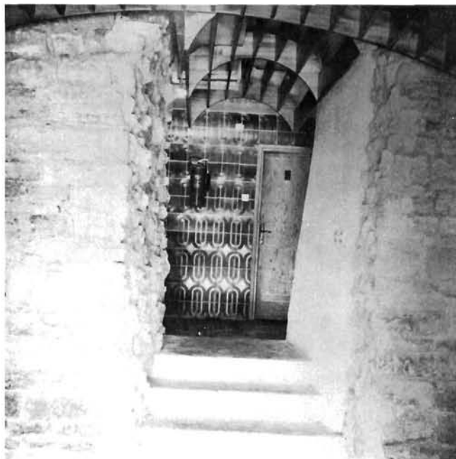
Detalj caffè-bara s prolazom probijenim u antičkom zidu temeljne partije amfiteatra; svibanj 1985.