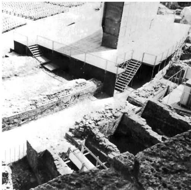
Pogled na kazete, nakon uklanjanja kamene ispune, u zapadnom dijelu amfiteatra, stanje nakon prekinutih radova krajem srpnja 1985.