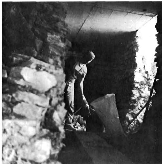
Probijanje prolaza i vratnih otvora pneumatskim čekićima u antičkom zidu temeljnih dijelova amfiteatra; postavljena je već nova armiranobetonska ploča u razini nekadašnjeg prvog cirkularnog hodnika amfiteatra; svibanj 1985.

tonskom konstrukcijom, koja pokriva prostorije kazeta i nosi pločnik hodnika. Time se čini trostruk prekršaj oštećivanjem autentičnog stanja spomenika: u građevinu se unosi konstrukcija koje nema, nije je bilo, i nije bila poznata njezinim graditeljima; uklanja se konstrukcija koja je autentična i koja je oštećena tek u svom gornjem sloju (pločnik) koji je lako korektno popraviti materijalom i tehnikom starih graditelja; napokon, nova konstrukcija, armiranobetonska, posve je recentna prema starosti amfiteatra. Naše iskustvo s njom ne traje niti stoljeće, a njezin vijek limitiramo na dvije stotine do dvije stotine i pedeset godina. Unošenje takve konstrukcije u konstruktivni sklop, koji već traje dva milenija, ugrožava njegov vijek trajanja niskim limitom trajanja nove konstrukcije: kao da ga miniramo tempiranim upaljačem. Nove su konstrukcije i lučno svodjenje ulaznog hodnika, za što nedostaje dovoljno ostataka, a analogije su posve općenite.