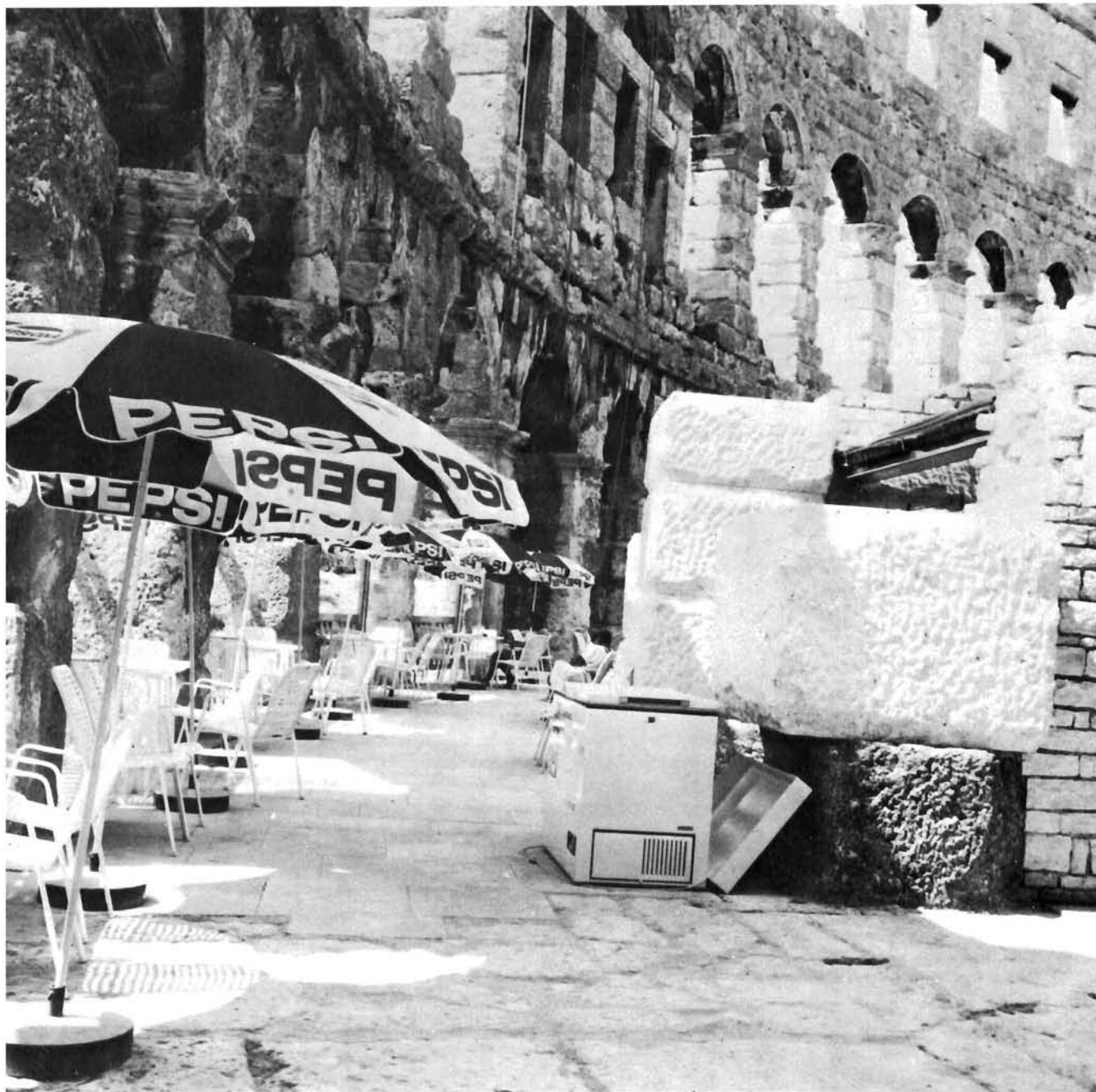
Detalj nove terase s nadogradnjama; srpanj 1985.

vezi s temeljenjem zidova plašta, konstruktivnom ulogom ostalih zidova i drugim. Do ove točke programa radova nema, očigledno, ničeg spornog.