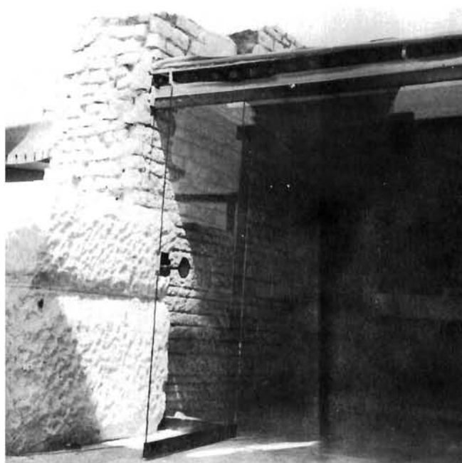
Šank caffè-terase s nadograđenim zidovima »pretpostavljenog originalnog stanja«; srpanj 1985.

va uloži namijenjenoj mu u ponudi. Pred nama je žrtvovanje spomenika kulture ekonomističkom prakticismu.