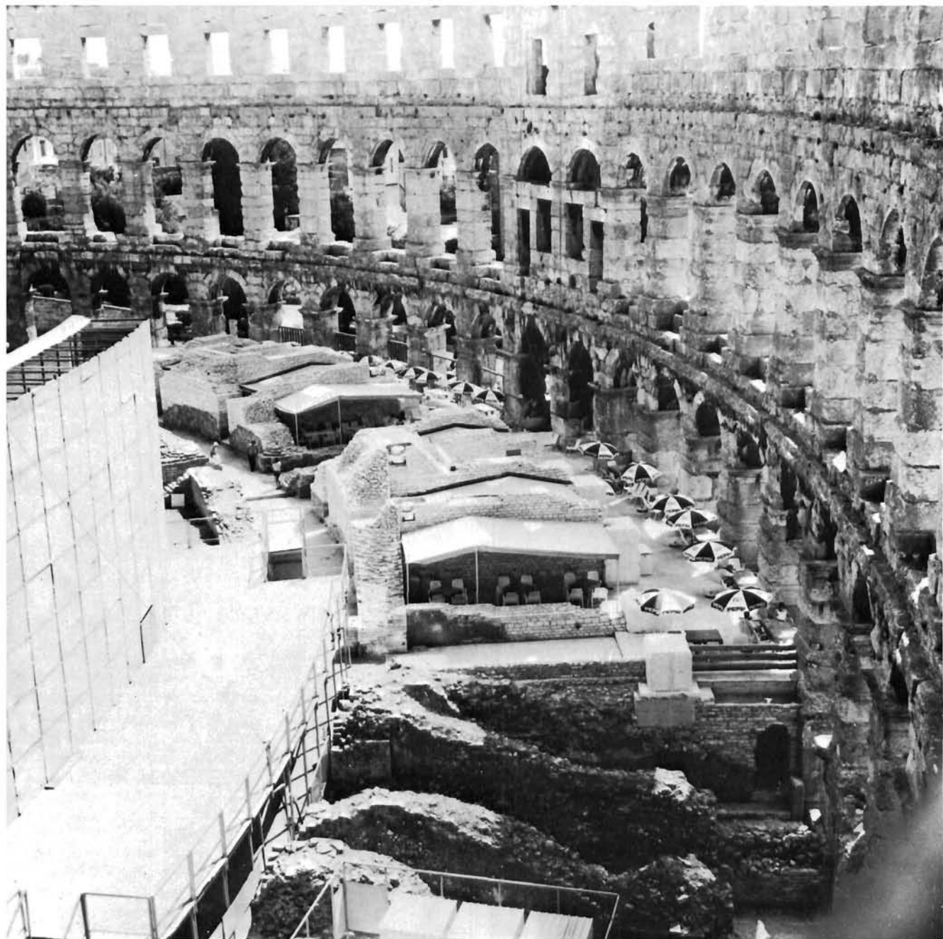
Pogled na unutrašnji dio amfiteatra s novom terasom, nakon završenih radova krajem srpnja 1985.