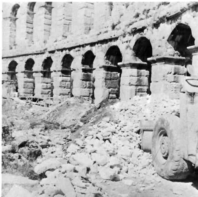
Uklonjena kamena ispunja kazeta i kamena masa srušenih dijelova antičkih zidova ukrcavala se utovarivačima u kamione kiperu u kontinuiranom lancu; svibanj 1985.