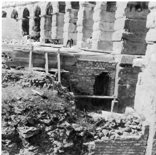
Radovi na adaptaciji temeljnih dijelova amfiteatra: u prvom planu pregradni zid, prislomjen na temeljni zid vanjskog plašta amfiteatra, djelomično prekriven kamenom ispunom i nanosom; u drugom planu proboj pregradnog zida i armiranobetonska ploča nad njim; u trećem nadgrađeni novi zid objekta caffè-terase; svibanj 1985.

namjene, bez ikakve veze s originalnom namjenom tog dijela građevine, ali i s određenim pokušajem repetiranja nekadašnjih zbivanja u nestalim prostorijama među substrukcijama, kojih također više nema, a koje su flankirali cirkularni hodnici.