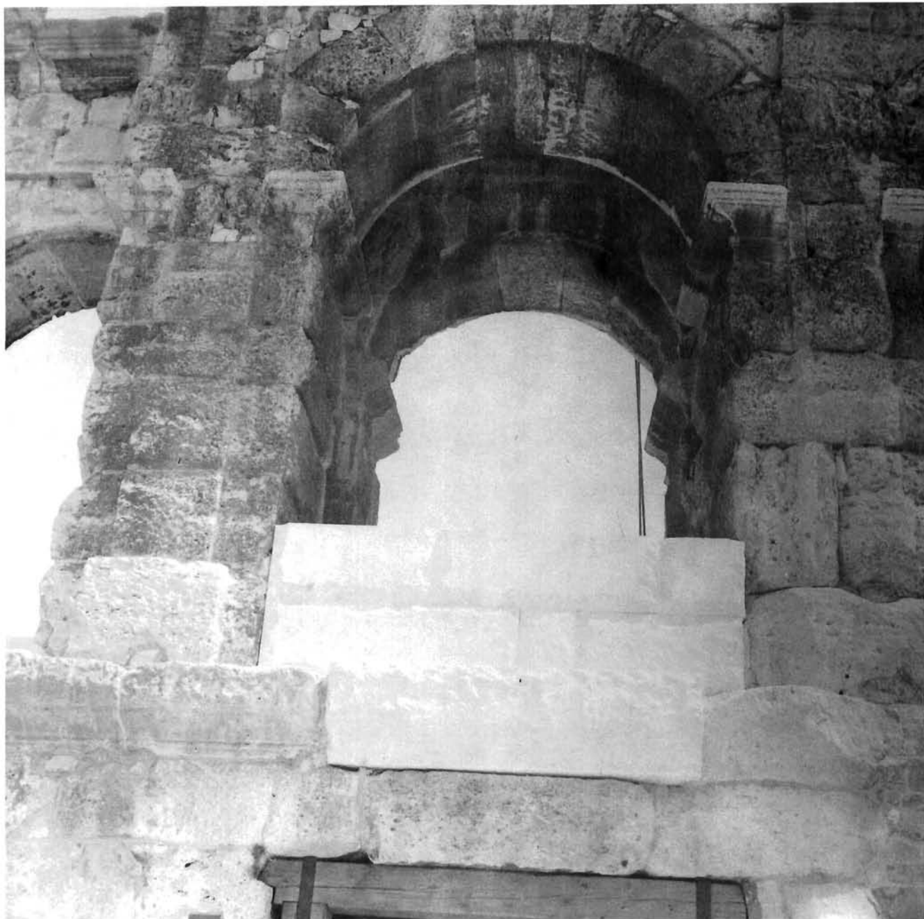
Intervencija u parapetnoj zoni (odnosno ograda caffè-terase) na razini prvog cirkularnog hodnika amfiteatra; srpanj 1985.