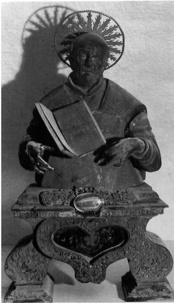
Zagreb, crkva sv. Katarine: poprsje-relikvijar sv. Ignacija Loyole, rad Johanna Lucasa Sigela iz 1734–1735 Zagreb, church of St Catherine: Bust-reliquiary of St Ignatius Loyola (Johann Lucas Sigel, 1734–1735)