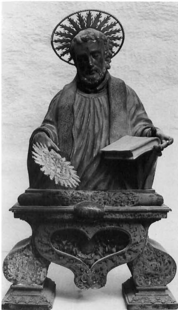
Zagreb, crkva sv. Katarine: poprsje-relikvijar sv. Franje Ksaverskoga, rad Johanna Lucasa Sigela iz 1734–1735, prije restauriranja

Zagreb, church of St Catherine: Bust-reliquary of St Francis Xavier (Johann Lucas Sigel, 1734–1735, before restoration)