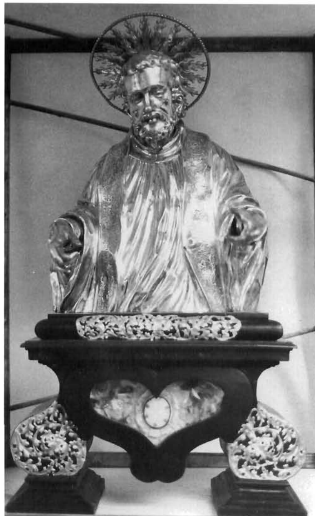
Zagreb, crkva sv. Katarine: poprsje-relikvijar sv. Franje Ksaverskoga, rad Johanna Lucasa Sigela iz 1734–1735, nakon restauriranja

Zagreb, church of St Catherine: Bust-reliquary of St Francis Xavier (Johann Lucas Sigel, 1734–1735, before restoration)