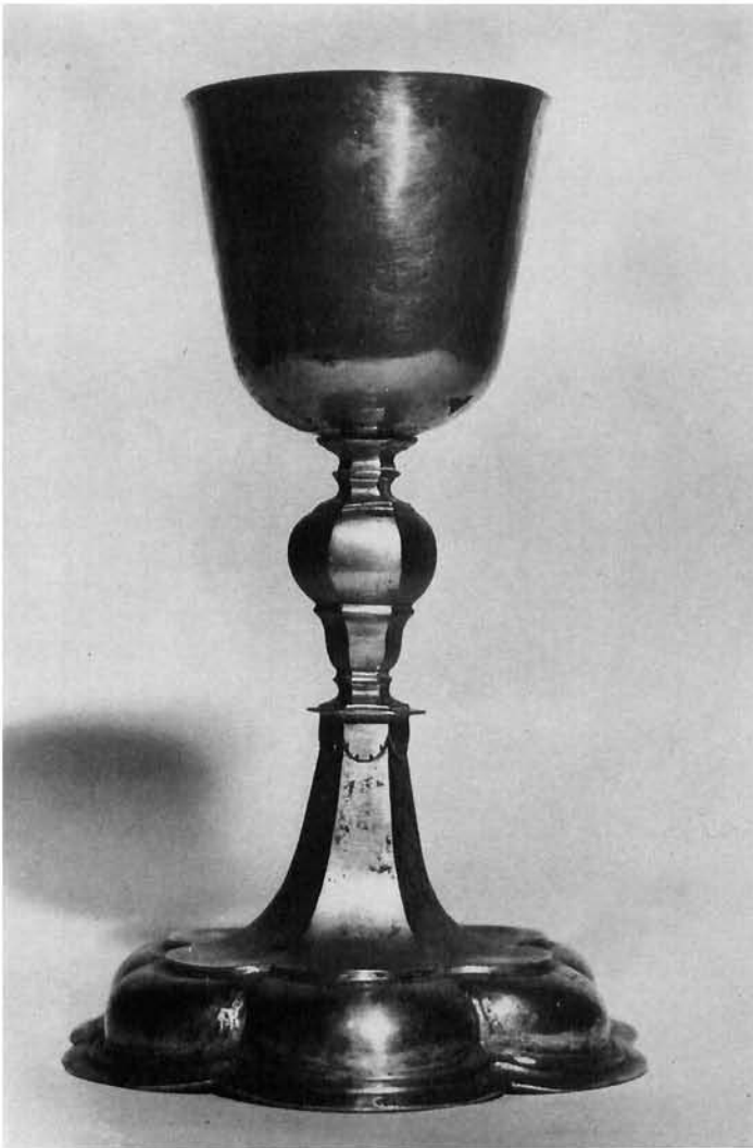
Ludbreg, župna crkva Svetog Trojstva: kalež, rad Johanna I. Mayra, druga polovica 17. stoljeća Ludbreg, parish church of the Trinity: Chalice (Johannes I. Mayr, second half of 17th c)

Srebro, djelomično pozlačeno, iskucano, gravirano, lijevano. Visina: 23,3 cm, Ø podnožja: 15 cm.