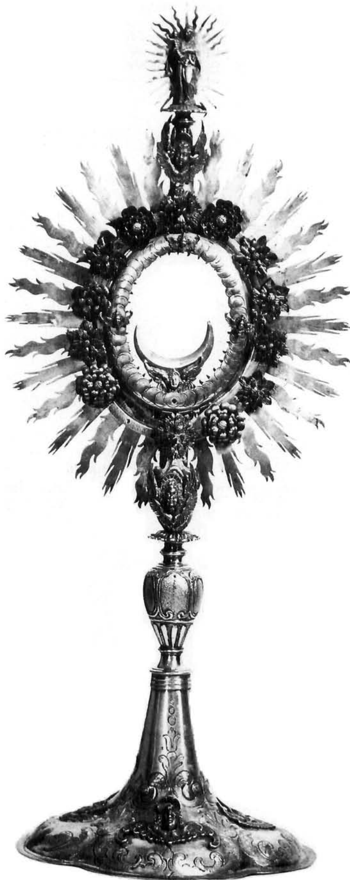
Krapina, franjevački samostan: monstranca, rad Hansa Christiana II. Fesenmaiera, sredina 17. stoljeća Krapina, Franciscan monastery: Monstrance (Hans Christian II. Fesenmaier, mid-17th c)