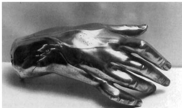
Zagreb, crkva sv. Katarine: poprsje-relikvijar sv. Franje Ksaverskoga, rad Johanna Lucasa Sigela iz 1734–1735; detalj: svečeva ruka nakon restauriranja

Prikazani radovi augsburških majstora predstavljaju dio sačuvanih djela majstora iz Augsburga u sakralnim objektima Hrvatske, kojih se istraživanje nastavlja.