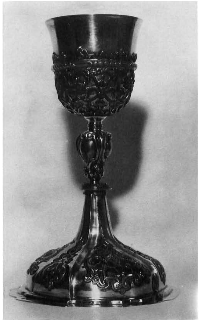
Virje, župna crkva sv. Martina: kalež, rad Johanna Georga Anzwang(er)a, prva polovica 18. stoljeća Virje, parish church of the St Martin: Chalice (Johann Georg Anzwanger, first half of 18th c)

Barokno oblikovano postolje od drva ukrašeno je splotom