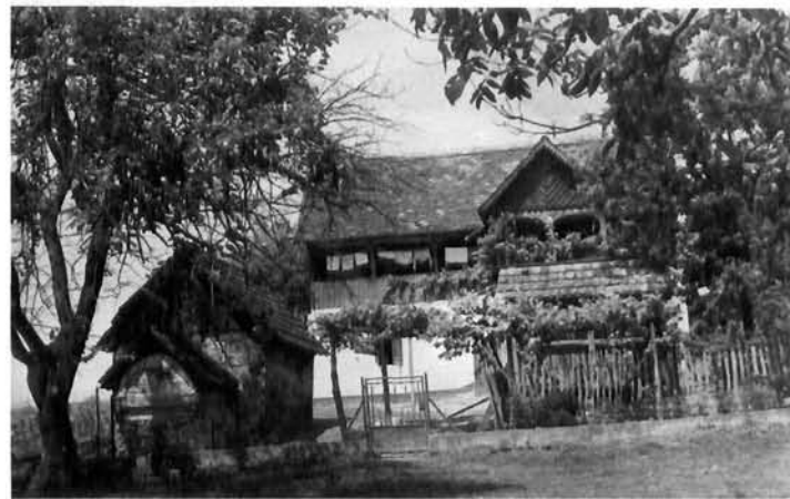
Bukevje 117, čardak i kuharna s krušnom peći Bukevje 117, »čardak« and summer kitchen with bread oven

na zabatnom pročelju uz stiliziran lik vatrogasca s kacigom stoji 1958. i inicijali A. S.