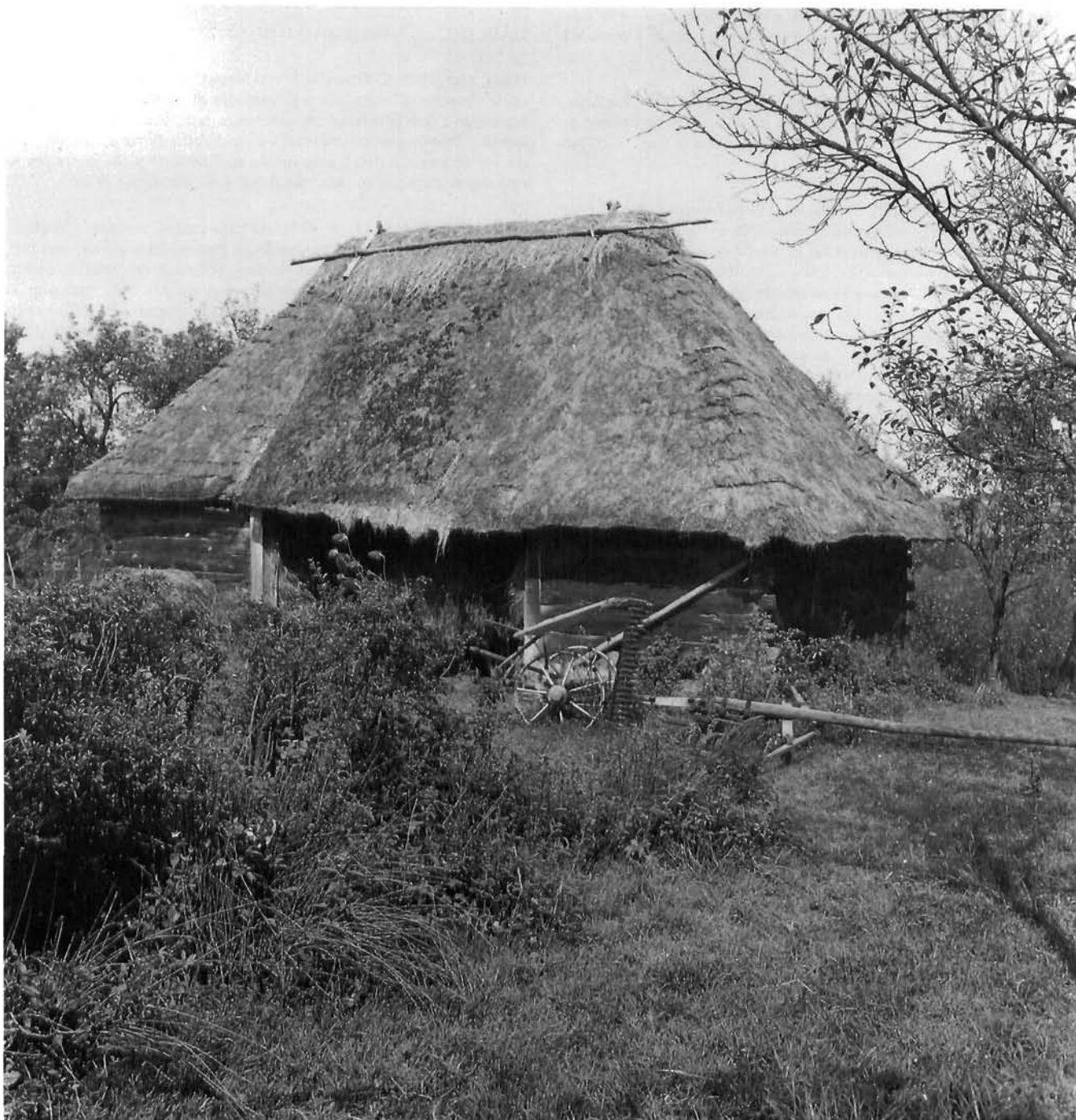
Cvetković Brdo 12, štagalj Cvetković Brdo 12, a barn