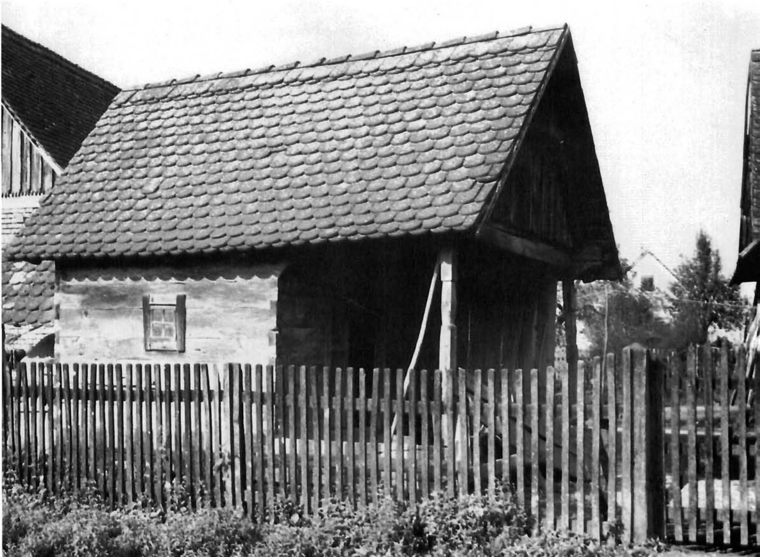
Veleševac 25, kuharna Veleševac 25, summer kitchen

Analizirajući iznesene podatke možemo zaključiti da su na području Turopolja tijekom prve polovice 19. stoljeća postojala živahna kretanja različitih skupina majstora, tesara, cimermana , palira , koji su zajedno s poduzetnikom, kao što je bio Puceković u M. Mlaki, ili tzv. vodom partije , kao što je bio Juraj Vitez iz Kobilića s drugovima Čužićem i Trupčevićem, grupno i organizirano gradili kuće u drvetu (prilog: karta kretanja tesara). Majstori su putovali iz sela u selo, već prema potrebama. Da li im je to bilo i jedino zanimanje, trebalo bi tek ustanoviti budućim istraživanjima. Iz usmenih kazivanja saznajemo da su Okujci, tesari iz Okuje, gradili u Starom Čiču i Maloj Kosnici, iako je i u Starom Čiču bilo domaćih majstora, kao što su to bili Đuka i Juro Lopec, a oni su opet gradili u Mičevcu. Majstori Špičke, Jozo-Joško Novoselec i Podlijan iz Črnkovca gradili su u Maloj Kosnici i Rakarju. Markaši iz Hrušćice gradili su u Ščitarjevu i Obrezini, dok je Jakob Graničar iz Obrezine gradio u Maloj Kosnici, a Gustav Belec iz Obeda u Kobiliću kao i Josip Vraneša, tesar iz Bukevja. Još 1971. u Kobiliću je bio tesar Đuro Kirinić. U Buševcu su kuće