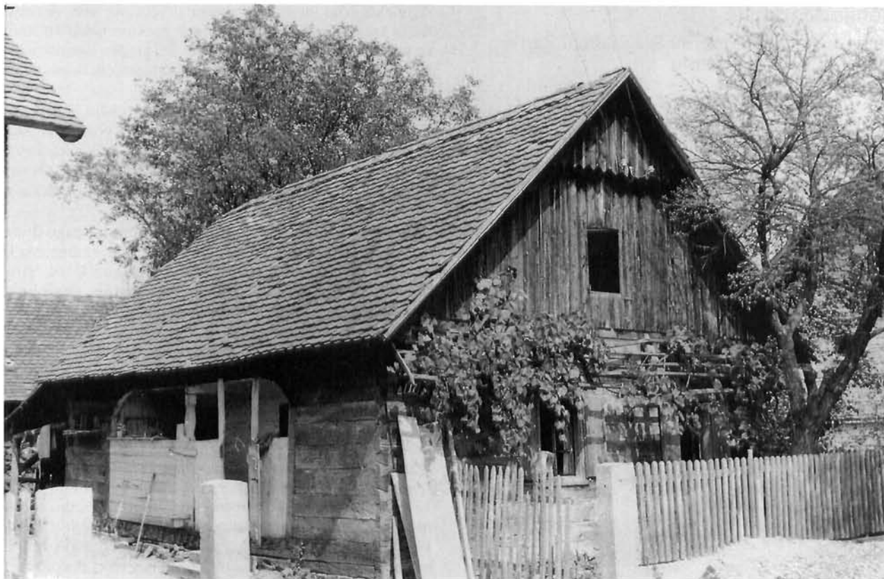
Rakaraje 17, hiža House, Rakarje no. 17

vrijednosti. Datacija tradicijske arhitekture jest dvostruka. S jedne strane možemo kroz povijest pratiti određen građevinski element ili način gradnje do onog povijesnog trenutka do kojeg imamo pisanih podataka. S druge strane konstatiramo da je određeni spomenik izgrađen one godine kojom je i obilježen. Tako se npr. tročlana tlocrtna dispozicija, uz neke druge konstruktivne elemente, otvoreno ognjište s boltom, 11 ponavlja od srednjeg vijeka do 20. stoljeća, dok postoji velika vjerojatnost da je vez na tzv. hrvaški vugel još i stariji. U čardacima i hižama datacija je upisana, tj. urezana na podvlaci, sljemenu , u najvećoj prostoriji, a katkada iznad ulaznog prostora, najčešće na uličnom, zabatnom pročelju. Uz dataciju i imena vlasnika, urezani zapisi koje nalazimo kao znak IHS 12 ili kao cjelovita imena i prezimena, svjedoče da su tradicijsku arhitekturu turopoljskog područja gradili domaći majstori. Ova imena majstora pratimo do kraja 19. stoljeća.