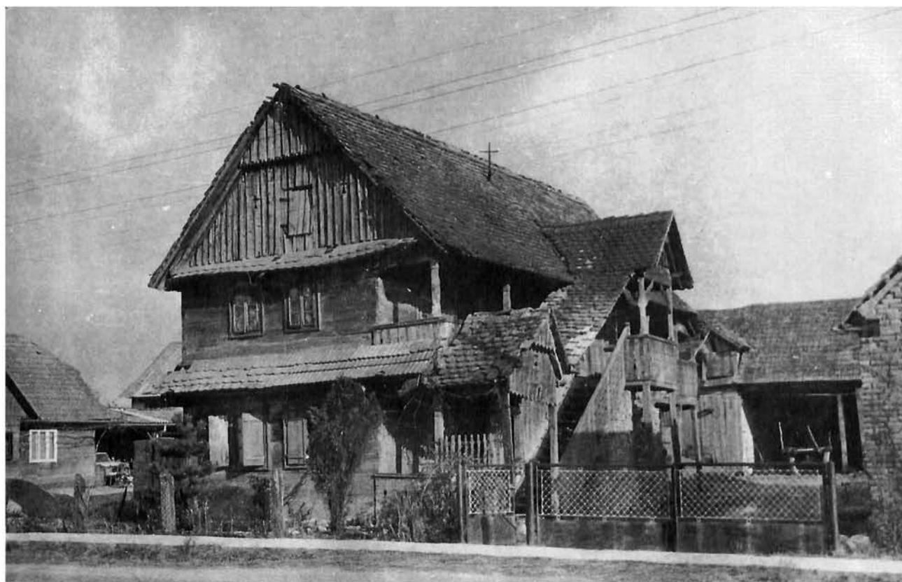
Buševac 95, čardak Buševac 95, »čardak«

Kuće, Horvatićeva ul. 103, na gredi u tzv. ganjčeku urezano je: Janković Marko, 1896. g. (vjerojatno vlasnik). Čardak je građen na lastin rep , vel. cca 14 × 6,5 m.