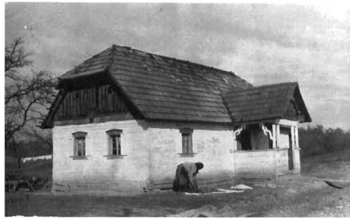
Hotnja 35, hiža Hotnja 35, a house