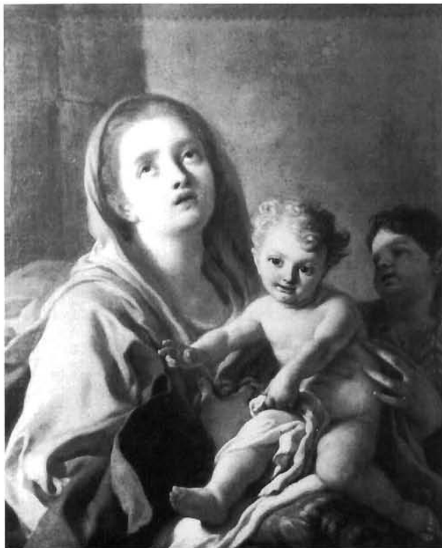
Giuseppe Nogari, Bogorodica s djetetom i Sv. Ivanom, Petričevac, franjevački samostan Giuseppe Nogari, Virgin with Child and St. John, Petričevac, Franciscan monastery