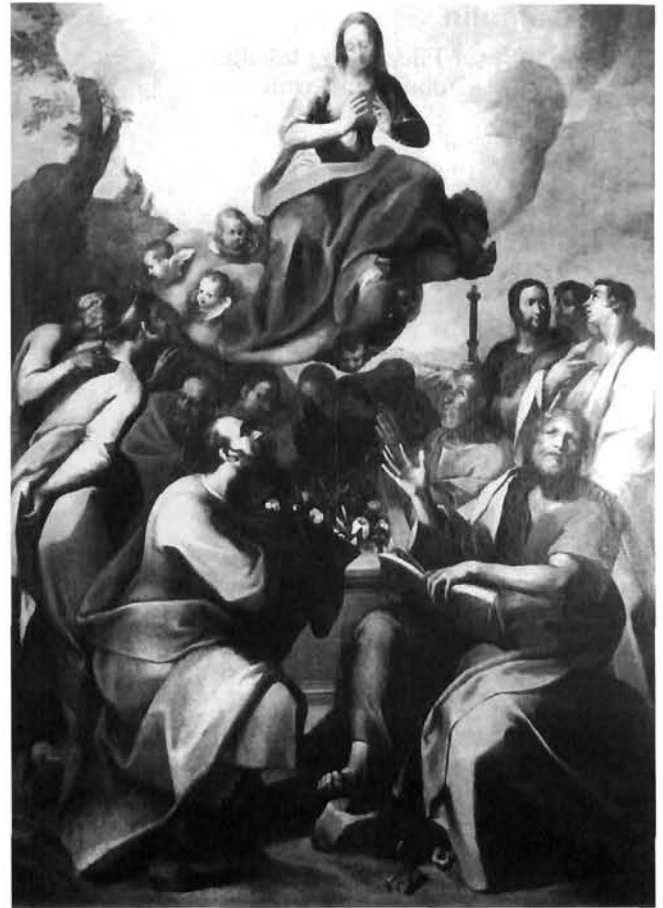
Claudio Ridolfi, Uznosenje Bogorodice, Slano, franjevački samostan Claudio Ridolfi, Ascension of Mary , Slano, Franciscan monastery

kih koji su ostali na »razini« prijedloga. Niti talijanska znanstvena kritika nije još uvijek sposobna mnoge probleme riješiti, pogotovo ove iz umjetničkih opusa koji još nisu monografski obrađeni.