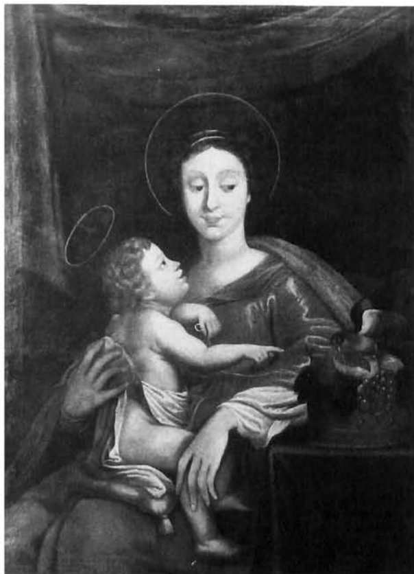
Andrea Voltolino (?), Bogorodica s djetetom, Visoko, franjevački samostan

Andrea Voltolino (?), Virgin with Child , Visoko, Franciscan monastery