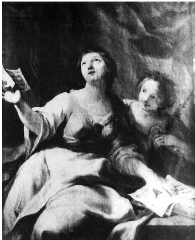
Giuseppe Nogari, Alegorija glazbe, Kassel Giuseppe Nogari, Allegory of music, Kassel