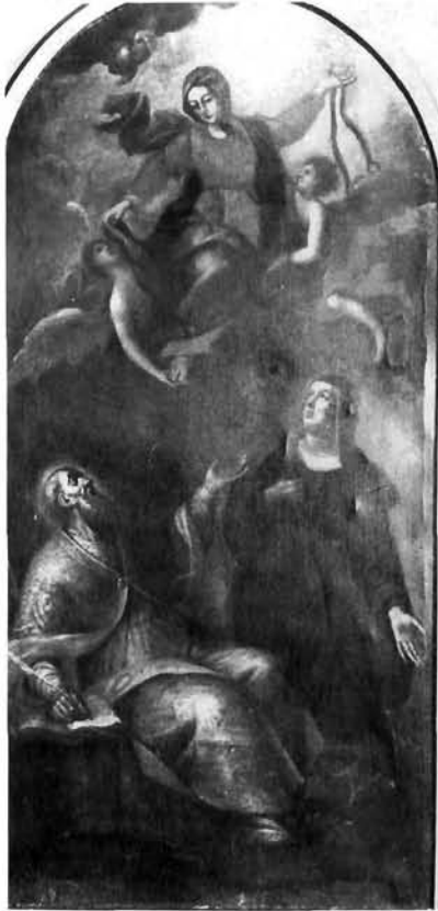
Santo Prunato (?), Bogorodica sa svecima, Kreševo, franjevački samostan Santo Prunato (?), Virgin with Saints, Kreševo, Franciscan monastery