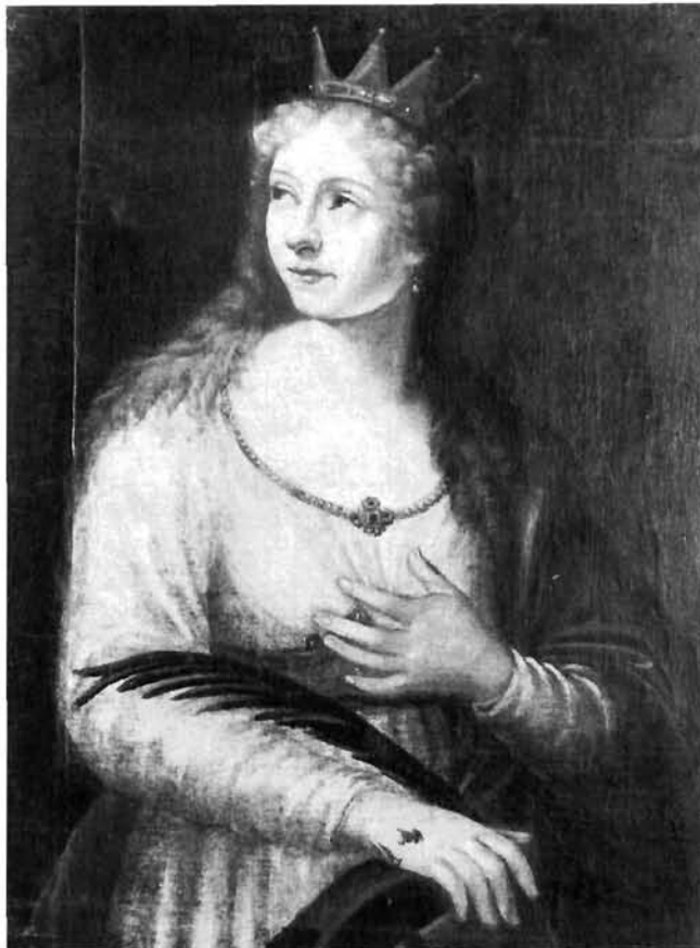
Gerolamo da Ponte, Sv. Katarina, franjevački samostan Kraljeva Sutjeska Gerolamo da Ponte, St. Catherine, Franciscan monastery Kraljeva Sutjeska

(U povodu izložbe »Franjevci na raskršću kultura i civilizacija«, Zagreb, 1988–1989)