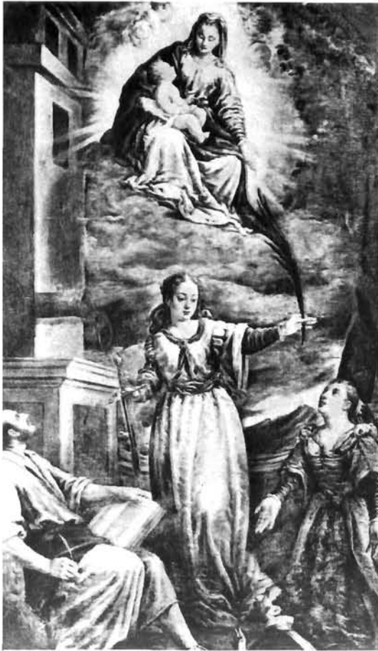
Gerolamo da Ponte, Bogorodica i svetece, Bassano, S. Giovanni Battista Gerolamo da Ponte, Virgin and women saints , Bassano, S. Giovanni Battista