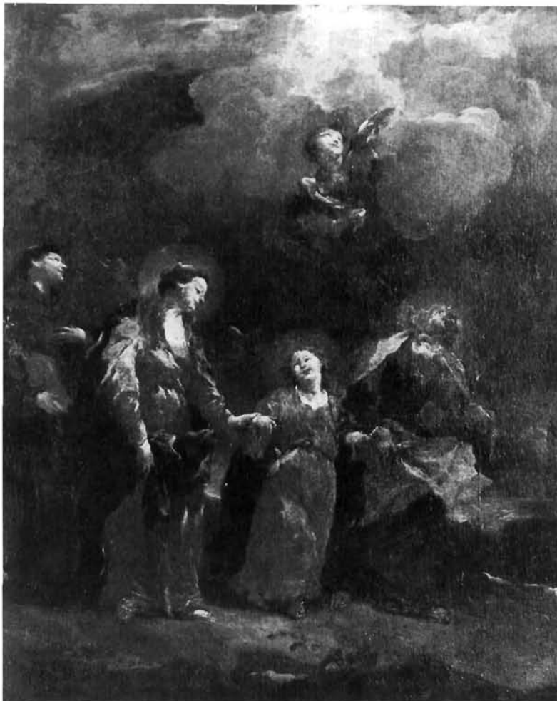
Gian Antonio Guardi, Sv. Ana i Joakim s malom Bogorodicom i Sv. Antunom, Visoko, franjevački samostan Gian Antonio Guardi, St. Anne and Joachim with a little Virgin and St. Anthony, Visoko, Franciscan monastery