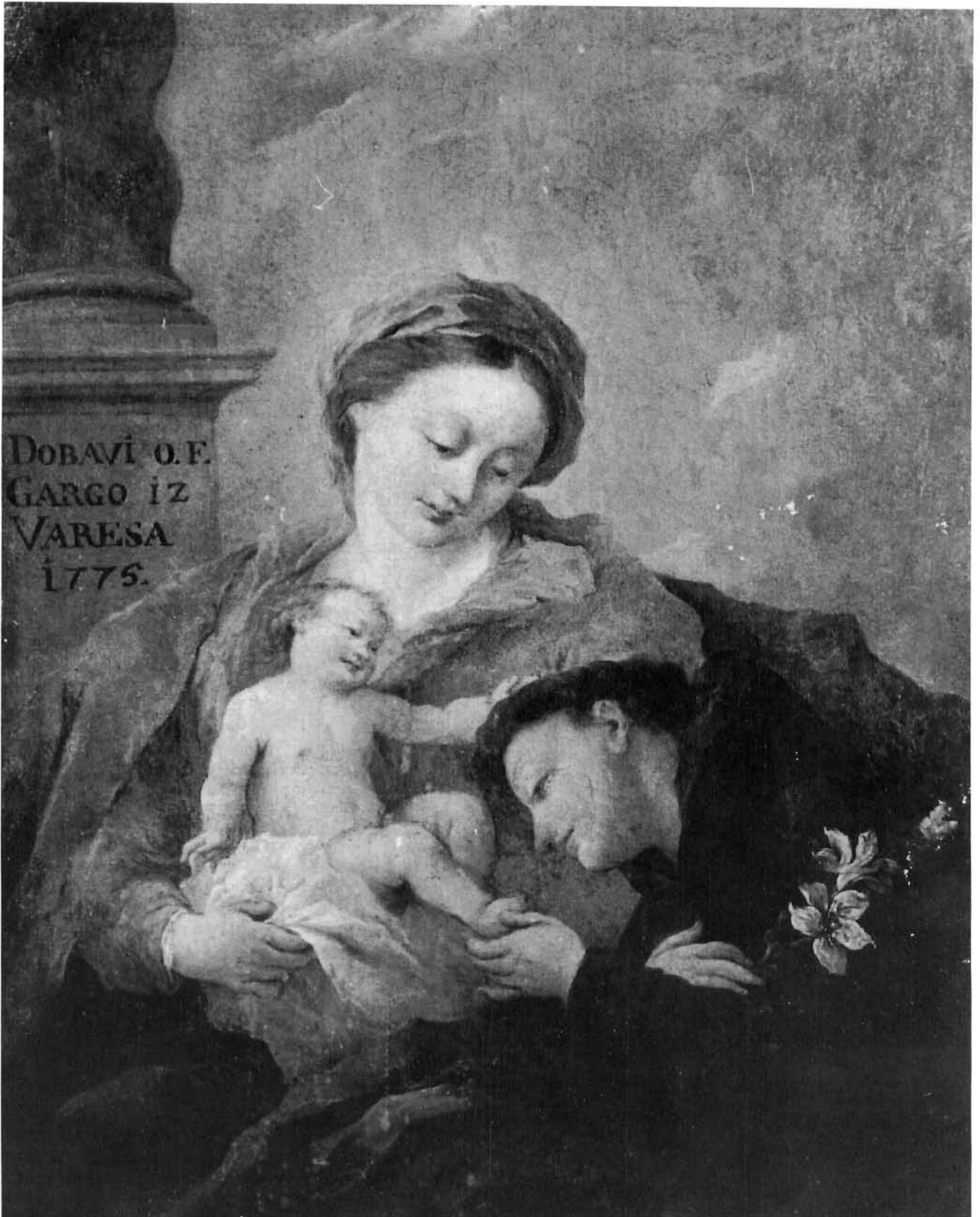
Francesco Guardi, Bogorodica s djetetom i Sv. Antunom, 1775, franjevački samostan Kraljeva Sutjeska Francesco Guardi, Virgin with Child and St. Anthony, 1775, Franciscan monastery Kraljeva Sutjeska