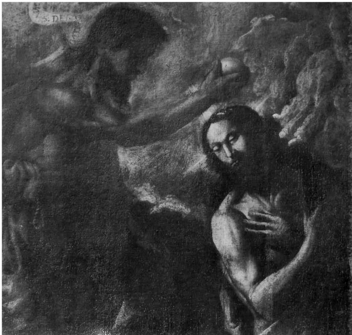
Andrea Voltolino, Krštenje Krista (detalj), franjevački samostan Kraljeva Sutjeska Andrea Voltolino, Baptism of Christ (detail), Franciscan monastery Kraljeva Sutjeska