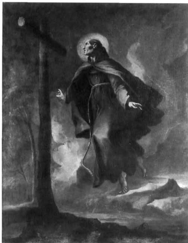
Andrea Voltolino, Levitacija sv. Franje, Hvar, Zbirka franjevačkog samostana

Andrea Voltolino (?), Virgin with Child , Visoko, Franciscan monastery