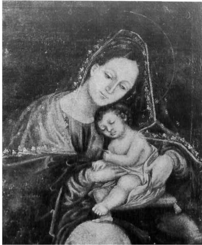
Parmska škola, Bogorodica s djetetom, Mostar, franjevački samostan Parmin school, Virgin with Child, Mostar, Franciscan monastery