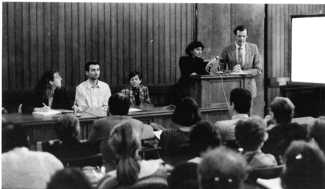
Križevci, »Arhitektonsko nasljeđe u izvangradskom prostoru«, 21 – 23. 5. 1990. Sa zasjedanja u zgradi Skupštine općine