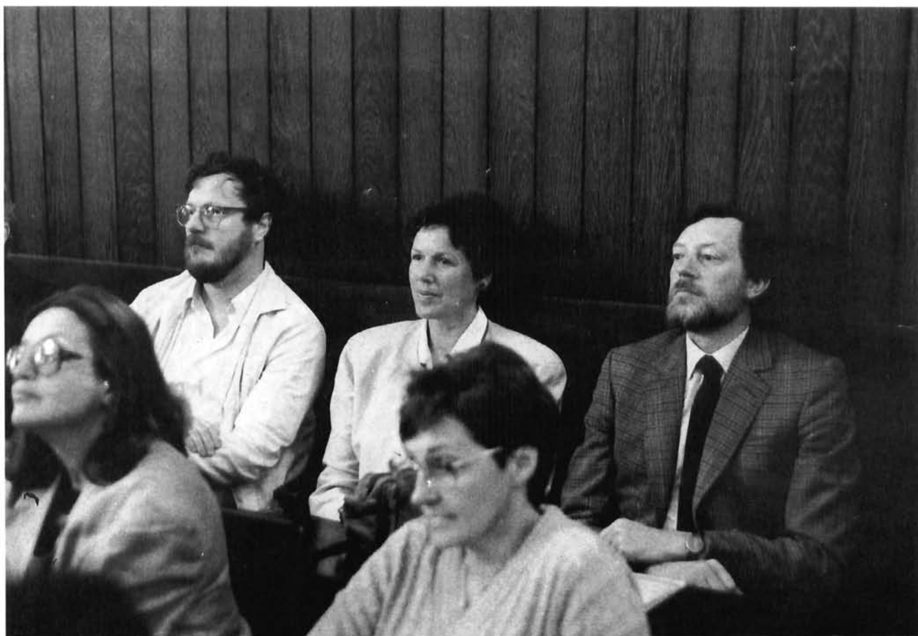
Križevci, »Architectural Heritage in the Countryside«, 21 – 23 of May 1990. The meeting in the town hall