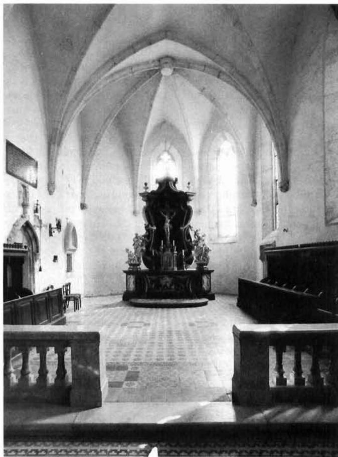
Križevci, oltar Francesca Robbe u gotičkom svetištu crkve sv. Križa Križevci, the altar of Francesco Robba in the gothic shrine of the Church of the Holy Cross