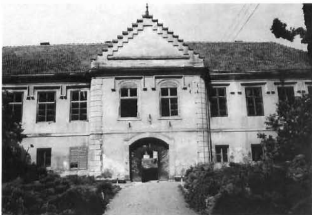
Gornja Rijeka, dvorac Rubido-Erdödy Gornja Rijeka, the manor-house Rubido-Erdödy