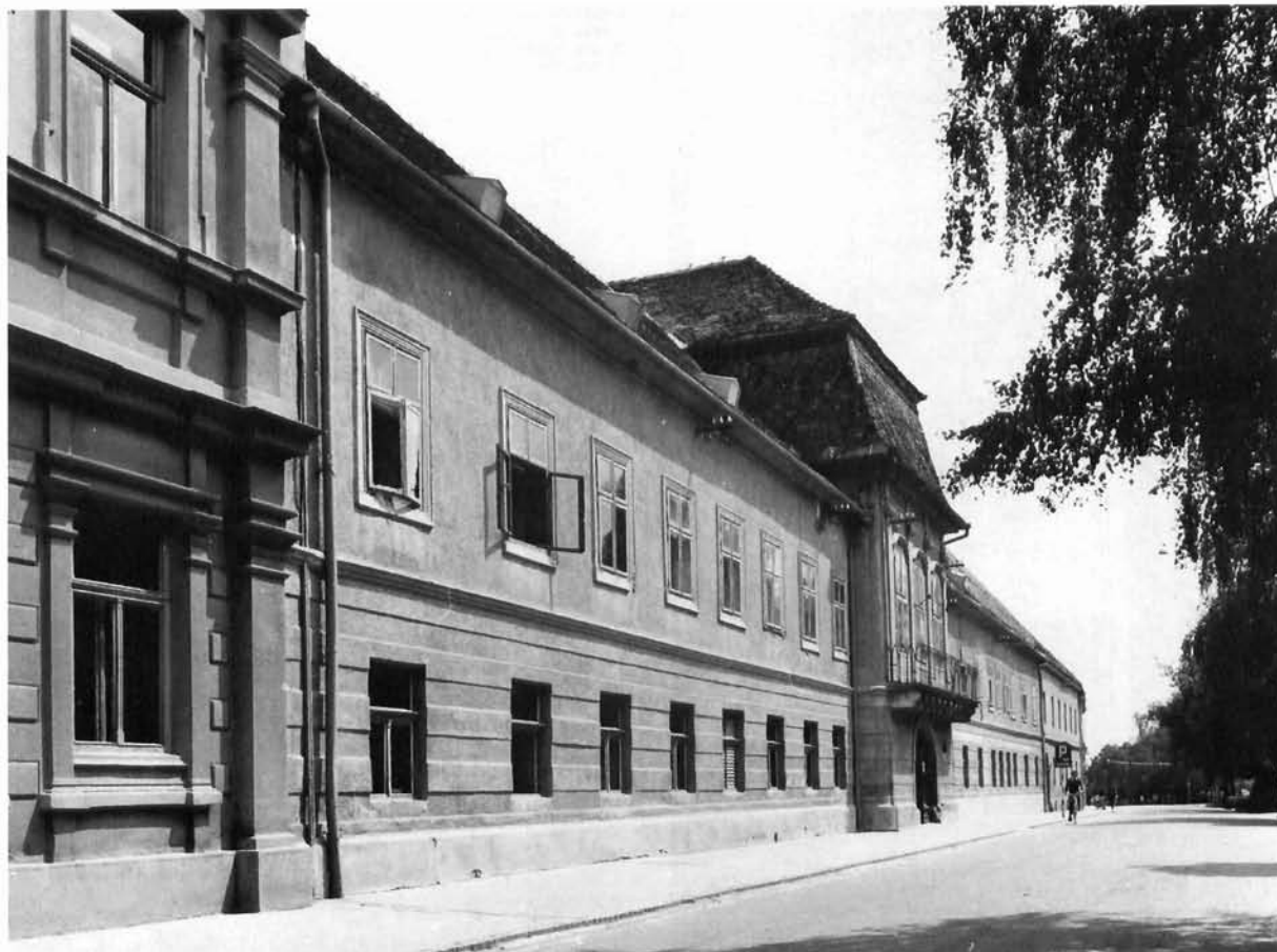
Zgrada Skupštine općine Križevci, nekadašnja županijska zgrada The Town Hall of Križevci, the former district building

cije u povijesnoj jezgri pokazuju mnogo više osjetljivosti za ambijentalne vrijednosti i stilski karakter građevine (M. Pijade 4 i 6). Težnja prema skromnijem mjerilu dolazi do izražaja i u gradnji stambenih naselja na zapadnoj strani Gornjega grada, gdje je duhovitim variranjem tipova kuća i tretmanom zelenila bez ograda, ostvarena u prostorno-oblikovnom i arhitektonskom pogledu visoka razina obiteljskog stanovanja na periferiji.