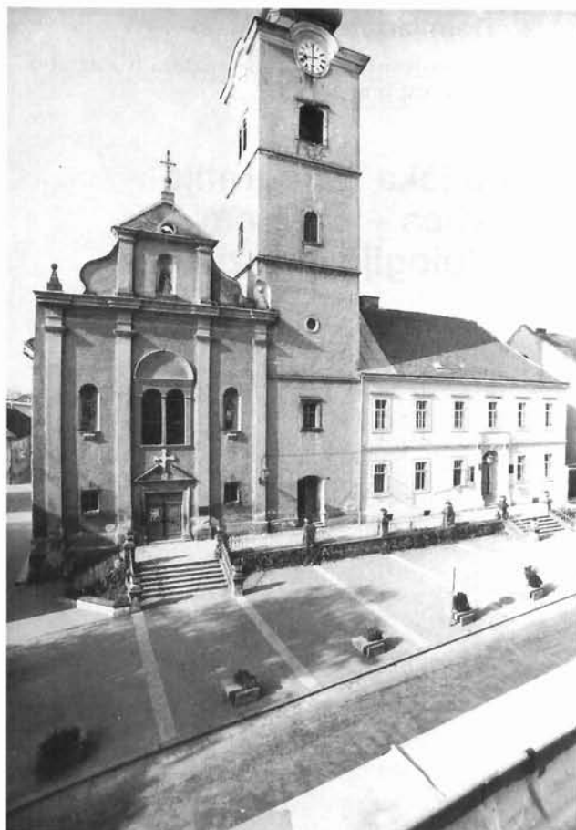
Križevci, nekadašnji samostan pavlina i crkva sv. Ane Križevci, the former monastery of the order of St. Paul and the Church of St. Anne