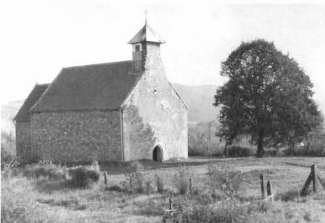
Kamešnica, kapela sv. Andrije Kamešnica, the chapel of St. Andrew