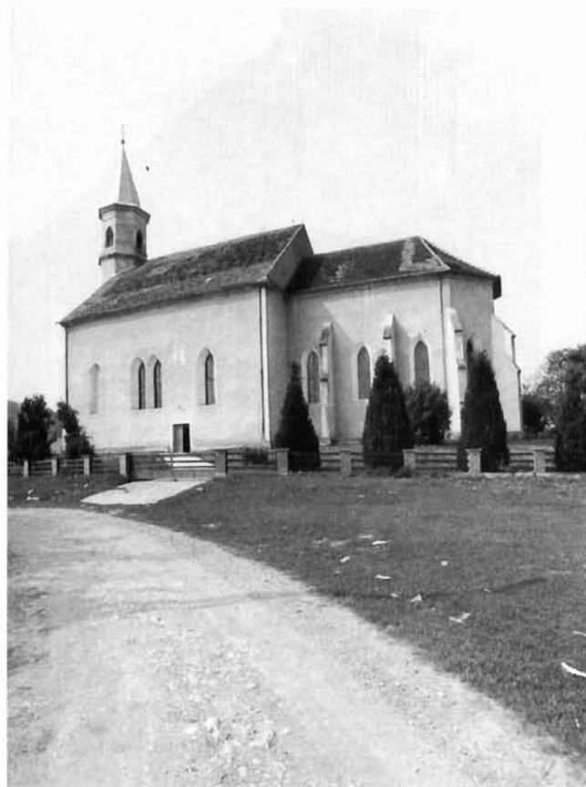
Glogovnica, župna crkva Uznesenja Marijina Glogovnica, the parish church of the Ascension of Mary

jem je godinama živjela slavna ilirska pjevačica Sidonija Rubido-Erdödy, i dvorac velikog župana Nikole Zdenčaja u Velikom Ravenu, a oba su bila nekada okružena, kao i većina nestalih dvoraca (Gušćerovac, Kiepatch, Bogačevo), parkovima s egzotičnim biljem, drvoredima, umjetnim jezerima i ribnjacima o čemu svjedoče stare katastarske karte. Tipu skromnih dvoraca pripadaju i brojne župne kurije (dvorovi), građene većinom u XVIII/XIX. stoljeću kao što su one u Gornjoj Rijeci, Zabnom, Orehovcu i Miholcu. Ovaj letimični pregled spomeničkog fonda križevačkog područja bio bi nepotpun kada se ne bi spomenulo i nekoliko primjera pučke arhitekture, koja je zahvaljujući određenog izoliranosti križevačke regije ostala ovdje sačuvana u većem broju nego u drugim područjima sjeverne Hrvatske. Osim značajnog sloja drvenih objekata različite namjene i skromnih zidanica s naivnom interpretacijom klasičnih stilskih oblika (klasicizam, historicizam, secesija), poseban su kuriozitet seoska groblja kao spontani izraz naivnog duha i ukusa i skupine drvenih kleti najrazličitijih oblika i konstrukcija rasute po vinorodnim brežuljcima kalničkog prigorja, među kojima se izdvajaju one u Gornjoj Glogovnici i skupina obreških kleti. Većina tih građevina u trošnome je stanju i u opasnosti da propadne ili da njihov izvorni oblik bude narušen neodgovarajućom intervencijom (dogradnje u opeci, zamjena slamnatih krovova).