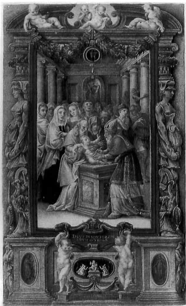
Julije Klović, Obrezanje, fol. 34, Horae Beatae Mariae Virginis , Pierpont Morgan Library, New York