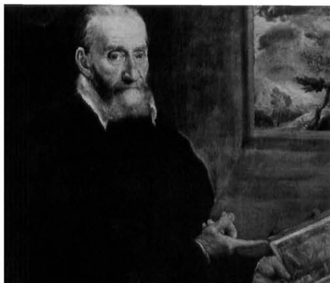
El Greco, Portret Julija Klovića sa časoslovom Horae Beatae Mariae Virginis u ruci, Napoli, Capodimonte

Čest Klovićev ukrasni motiv su antičke vaze. Spomenimo među inim tiskanom knjigama iz onog doba koje su mogle biti dostupne Croati grafičke mape s prikazima antičkih vaza Venecijanaca Agostina dei Musi iz 1530/31. godine, Leonarda da Udine iz 1542–1544. godine ( »ex Romanis antiquitatibus« ) i Enea Vica iz 1543. godine ( »Romae ab antiquo repertum« ). Njihove predloške, nastale prema crtežima Giulia Romana ili Francesca Salviatija, kao i kopije tih vaza s motivima maske-