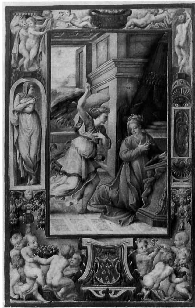
Julije Klović, Navještenje, fol. 4v, Horae Beatae Mariae Virginis , Pierpont Morgan Library, New York