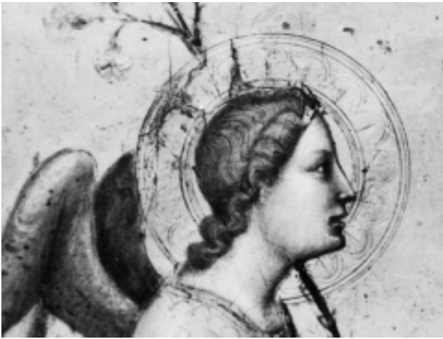
2. Bliski sljedbenik Bernarda Daddija, arkandeo s Navještenja , detalj, Louvre, Pariz

2 Close follower of Bernardo Daddi, archangel from The Annunciation, detail, The Louvre, Paris