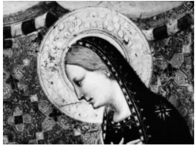
3. Bliski sljedbenik Bernarda Daddija, Bogorodica s Navještenja , detalj, Louvre, Pariz

2 Close follower of Bernardo Daddi, archangel from The Annunciation, detail, The Louvre, Paris