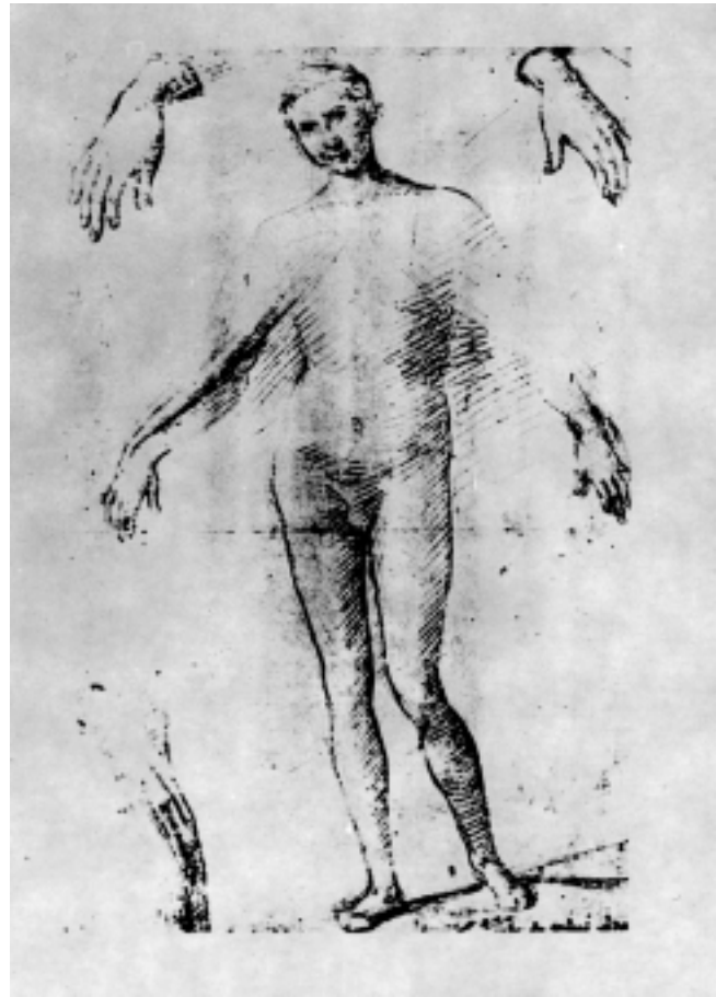
7. Giovanni lo Spagna, crtež – studija za Bogorodicu zaštitnicu , Graphische Sammlung Albertina, Beč

6 Giovanni lo Spagna, copy of The Madonna of Mercy, church of San Carlo in Todi