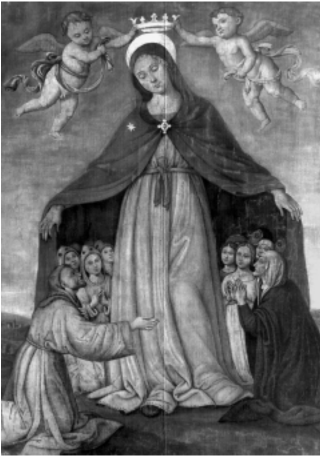
4. Giovanni lo Spagna, Bogorodica zaštitnica , Strossmayerova galerija, Zagreb

4 Giovanni lo Spagna, Madonna of Mercy, Strossmayer Gallery, Zagreb