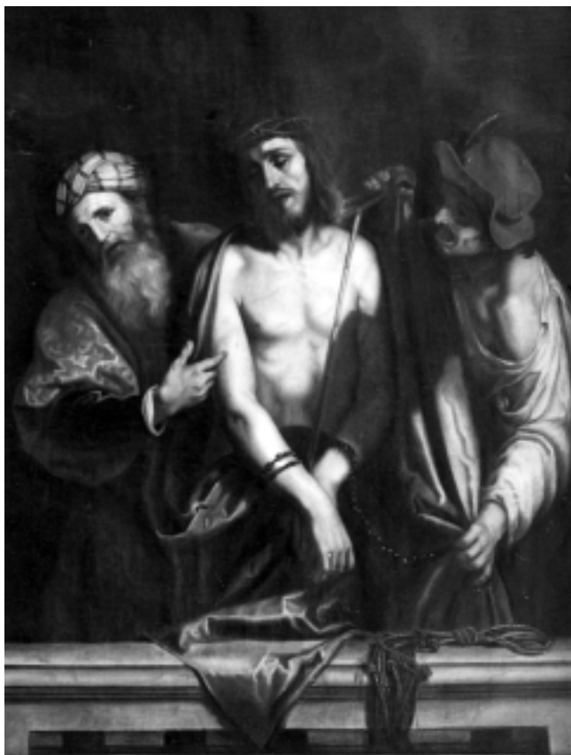
8. Lodovico Cardi zvan il Cigoli, kopija prema Ecce Homo , Strossmayerova galerija, Zagreb

8 Lodovico Cardi called il Cigoli, copy of Ecce Homo, Strossmayer Gallery, Zagreb