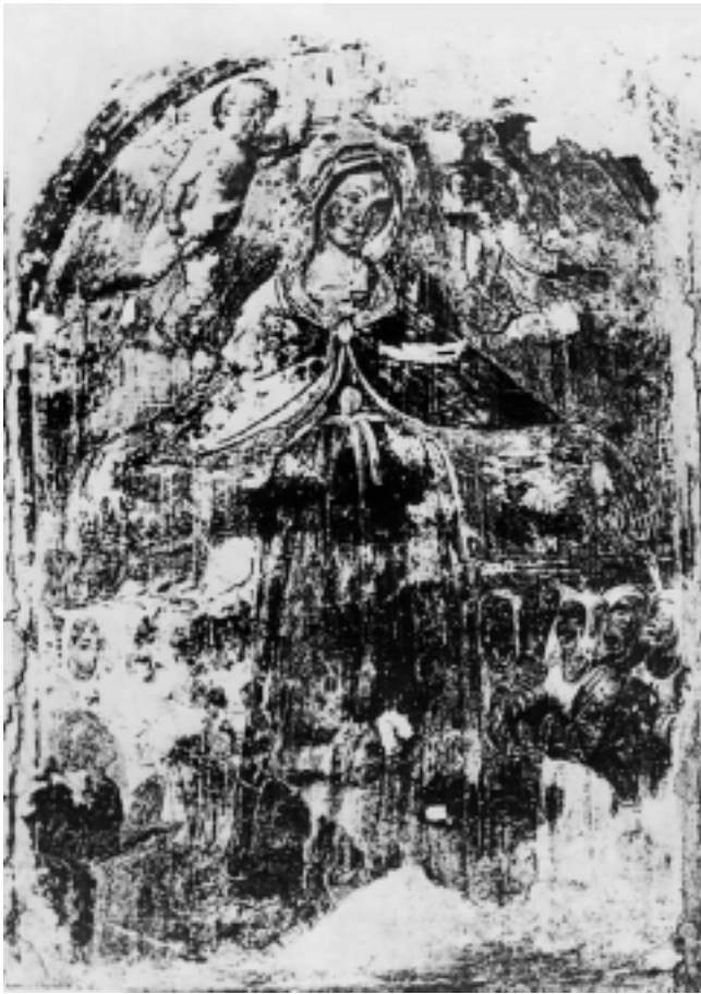
6. Giovanni lo Spagna, kopija prema Bogorodici zaštitnici , crkva S. Carlo, Todi

6 Giovanni lo Spagna, copy of The Madonna of Mercy, church of San Carlo in Todi