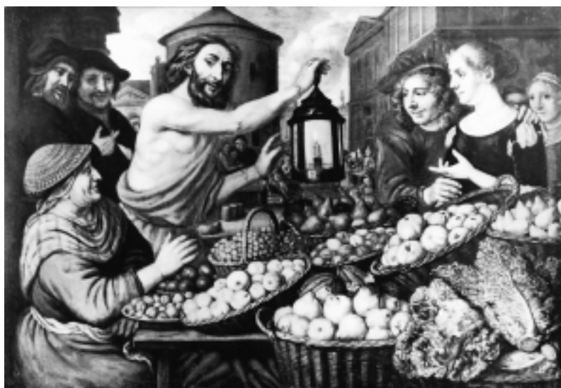
3. Jan Victors, »Diogenes Hominem quero«, sinještaj nepoznat

3 Jan Victors, »Diogenes Hominem quero«, present location unknown