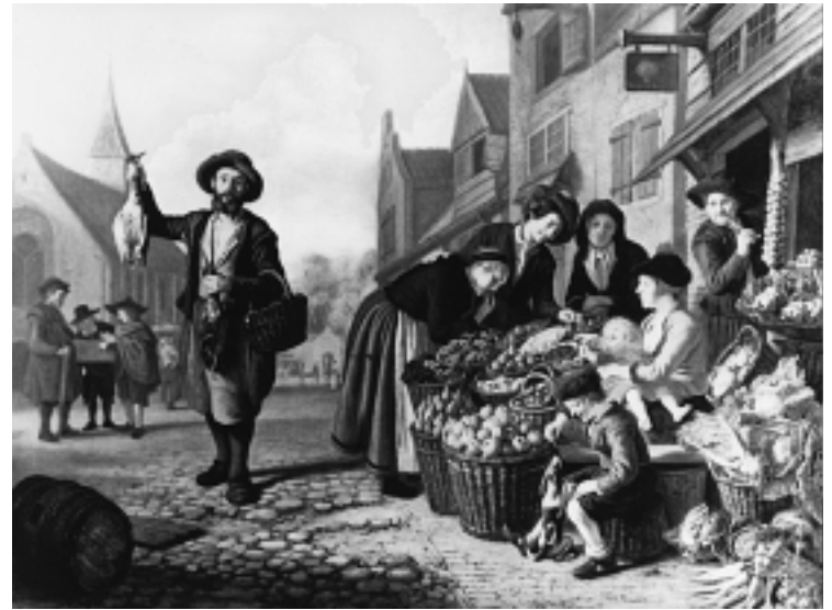
6. Jan Victors, »Muzikant na tržnici«, nekad Beč, Galerija St. Lucas 6 Jan Victors, »Street Musician at the Market«, formerly in Vienna, St Lucas Gallery