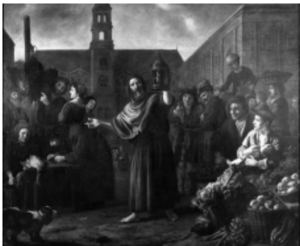
1. Jan Victors »Diogenes Hominem quero«, Muzej za umjetnost i obrt, Zagreb

1 Jan Victors, »Diogenes Hominem quero«, Museum of Arts and Crafts, Zagreb