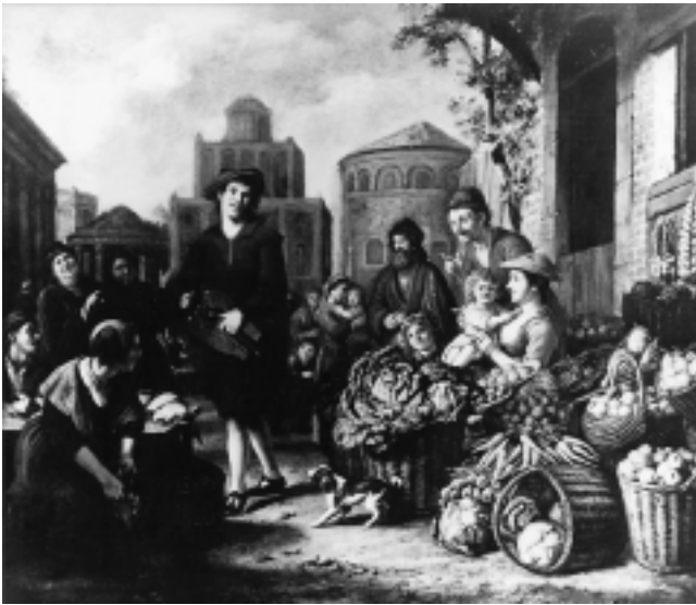
5. Jan Victors, »Prodavaonica povrća i prodavač peradi«, Haag, Rijksdienst Beeldende Kunst (B 629), na posudbi u Strasburškome muzeju 5 Jan Victors, »Vegetable Shop and Poultry Vendor«, The Hague, Rijksdienst Beeldende Kunst (B 629), loaned to the Strasbourg Museum