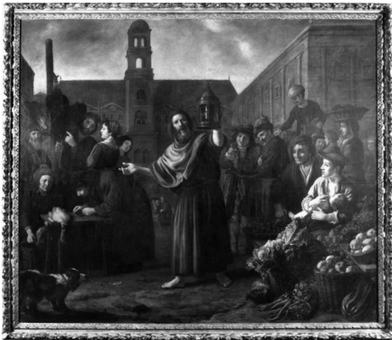
1. Jan Victors »Diogenes Hominem quero«, Muzej za umjetnost i obrt, Zagreb 1 Jan Victors, »Diogenes Hominem quero«, Museum of Arts and Crafts, Zagreb