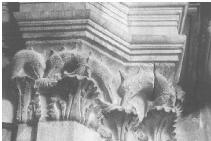
Šibenska katedrala, južna apsida, polukapitel s likovima dupina Šibenik Cathedral, south apse, dolphin half-capital

no u variranju frizura i pokrivala za glavu, čemu je kipar posvetio iznimnu pozornost, te u svojevrsnoj unifikaciji ženskih likova karakteristično šiljatih brada. Očita razlika nije toliko u likovnoj i tehničkoj kvaliteti izrade (koja kod glava na konzolama katkad i nadmašuje onu na glavama apsida), koliko u bitno različitom ikonografskom pristupu: glave na apsidama su galerija psiholoških portreta (bez obzira da li prikazuju povijesne ličnosti ili ne), a niz konzola je zapravo izveden iz grotesknosti gargouillesa . Kao jedan od specifičnih elemenata koji upućuju na Jurja kao autora ističe se groteskni smiješak glave na apsidi kod koje se vide zubi, što je zapravo ublažena varijanta onog koji nalazimo na nekoliko sličnih glava na konzolama, čak s vrlo slično izvedenim zubima. 68 No ono najvažnije što povezuje glave na apsidama s konzolama sjeverne fasade jest izrazita čvrstoća i snaga volumena, 69 te vrlo uvjerljiva psihološka profilacija, pri čemu je kod konzola naglasak na grotesknosti, a kod glava na apsidama više je izražena fina psihološka izražajnost, makar je i kod nekih od njih prilično zamjetljiv element groteske. Smatram stoga da se najveći dio konzola može smatrati Jurjevim djelom, a da su tek neke od njih, prvenstveno životinjske glave, djelo njegovih pomoćnika. 70