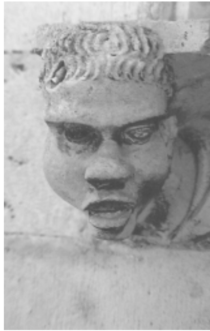
Šibenska katedrala, sjeverna fasada, konzola u obliku ljudske glave Šibenik Cathedral, north façade, console shaped as human head