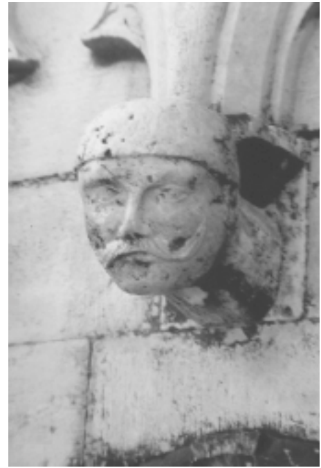
Šibenska katedrala, sjeverna fasada, konzola u obliku ljudske glave Šibenik Cathedral, north façade, console shaped as human head

je iznad završnog korniza zid povišen za sedamdesetak centimetara i dobio još jedan korniz. Uostalom i to da se praktički neposredno iznad svodova bočnih traveja postavlja novi svod, kojim završava elevacija bočnih brodova, jasno pokazuje promjenu graditeljskog koncepta.