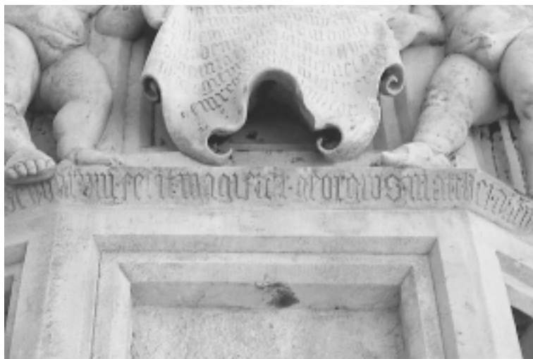
Šibenska katedrala, detalj natpisa s potpisom Jurja Dalmatinca Šibenik Cathedral, detail of inscription with Juraj Dalmatinac's »signature«

Tako 7. svibnja 1447. uzima Pincino na nauk Kristofora pok. Tome Provizonića (dokument br. 6), 7 a 18. svibnja svaki od majstora po jednog učenika: Juraj Dalmatinac Mihovila Živkovića (dokument br. 7), Lorenzo Pincino Marina Ljubova (dokument br. 8), a Andrija Aleši Luku Dragoševa Petanovića (dokument br. 9). Ova su četiri ugovora praktički istovjetno koncipirana. Svi su dječaci uzeti na nauk na rok od sedam godina, a majstori se obvezuju po isteku toga roka isplatiti im sedam dukata, te osigurati alat i odjeću. A da je sve to bilo učinjeno u svojevrsnom dogovoru i uz pomoć korčulanskih kamenara, svjedoči prisutnost Markovića i Bogdanića u ugovoru kojim Dalmatinac uzima na nauk Mihovila Živkovića, te podatak da je Kristofor Provizonić tada bio na nauku kod Andrije Markovića, 8 pa nije ni mogao preći u Pincinovu službu bez njegova pristanka.