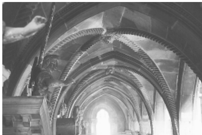
Šibenska katedrala, svodovi južnog bočnog broda Šibenik Cathedral, south aisle vaults

ljive ploče od rapske breče, no taj dio gradnje (do vijenca), kronološki je određen i natpisom na polupilonu apsida. 15 Same pak ploče od rapske breče nisu dio konstrukcije, već su kao ukrasna oplata umetnute u unaprijed pripremljena mjestu. 16