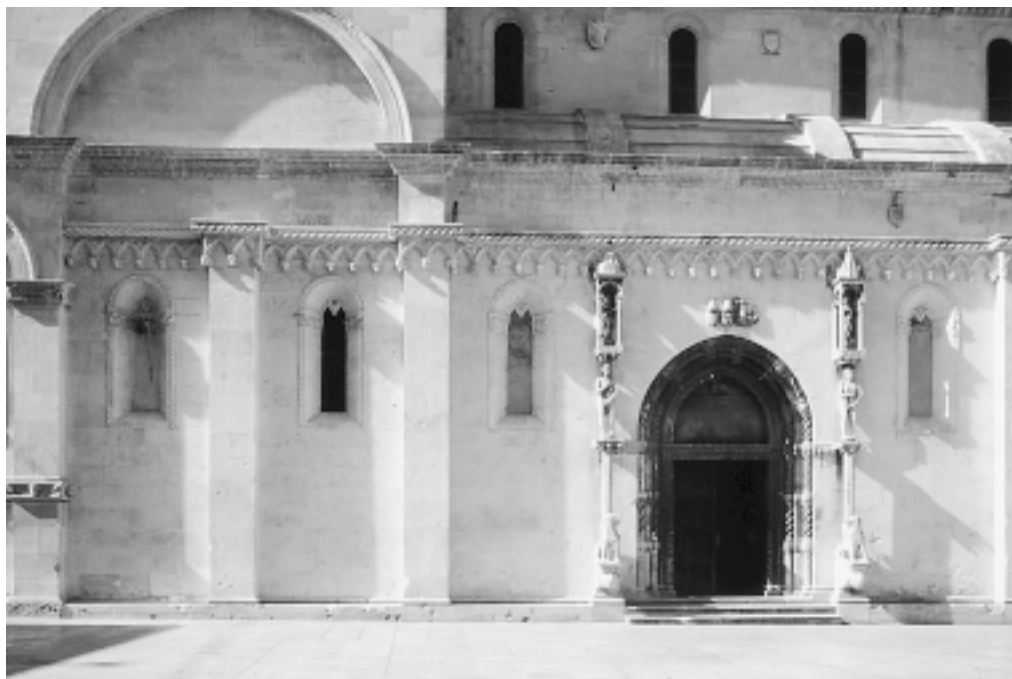
Šibenska katedrala, sjeverna fasada (detalj) Šibenik Cathedral, north façade (detail)