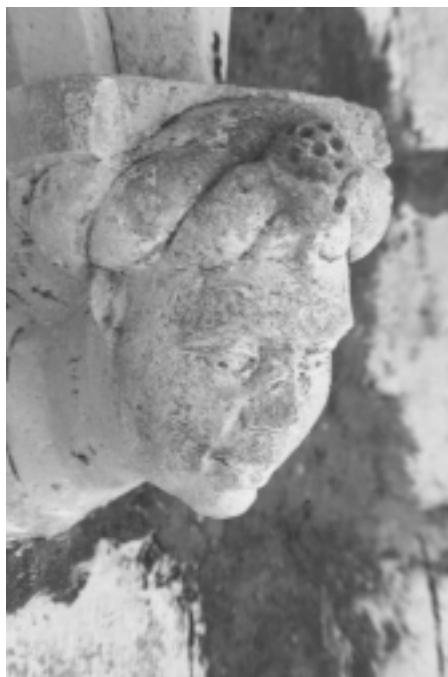
Šibenska katedrala, sjeverna fasada, konzola u obliku ljudske glave Šibenik Cathedral, north façade, console shaped as human head