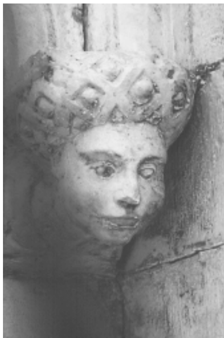
Šibenska katedrala, sjeverna fasada, konzola u obliku ljudske glave Šibenik Cathedral, north façade, console shaped as human head