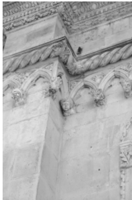
Šibenska katedrala, vijenci sjeverne fasade (detalj) Šibenik Cathedral, north façade cornices (detail)

Radovan Ivančević pak niz Jurjevih glava, a time dakako i apside, datira u razdoblje od 1441. do 1443. godine. 30