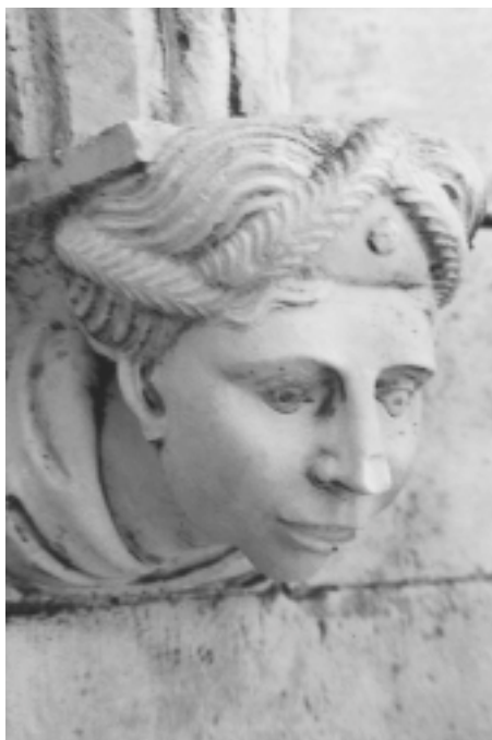
Šibenska katedrala, sjeverna fasada, konzola u obliku ljudske glave Šibenik Cathedral, north façade, console shaped as human head