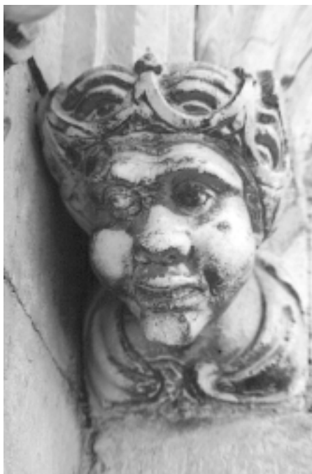
Šibenska katedrala, sjeverna fasada, konzola u obliku ljudske glave Šibenik Cathedral, north façade, console shaped as human head