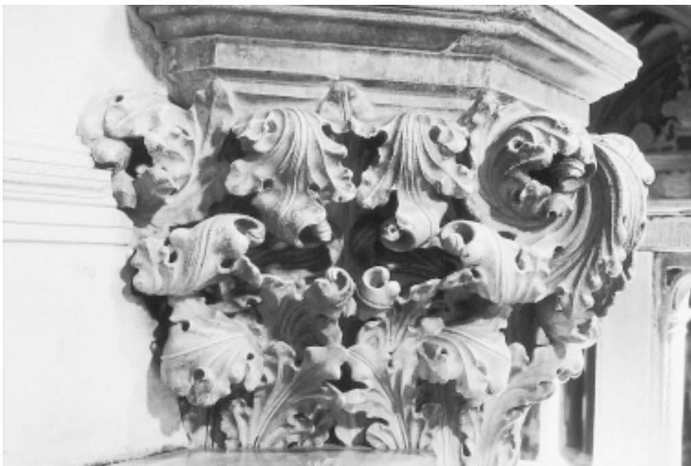
Šibenska katedrala, kapitel drugog desnog pilona Šibenik Cathedral, second right pylon capital