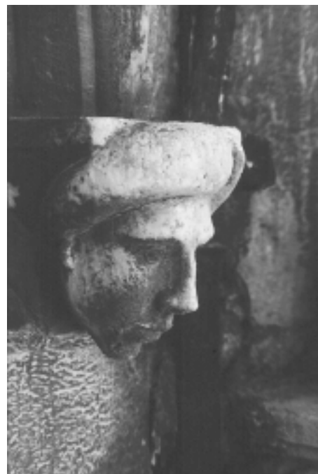
Šibenska katedrala, sjeverna fasada, konzola u obliku ljudske glave Šibenik Cathedral, north façade, console shaped as human head

deset upućuje na mogućnost da su možda vezani uz nadgradnju nad stupovima (7 po stupu).