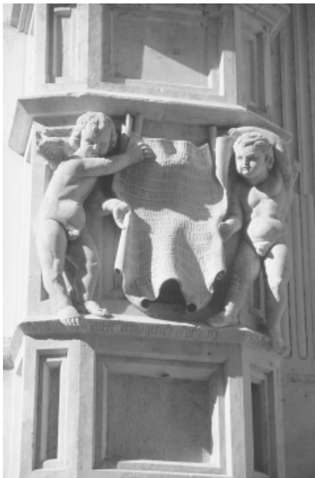
Šibenska katedrala, putti sa svečanim natpisom Šibenik Cathedral, putti with solemn inscription

problemi. Izgleda da su majstori, vadeći kamen za šibensku katedralu, naišli na izuzetno kvalitetnu žilu, na što su odmah reagirali predstavnici korčulanske katedrale. Oni su dana 22. studenog 1444. rezervirali za potrebe katedrale sv. Marka novopronađenu žilu, na način da se na njihov zahtjev isporuču za katedralu iz rečene žile sve potrebne kamenje. Majstorima je dopušteno da samo šesnaest blokova za šibensku katedralu izvade iz te žile, ali tek nakon što s toga mjesta isporuču četiri stupa s kapitelima i bazama za katedralu sv. Marka (dokument br. 3). Očito je da je spomenuta žila omogućavala vađenje velikih kompaktnih blokova kamena, pa se zasigurno tih šesnaest komada kamena za šibensku katedralu odnosi na one velike blokove za pilastre i njihove kapitule, koji se u prethodnom ugovoru spominju na kraju. Izgleda da majstori nisu bili zadovoljni nametnutim ograničenjima, jer je za kršenje ugovora predviđena vrlo velika kazna u iznosu od sto dukata.