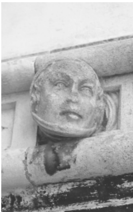
Šibenska katedrala, apside, ukras u obliku ljudske glave

Šibenik Cathedral, apses, ornament shaped as human head