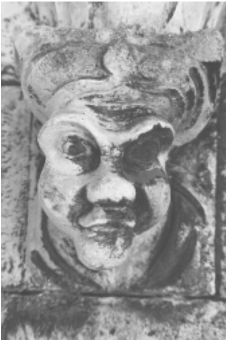
Šibenska katedrala, sjeverna fasada, konzola u obliku ljudske glave Šibenik Cathedral, north façade, console shaped as human head