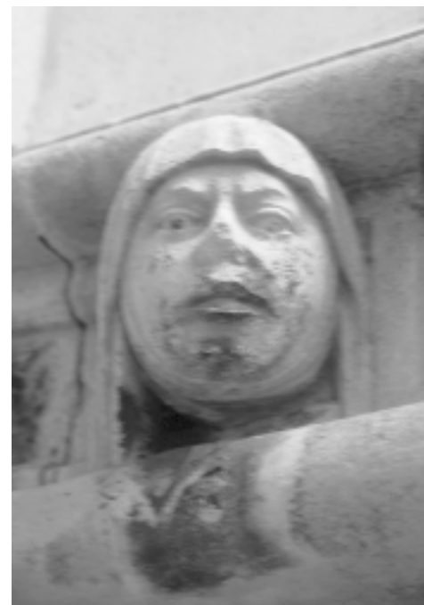
Šibenska katedrala, apside, ukras u obliku ljudske glave

Šibenik Cathedral, apses, ornament shaped as human head