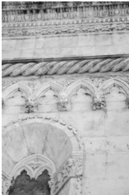
Šibenska katedrala, vijenci sjeverne fasade (detalj) Šibenik Cathedral, north façade cornices (detail)