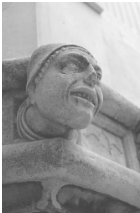
Šibenska katedrala, apside, ukras u obliku ljudske glave

Šibenik Cathedral, apses, ornament shaped as human head