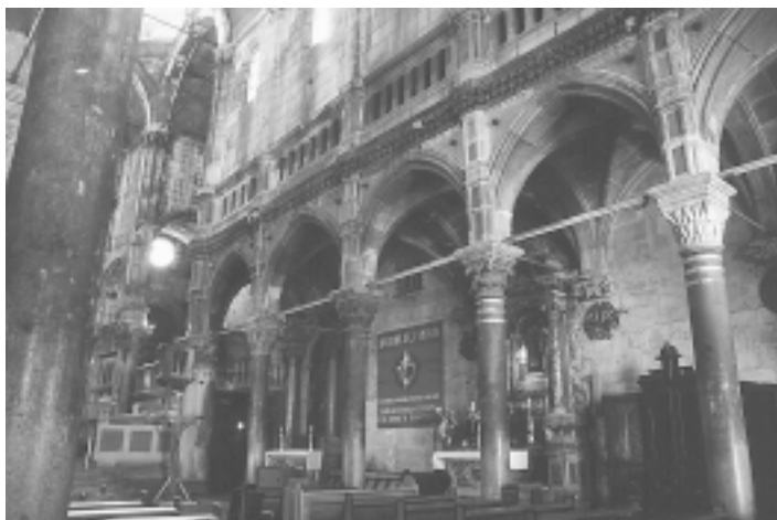
Šibenska katedrala, pogled na južni bočni brod Šibenik Cathedral, view of south aisle