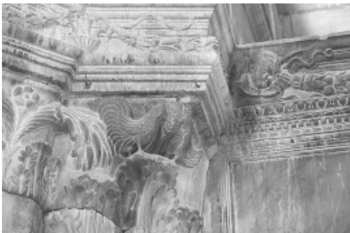
Šibenska katedrala, glavna apsida, polukapitel s likovima pijevaca Šibenik Cathedral, main apse, rooster half-capital