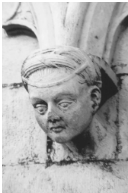
Šibenska katedrala, sjeverna fasada, konzola u obliku ljudske glave Šibenik Cathedral, north façade, console shaped as human head

Podatak da je isplata obavljena tek nakon tri godine upućuje na to da se predviđeni rok isporuke od godine i pol dana znatno produljio, no zacijelo je do proljeća 1447. godine, kada Juraj Dalmatinac isplaćuje majstorima 224 libre, ipak veći dio tog kamenja isporučen i ugrađen u katedralu. Pouzdano znamo da je do siječnja 1448. sav naručeni kamen isporučen (dokument br. 12), a nema razloga sumnjati da je odmah i upotrijebljen.