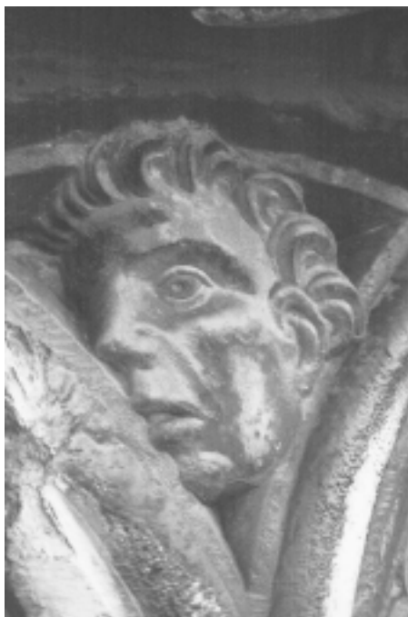
Šibenska katedrala, donji vijenac sjeverne fasade, ukras u obliku ljudske glave Šibenik Cathedral, north façade lower cornice, ornament shaped as human head