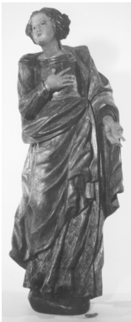
Zagreb, Zbirka Rošić, kip svetiце

Zagreb, Rošić Collection, statue of woman saint