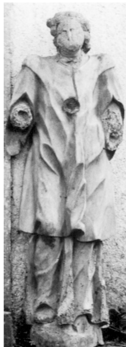
Lesišćina, crkva sv. Stjepana, kip sv. đakona

Lesišćina, St. Stephen's Church, statue of saint