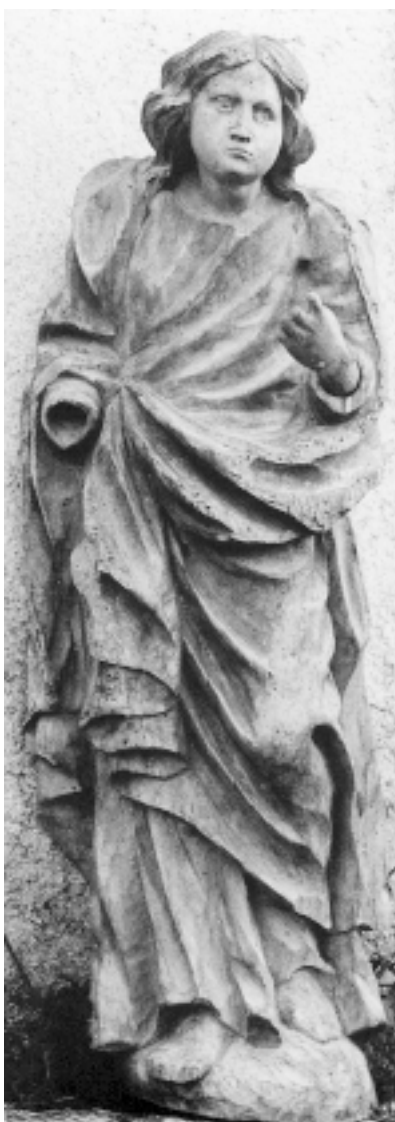
Lesišćina, crkva sv. Stjepana, kip sveca

Zagreb, Rošić Collection, statue of woman saint