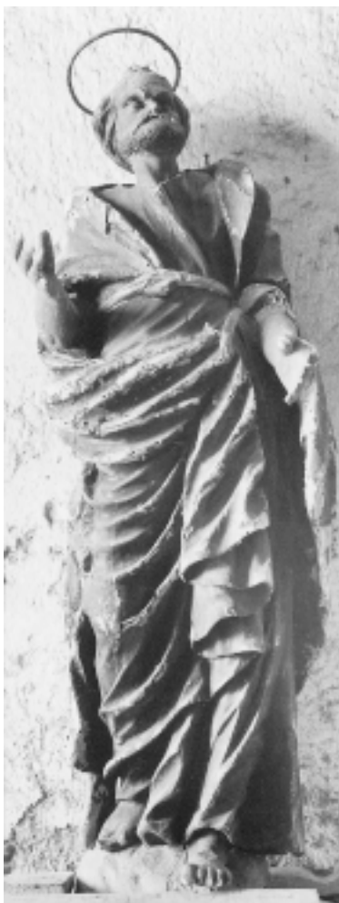
Brseč, St. Stephen's Church, St. Stephen's altar, statue of St. Paul