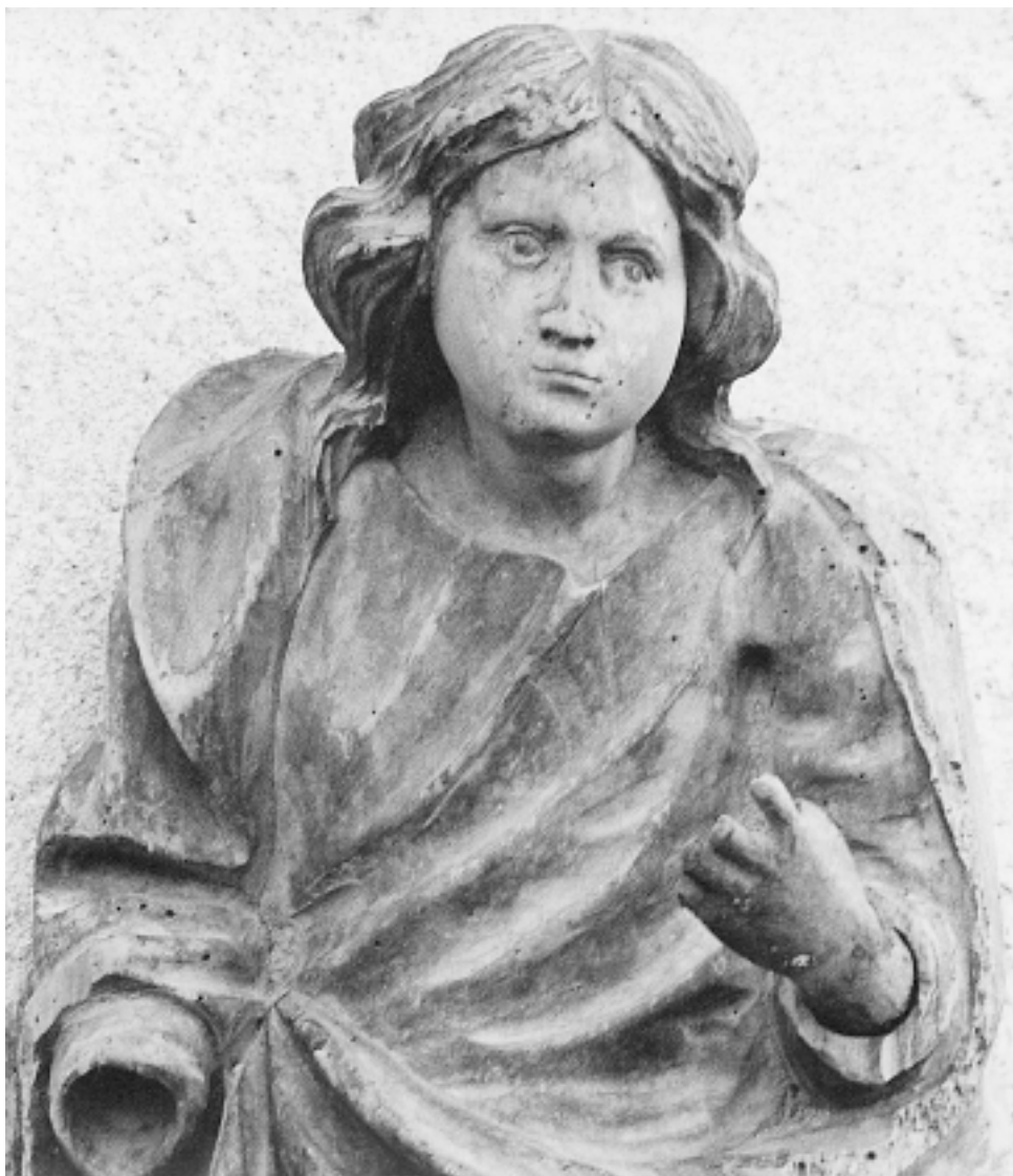
Lesišćina, crkva sv. Stjepana, kip sveca, detalj Lesišćina, St. Stephen's Church, statue of saint, detail

prikazuje sveca odjevenog u ruho đakona. Budući da je visinom jednak prethodno opisanom kipu te da s njim dijeli srodna obilježja poput istaknutih širokih ramena i jednostavnih, tvrdo lomljenih nabora donjeg dijela haljine vjerojatno su oba kipa nekoć pripadala istoj cjelini.