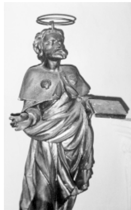
Filipana, župna crkva sv. Filipa i Jakova, kip sv. Filipa

Filipana, parish church of St. Philip and St. Jacob, statue of St. Philip