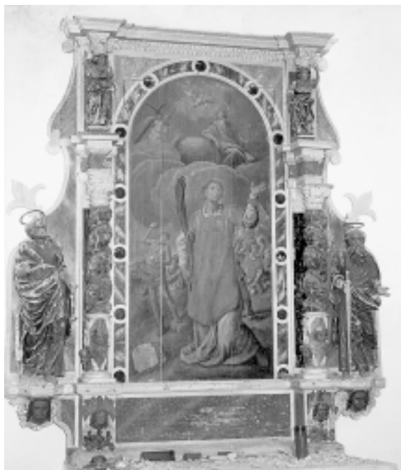
Brseč, crkva sv. Stjepana, oltar sv. Stjepana Brseč, St. Stephen's Church, St. Stephen's altar