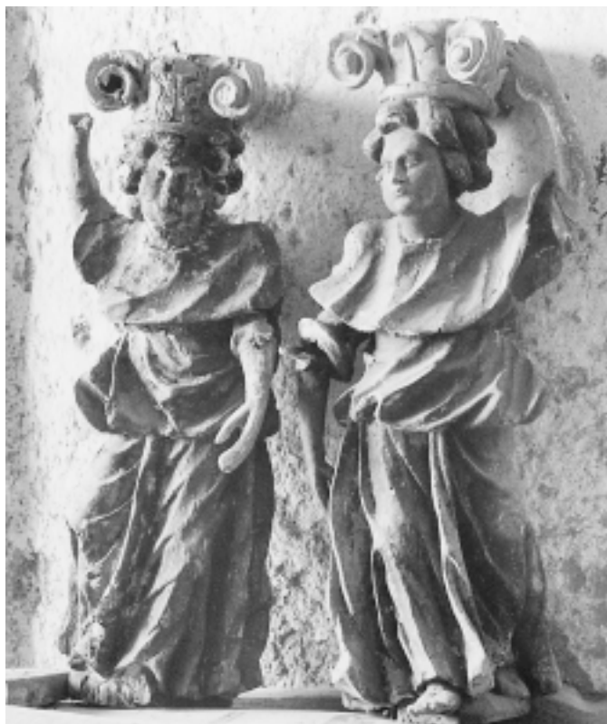
Brseč, crkva sv. Stjepana, oltar sv. Stjepana, karijatidne figure

Brseč, St. Stephen's Church, St. Stephen's altar, statue of St. Peter, detail