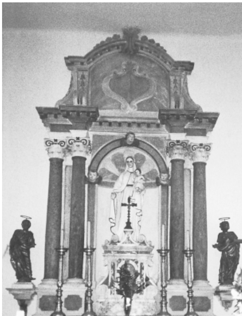
Filipana, župna crkva sv. Filipa i Jakova, glavni oltar Filipana, parish church of St. Philip and St. Jacob, main altar

ši tijekom pastoralnog pohoda 1701. godine Filipanu, biskup J. M. Bottari u svojem izvještaju bilježi da je » poduzetni župnik svojom marljivošću ukusno uljepšao crkvu i još će je ukrasiti «. 4 Nažalost, ne navodi se potanje o kakvim je zahvatima riječ. Je li možda već u to vrijeme podignut oltar ili su nabavljeni kipovi? Vitalna energija silovitog, ali ne i u punoj mjeri oslobođenog i nesputanog pokreta figura sv. Filipa i sv. Jakova dopušta prijedlog okvirne datacije kipova na kraj 17. ili prva desetljeća 18. stoljeća. Zasad nisu pronađeni konkretni primjeri oblikovno i stilski analogne datirane skulpture koji bi pomogli preciznijem datiranju kipova i profiliranju njihova majstora. Kontrolirani tijekom draperije koja obavlja figure ne prigušujući, već naprotiv naglašavajući njihovu tjelesnost, odgovara shvaćanju figure prevladavajućem u okvirima južne, mediteranske kiparske tradicije, ali srodna rješenja nisu nepoznata ni srednjoeuropskom baroknom kiparstvu. Upravo u tom, sjevernom smjeru, vode nas tipovi