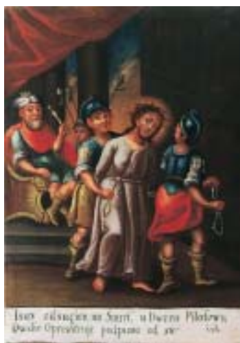
Križni put iz Kraljeve Sutjeske, vjerojatno anonimni poljski slikar, kraj 18. stoljeća; I. Isus od Pilata osuđen na smrt

The Way of the Cross from Kraljeva Sutjeska, probably an anonymous Polish painter, the end of the 18 th century, I. Christ condemned to death