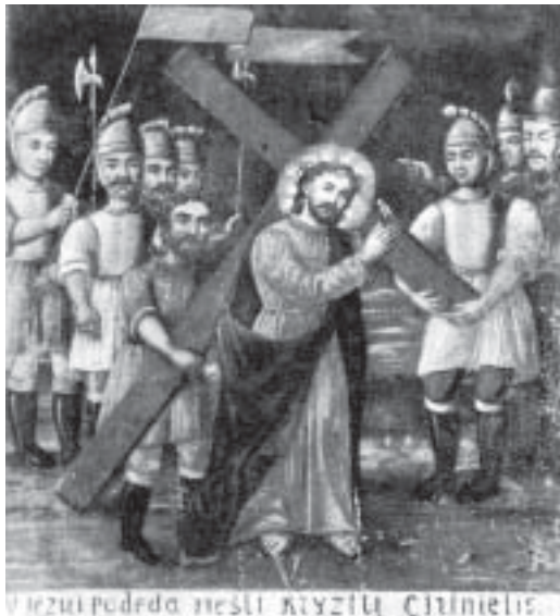
Anonimni litavski (poljski?) majstor, 19. st., Isusa skidaju s križa (Pietà)

Anonymous Lithuanian (Polish?) master, 19 th century; Simon of Cyrene is made to bear the cross