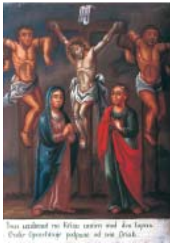
XII. Isus umire na križu XII. Christ's death on the cross