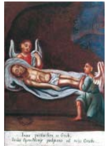
XIV. Isusa polažu u grob XIV. Christ is laid in the tomb

scena nema mnogo veze s likovnošću Križnoga puta iz Kraljeve Sutjeske, pokazuju se neke dodirne točke koje je korisno zabilježiti. U dubinu Baračeva prizora povučen je sveti prizor. Prema njemu, hijerarhijski organiziranom, okrenuta je druga hijerarhijski organizirana skupina (vojnici prema svećenstvu). U prednjem planu stoji šarolika skupina civila: djeca, psi, građani, pučani, seljaci. Oni svi okreću leđa procesiji i gledaju u slikara-portretista. Gotovo demonstrativno nepobožno njihov stav odgovara duhu klasicizma. Križni put iz Kraljeve Sutjeske ima znatno jače stilsko rodoslovlje od Baračeva akvarela. Iza njega stoji visoka este-