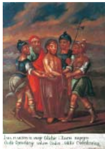
X. Isusa svlače X. Christ is stripped of His garments

manje participiraju u sceni no što gledaju u slikara, u portretista, gotovo u nekoj protofotografskoj situaciji. Likovi u prizorima Križnoga puta statiraju u kazališnim scenama, u »živim slikama«, i ta protofotografičnost nosi u sebi onaj duboki stilski pečat koji je možda manje intenzivan u samom autorskom rukopisu.