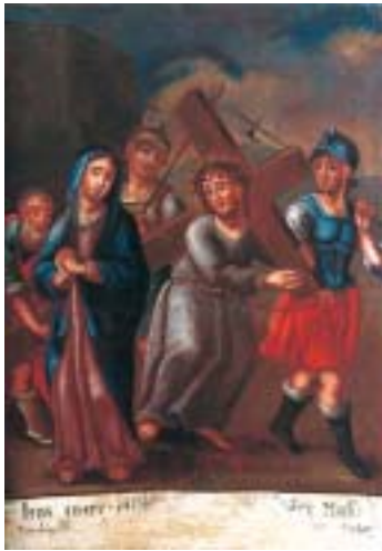
IV. Isus susreće majku svoju IV. Christ meets His Blessed Mother