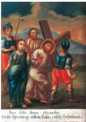
VIII. Isus govori rasplakanim ženama VIII. Christ meets the women of Jerusalem