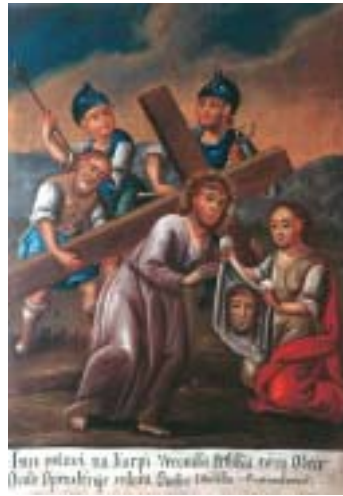
VI. Veronika pruža Isusu rubac VI. Christ's face is wiped by Veronica