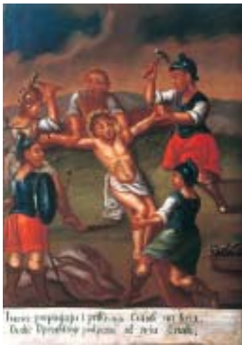
XI. Isusa pribijaju na križ XI. Christ's crucifixion