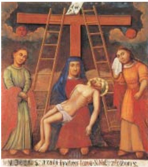
Anonimni litavski (poljski?) majstor, 19. st., Šimun pomaže Isusu nositi križ

Anonymous Lithuanian (Polish?) master, 19 th century; Simon of Cyrene is made to bear the cross