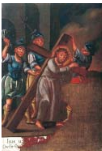
II. Isus nosi križ II. The cross is laid upon Christ

The Way of the Cross from Kraljeva Sutjeska, probably an anonymous Polish painter, the end of the 18 th century, I. Christ condemned to death