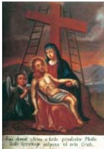
XIII. Isusa skidaju s križa XIII. Christ's body is taken down from the cross