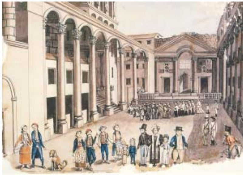
Antun Barač (1790.–1855.), Procesija na Peristilu u Splitu Antun Barač (1790–1855), the Procession on Peristil in Split

Križni put jest završetak kristološkog ciklusa. Taj je ciklus, scenu po scenu, niz oglednih slika našega ljudskog života: naše ogledalo, skandiranje našega prolaska zemljom, naša zadanost i opomena. Sam križni put razdijeljen je u četranest podscena, koje opet zadržavaju oglednu relaciju prema našem postojanju. Da ne ulazim u tumačenje pojedinačnih prizora, što je načinjeno bezbroj puta i na visokim literarnim razinama, 15 valja ipak podsjetiti na onu obnovu suglasja koju svagdašnjica uvijek iznova pruža svakom velikom uzoru. Tako Križni put govori jasno o apsurdima i granicama demokracije (izbor slobode za Barabu, smrti za Isusa), o bijedi ljudskog suđenja, o besmislu materijalnih nasljeđa (bacanje kocke ma za što naše), o rizicima solidarnosti, o osamljenosti pojedinca (»Jamo moja, sâm sam«), 16 o memoriji kao nagra-