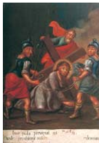
III. Isus pada prvi put na zemlju III. Christ's first fall