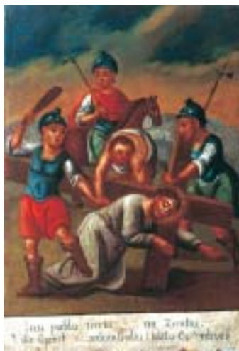
IX. Isus pada treći put na zemlju IX. Christ's third fall