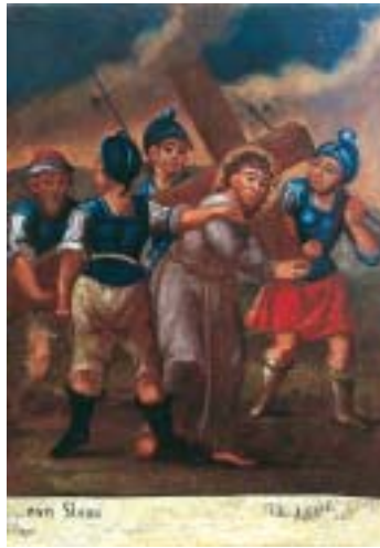
V. Šimun pomaže Isusu nositi križ V. Simon of Cyrene is made to bear the cross