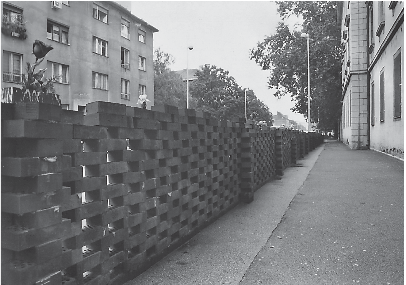
10–12. Zid boli , Zagreb, od 1993. nadalje 10–12. Wall of Pain , Zagreb, from 1993 on

Sredinom 19. stoljeća parkovni arhitekt Peter Joseph Lenné stvara novo parkovno rješenje, u središtu kojega se nalazio spomenik invalidima u obliku stupa. 24 Konzekventno provedena izgradnja definira ovaj dio grada tipičnim gradskim stambenim i javnim palačama, obližnjom vojnom bolnicom i Gnadenkirche, srušenom tijekom Drugoga svjetskog rata. U hladnoratovskom periodu taj dio grada postao je ruinom povijesnog procesa gradogradnje, što se od 1990. godine nadalje nastojalo prevladati opsežnim rekonstrukcijama, interpolacijama i uređivanjem javnih površina.