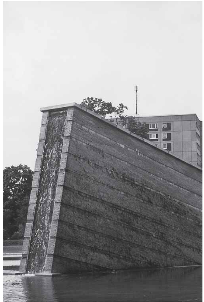
5–9. Christoph Girot, Sinkende Mauer (Tonući zid) , Berlin, 1995. 5–9. Christophe Girot, Sinkende Mauer (Sinking Wall), Berlin, 1995

odlučivanja o akcijama, odnosno o prednostima poštivanja praznih površina, bez spomeničkih sadržaja?