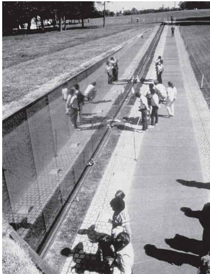
13. Maya Lin – Vietnam Veterans Memorial (Spomenik veteranima Vijetnamskog rata) , Washington, 1981. (preuzeto: R. Harbison, The Built, the Unbuilt and the Unbuildable , Thames and Hudson, London 1993.)

13. Maya Lin – Vietnam Veterans Memorial, Washington, 1981 (taken from: R. Harbison, The Built, the Unbuilt and the Unbuildable, Thames and Hudson, London 1993)