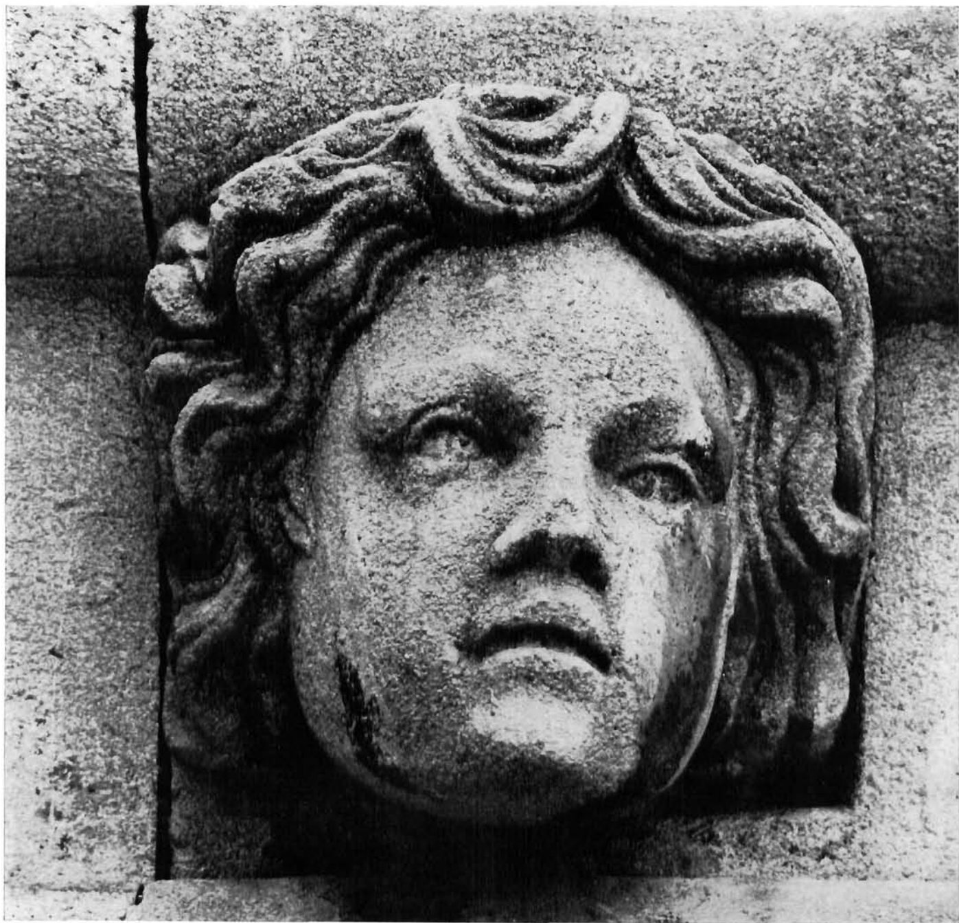
Juraj Matejev Dalmatinac, glava s apside šibenske katedrale (1443)