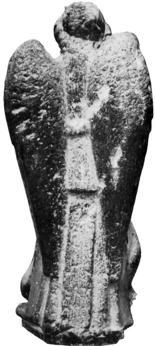
Juraj Matejev Dalmatinac, anđeo Navještenja s ciborija oltara Sv. Staša u Splitu (1448), stražnja strana

Jedini odgovor koji ne bi podcjenjivao Jurjev stvaralački potencijal i nesumnjivu vrijednost njegovih ostvarenja jest postavka da je Juraj svjesno izabirao što hoće raditi, da je zadržavao određenu samostalnost u svom radu. U starijem povijesno-umjetničkom promatranju Jurjeve ličnosti taj je »izbor« bio prešutno osuđen i Juraj je zbog njega promatran kao majstor provincijske retardacije. A zapravo, situacija bijaše upravo obrnuta. Taj je izbor dokaz samovoljnosti, samostalnosti njegove ličnosti a time i vrijednosti njegovih kracija.