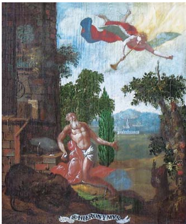
10. Ivan Krstitelj Ranger, S. HIERONYMVS , ulje na dasci, 1735.–1737., Lepoglava, pjevalište

Ivan Krstitelj Ranger, S. HIERONYMVS, oil on wood, 1735–1737, choir of the church at Lepoglava