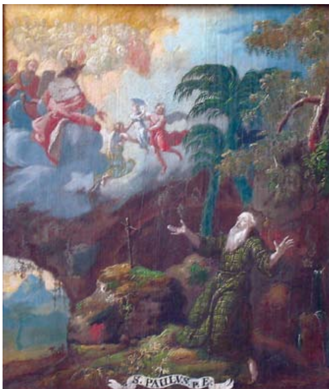
8. Ivan Krstitelj Ranger, S. PAULVS p. E. , ulje na dasci, 1735.–1737., Lepoglava, pjevalište

Ivan Krstitelj Ranger; S. PAULVS p. E., oil on wood, 1735–1737, choir of the church at Lepoglava