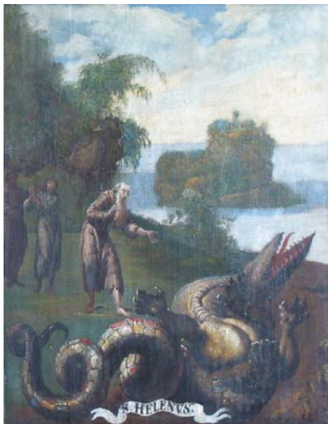
17. Ivan Krstitelj Ranger, S. HELENVS. , ulje na dasci, 1735.–1737., Lepoglava, pjevalište

Ivan Krstitelj Ranger; S. PAPHNUTIVS., oil on wood, 1735–1737, choir of the church at Lepoglava