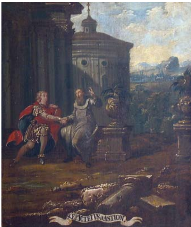
22. Ivan Krstitelj Ranger, S. EPICETVS & ASTION. , ulje na dasci, 1735.–1737., Lepoglava, pjevalište

Ivan Krstitelj Ranger; S. EPICETVS & ASTION., oil on wood, 1735–1737, choir of the church at Lepoglava