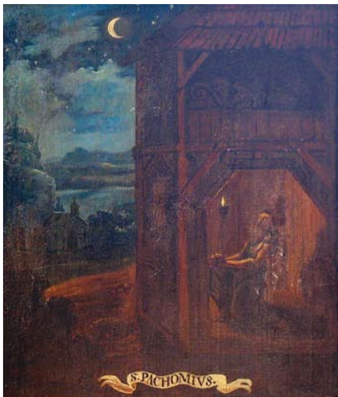
20. Ivan Krstitelj Ranger, S. PACHOMIVS. , ulje na dasci, 1735.–1737., Lepoglava, pjevalište Ivan Krstitelj Ranger; S. PACHOMIVS. , oil on wood, 1735–1737, choir of the church at Lepoglava