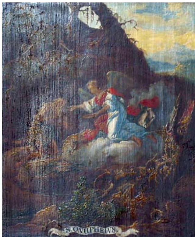
21. Ivan Krstitelj Ranger, S. ONUPHRIVS. , ulje na dasci, 1735.–1737., Lepoglava, pjevalište Ivan Krstitelj Ranger; S. ONUPHRIVS. , oil on wood, 1735–1737, choir of the church at Lepoglava