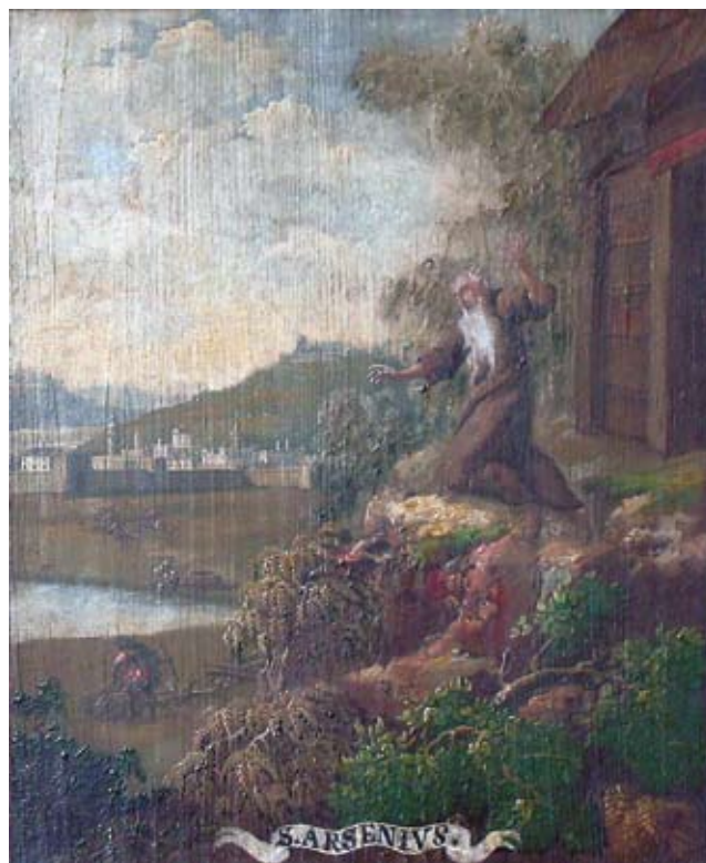
19. Ivan Krstitelj Ranger, S. ARSENIVS. , ulje na dasci, 1735.–1737., Lepoglava, pjevalište

Ivan Krstitelj Ranger, S. EPHRÆM., oil on wood, 1735–1737, choir of the church at Lepoglava