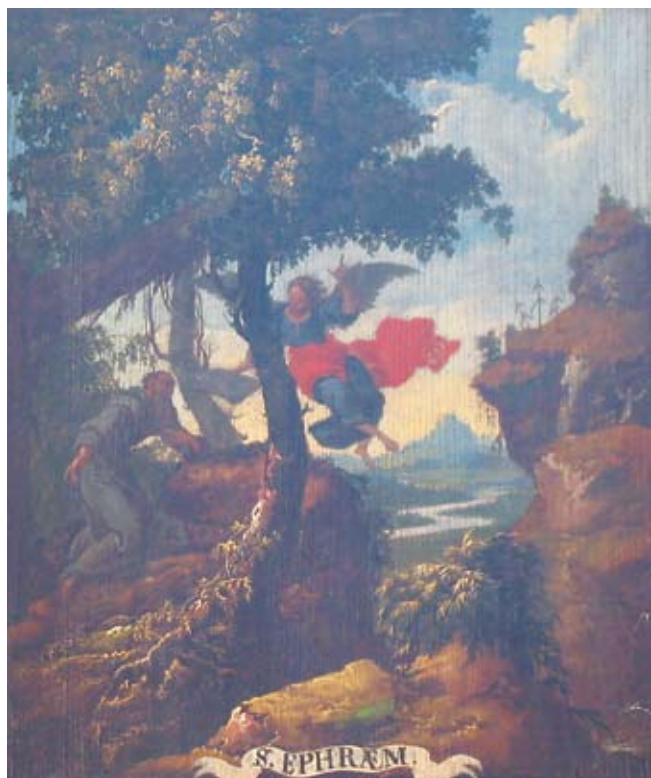
18. Ivan Krstitelj Ranger, S. EPHRÆM. , ulje na dasci, 1735.–1737., Lepoglava, pjevalište

Ivan Krstitelj Ranger, S. EPHRÆM., oil on wood, 1735–1737, choir of the church at Lepoglava