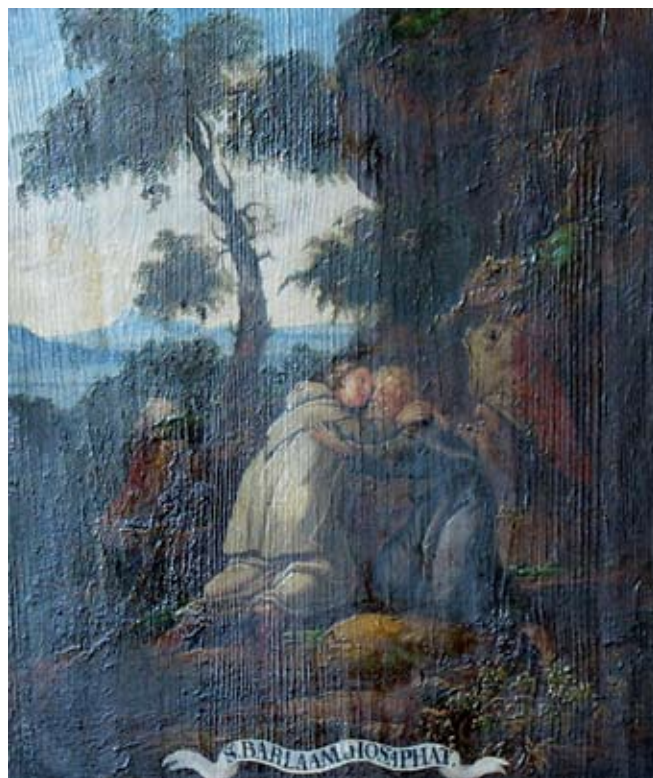
23. Ivan Krstitelj Ranger, S. BARLAAM & JOSAPHAT. , ulje na dasci, 1735.–1737., Lepoglava, pjevalište

Ivan Krstitelj Ranger; S. EPICETVS & ASTION., oil on wood, 1735–1737, choir of the church at Lepoglava