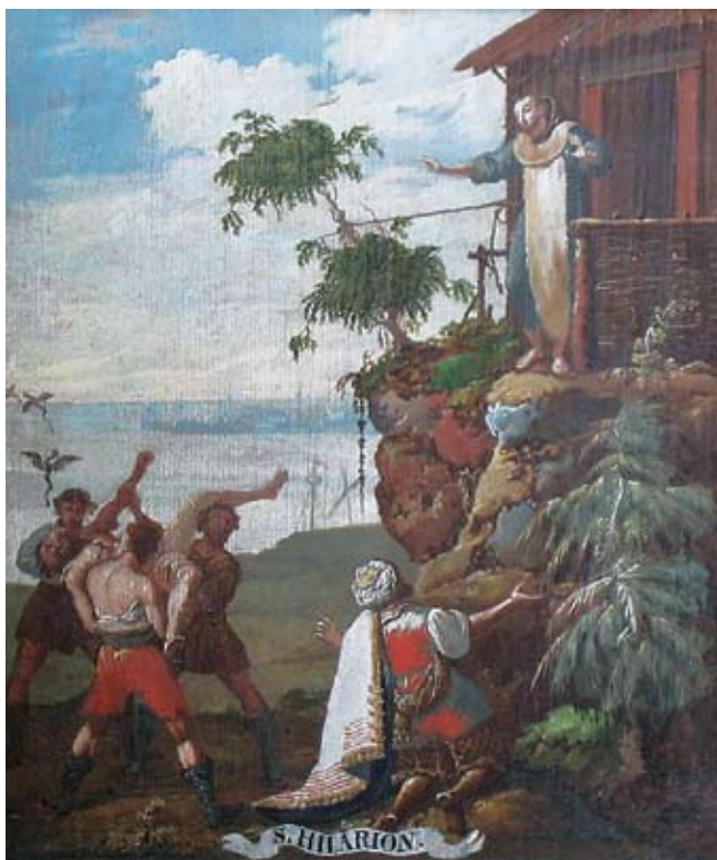
12. Ivan Krstitelj Ranger, S. HILARION. , ulje na dasci, 1735.–1737., Lepoglava, pjevalište Ivan Krstitelj Ranger; S. HILARION. , oil on wood, 1735–1737, choir of the church at Lepoglava