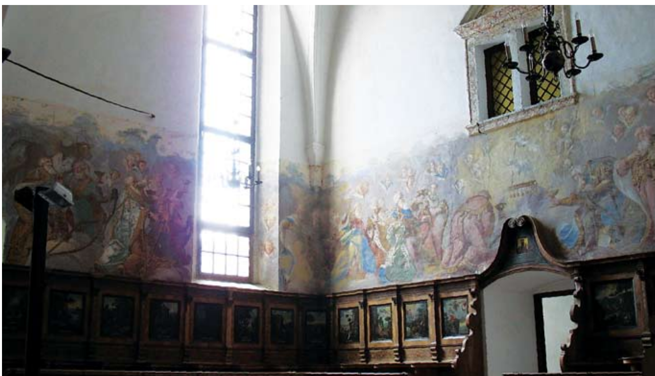
2. Lepoglava, Crkva sv. Marije, pjevalište, pogled na sjeverozapadnu stranu Lepoglava, church of St Mary, choir, view to the northeast