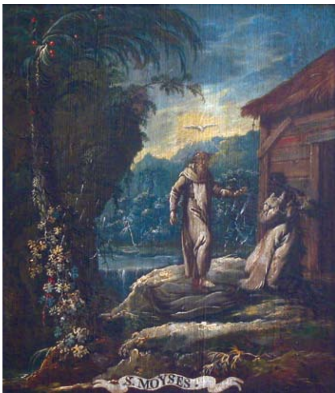
28. Ivan Krstitelj Ranger, S. MOYSES. , ulje na dasci, 1735.–1737., Lepoglava, pjevalište

Ivan Krstitelj Ranger, S. MOYSES., oil on wood, 1735–1737, choir of the church at Lepoglava