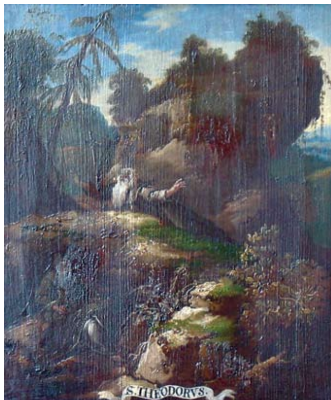
27. Ivan Krstitelj Ranger, S. THEODORVS. , ulje na dasci, 1735.–1737., Lepoglava, pjevalište

Ivan Krstitelj Ranger, S. THEODOSIVS., oil on wood, 1735–1737, choir of the church at Lepoglava