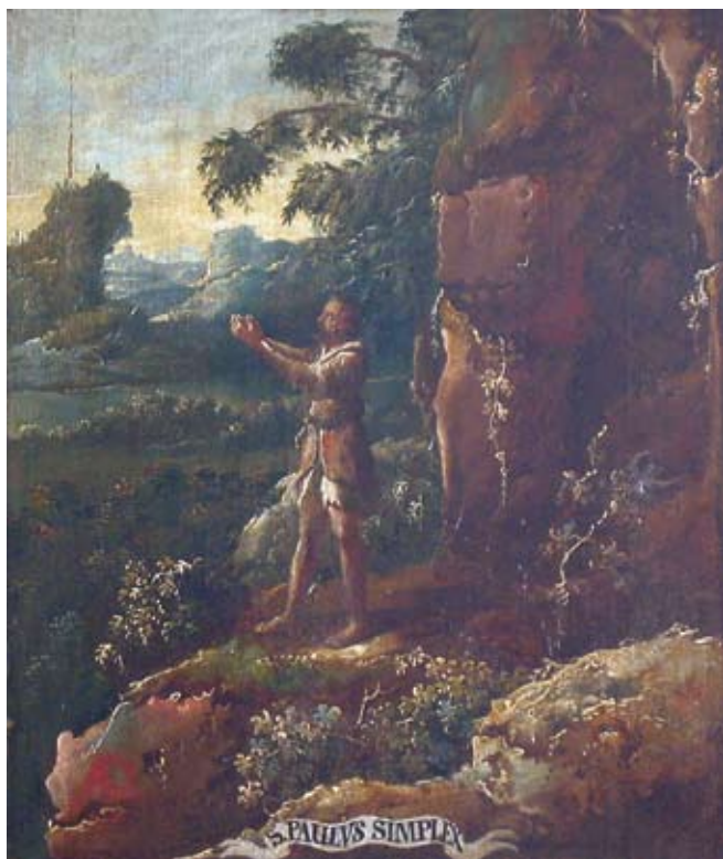
24. Ivan Krstitelj Ranger, S. PAULVS SIMPLEX. , ulje na dasci, 1735.–1737., Lepoglava, pjevalište Ivan Krstitelj Ranger, S. PAULVS SIMPLEX., oil on wood, 1735–1737, choir of the church at Lepoglava