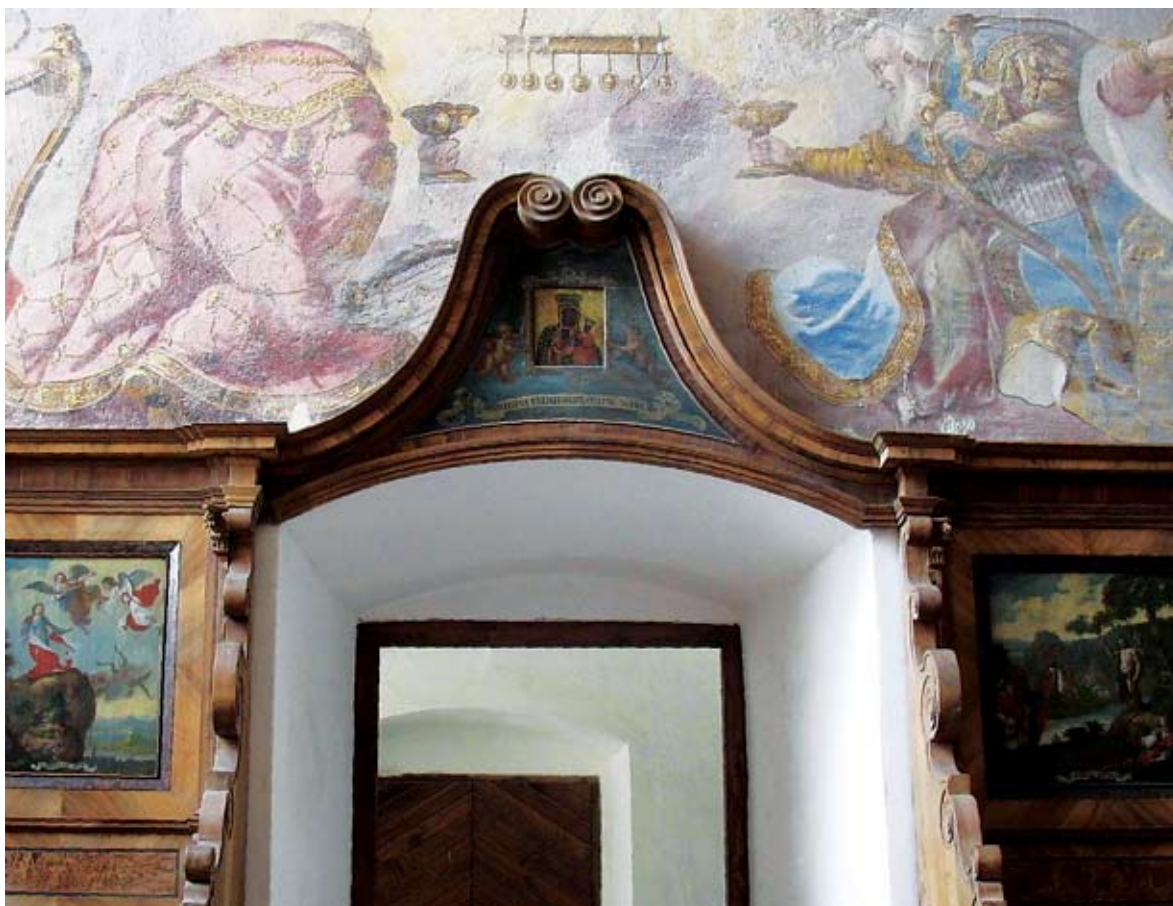
4. Lepoglava, Crkva sv. Marije, pjevalište, Majka Božja Częstowska na sjedalima pjevališta, ulje na dasci Lepoglava, church of St Mary, choir, Our Lady of Częstochowa on choir seats, oil on wood