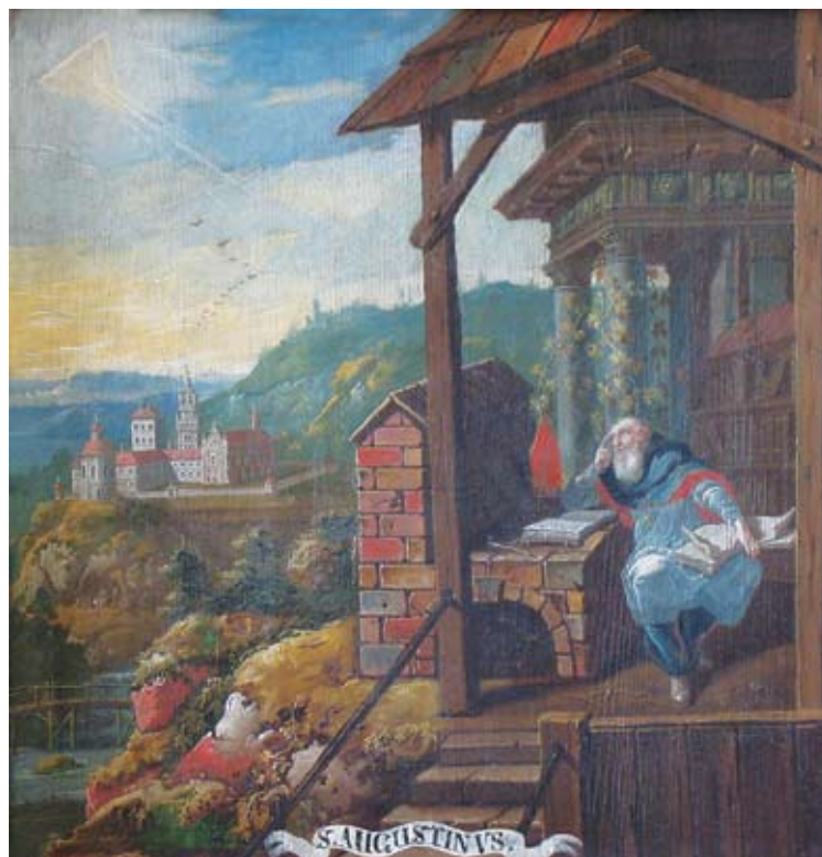
11. Ivan Krstitelj Ranger, S. AUGUSTINVS , ulje na dasci, 1735.–1737., Lepoglava, pjevalište

Ivan Krstitelj Ranger, S. HIERONYMVS, oil on wood, 1735–1737, choir of the church at Lepoglava