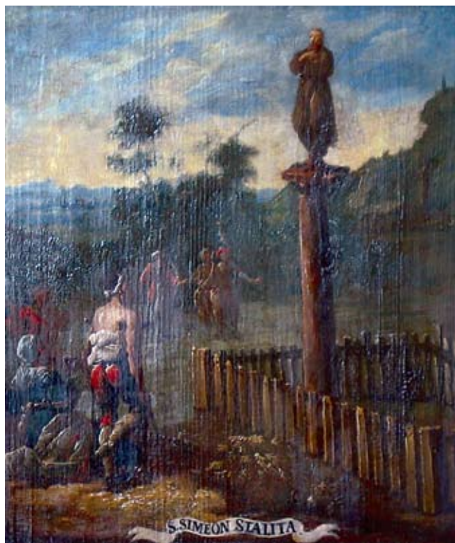
25. Ivan Krstitelj Ranger, S. SIMEON STALITA. , ulje na dasci, 1735.–1737., Lepoglava, pjevalište Ivan Krstitelj Ranger, S. SIMEON STALITA., oil on wood, 1735–1737, choir of the church at Lepoglava