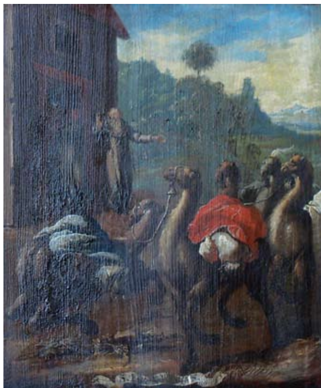
29. Ivan Krstitelj Ranger, S. M (sv. Menas ?) , ulje na dasci, 1735.–1737., Lepoglava, pjevalište

Ivan Krstitelj Ranger, S. MOYSES., oil on wood, 1735–1737, choir of the church at Lepoglava