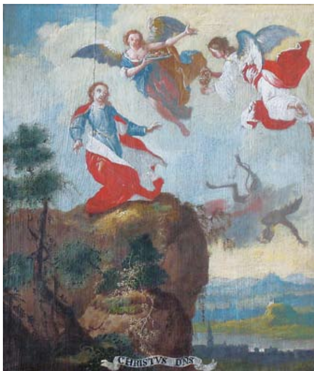
6. Ivan Krstitelj Ranger, CHRISTVS DÑS , ulje na dasci, 1735.–1737., Lepoglava, pjevalište

Ivan Krstitelj Ranger; CHRISTVS DÑS, oil on wood, 1735–1737, choir of the church at Lepoglava