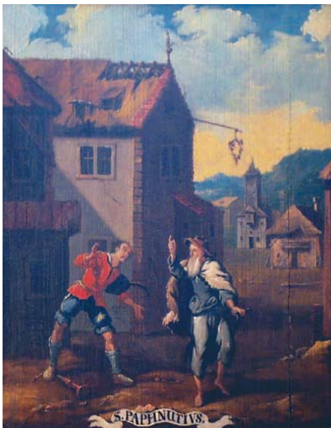
16. Ivan Krstitelj Ranger, S. PAPHNUTIVS. , ulje na dasci, 1735.–1737., Lepoglava, pjevalište

Ivan Krstitelj Ranger; S. PAPHNUTIVS., oil on wood, 1735–1737, choir of the church at Lepoglava