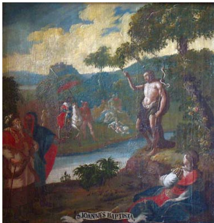
7. Ivan Krstitelj Ranger, S. IOANNES BAPTISTA , ulje na dasci, 1735.–1737., Lepoglava, pjevalište

Ivan Krstitelj Ranger; CHRISTVS DÑS, oil on wood, 1735–1737, choir of the church at Lepoglava