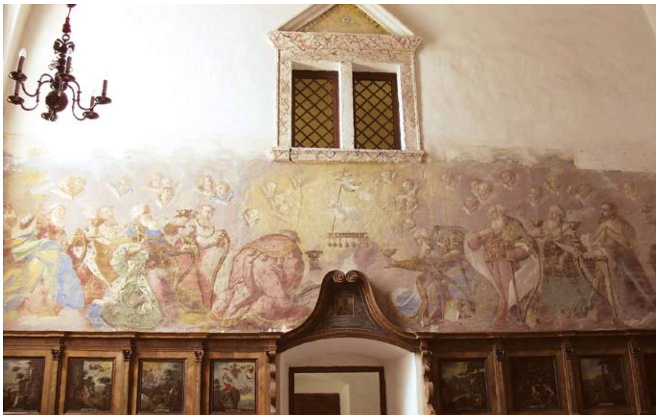
1. Lepoglava, Crkva sv. Marije, pjevalište, Ivan Krstitelj Ranger, Dvadeset i četiri Starca apokalipse i četiri Bića klanjaju se Janjetu, zidna slika, 1737., (foto: S. Cvetnić)

Lepoglava, church of St Mary, choir, Ivan Krstitelj Ranger, Twenty-Four Elders of the Apocalypse and four Living Beings Adoring the Lamb, wall painting, 1737