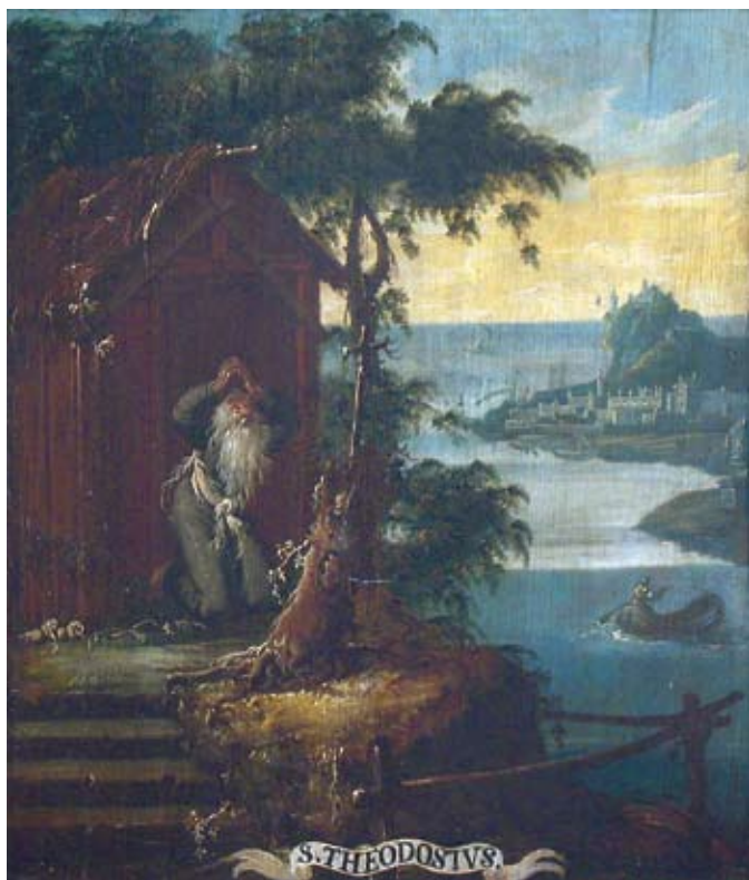
26. Ivan Krstitelj Ranger, S. THEODOSIVS. , ulje na dasci, 1735.–1737., Lepoglava, pjevalište

Ivan Krstitelj Ranger, S. THEODOSIVS., oil on wood, 1735–1737, choir of the church at Lepoglava