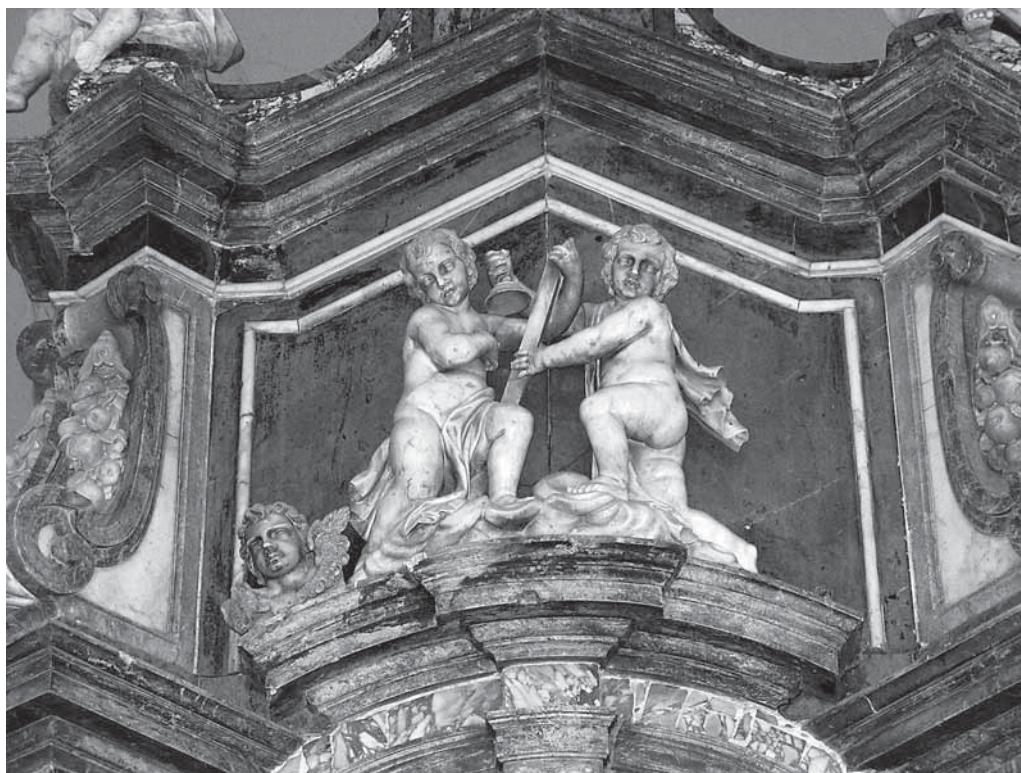
2. Antonio Michelazzi, atički zaključak oltara sv. Jurja (danas bl. Augustina Kažotića) – središnji dio, mramor, 1741.–1746., Lupoglav, Župna crkva bl. Augustina Kažotića, svetište Antonio Michelazzi, the attic ending of the Altar of St George (present-day altar of Bl. Augustin Kažotić), – centrepiece, marble, 1741–1746, Lupoglav, parish church of Bl. Augustin Kažotić

vora, na kojem Tkalčić temelji svoju tvrdnju o naknadno pridodanom atičkom katu, nema spomena nikakve oltarne arhitekture, već se navode samo skulpture, ovoga puta od kararskoga mramora, i to one – bl. Augustina Kažotića i dvaju putta koji u rukama drže mitru i pastoral.