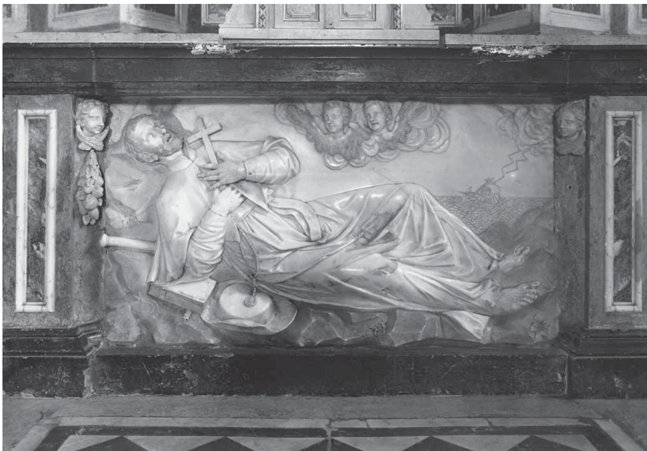
3. Antonio Michelazzi, Smrt sv. Franje Ksaverskoga , mramor, 1741.–1746., Lupoglav, Župna crkva bl. Augustina Kažotića, svetište

Antonio Michelazzi, Death of St Francis Xavier , marble, 1741–1746, Lupoglav, parish church of Bl. Augustin Kažotić