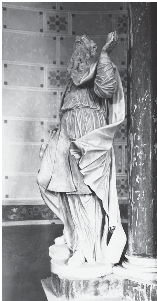
5. Antonio Michelazzi, Sv. Augustin Hiponski , mramor, 1741.–1746., Lupoglav, župna crkva bl. Augustina Kažotića, svetište

Antonio Michelazzi, St Augustine of Hippo , marble, 1741–1746, Lupoglav, parish church of Bl. Augustin Kažotić