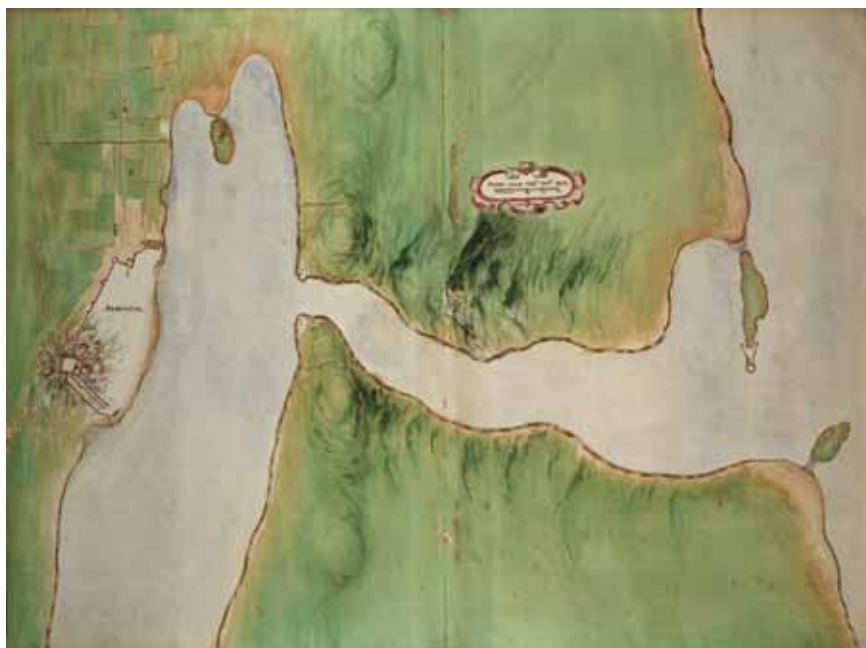
1. Šibenik s okolicom (Archivio di Stato, Torino) Šibenik and environs (Archivio di Stato, Torino)

vokutne) čestice. Tu se ističe pravocrtni tok ceste 7 što vodi prema gradskim vratima, današnja Radićeva ulica, s istoka se spušta put na mjestu današnje Grubišićeve ulice, te sa sjevera lagano zavojita današnja Zvonimirova. Osobito je zanimljiv zid pojačan polukulama što se južno od grada spušta prema obali, približno u zoni današnje Ulice fra Jeronima Milete. Očigledno je bila riječ o zaštiti predgrađa, prostora neposredno pred gradom, i to prema najlakše pristupačnoj južnoj strani. Posve slični ali slabiji zidovi ucrtani su i uz Kanal sv. Ante, u ulozi zaštite kopnenoga pristupa dvjema kulama što su ondje nadzirale ulaz u luku.