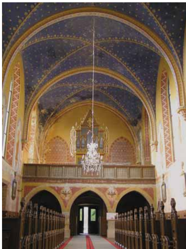
7. Unutrašnjost crkve u Veleševcu, pogled prema koru

Nabavljanje nove unutrašnje opreme za crkvu u Veleševcu uglavnom je završeno tijekom 1871. godine, dakle prije