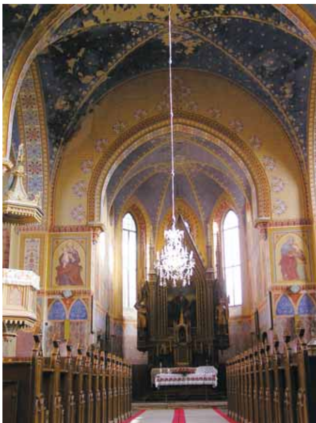
6. Unutrašnjost crkve u Veleševcu, pogled prema svetišću

Interior of the church in Veleševac, view onto the chancel