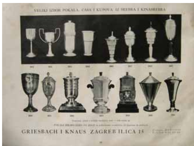
10 Ponuda sportskih pokala iz kataloga s ponudom tvrtke, 1936. The range of sporting cups, from the firm's catalogue of 1936

tako da nakon popravka izgledaju kao novi.« 27 Međutim, izvedba srebrnine i predmeta za opremu stola nije imala vlastitu katalošku ponudu. Izrađivali su pladnjeve, vrčeve, servise za čaj i kavu kao i sve »stolne predmete« te reklamirali izradu svijećnjaka u svim stilovima i popravke srebrnine. 28 Pladnjevi iz njihove produkcije s jedne strane slijede moderno oblikovanje glatkih profilacija i lomljenih stranica u duhu art decoa (sl. 8), pri čemu maksimalno iskorištavaju kvalitetu poliranog srebra kombiniranjem reflektirajućih ploha ili se oslanjaju na reprezentativne uzore historicizma preuzimajući cvjetne elemente ukrasnih bordura aplicirane na razvedene rubne profilacije (sl. 9). Iako su primjeri malobrojni, ukazuju na dvojnost stilskih kretanja tih godina: sklonost geometrizmu art decoa kao i sklonost oblikovanju s izraženijim reminiscencijama na historijske stilove.