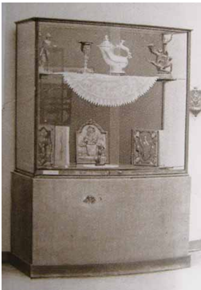
2 Vitrina s predmetima Ive Kerdića na izložbi »Djela« 1927. u Zagrebu, presnimka iz revije Svijet, 1927., br. 21

Display case with objects of Ivo Kerdić at the Djela exhibition in Zagreb in 1927, copied from the review Svijet, 1927, no. 21