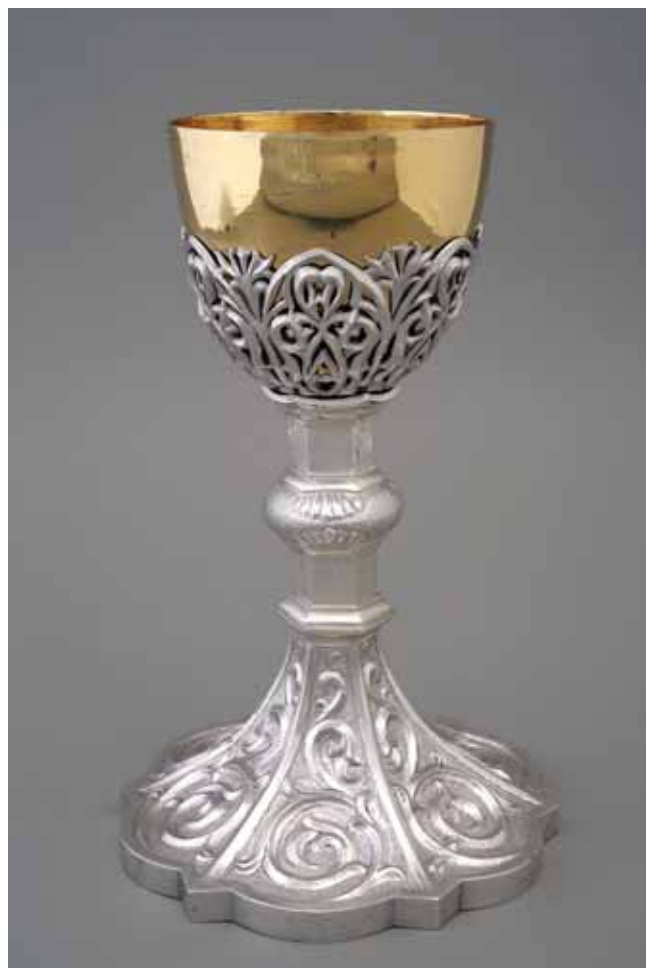
6 Kalež, pozlačeno srebro, nakon sredine 1933., Muzej za umjetnost i obrt (snimio S. Budek) Chalice, silver gilt, after mid 1933, Museum of Arts and Crafts

u Zagrebu, izvedene 1932. godine u pozlaćenom iskucanom i cizeliranom srebru s uložnim poludragim kamenjem i biserima. 20 Monstranca heksagonalne zvjezdasto razvedene baze s pravilnim kružno raspoređenim zrakama izuzetno je raskošno zamišljena u duhu kasnog i krutog eklekticizma s elementima neogotičkih i neorenesansnih motiva, zanatski vrhunske izvedbe i vrlo luksuznog dojma. (sl. 4) Kalež, također naručen i izveden za sjemenište, ponavlja elemente baze monstrance, ali s drugačijim nodusom i s košaricom kupe koja slijedi reljefne ornamente baze. (sl. 5) Oba predmeta puncirana su žigovima radionice Griesbach i Knaus kao i državnim jugoslavenskim žigovima za srebro. Izvedeni su 1932. godine. Na monstranci je radionica i signirana (Ex Officina Griesbach i Knaus Zagrabiae), a prema zapisima o gradnji i opremanju Nadbiskupskoga sjemeništa izgleda da se oblikovanje može pripisati arhitektu Vinku Rauscheru. Ovdje se navodi da je Rauscher izradio »nacrt za svekoliko crkveno pokućstvo«, u koje se, uz »raspela, škropionice, pričesne klupe, svijećnjake, crkvena rasvjetna tjelesa, umjetno ostakljenje, crkvena zvona, križeve na krovu kapele«, ubraja i »crkveno ruho te razni sitni pribor potreban za vršenje službe