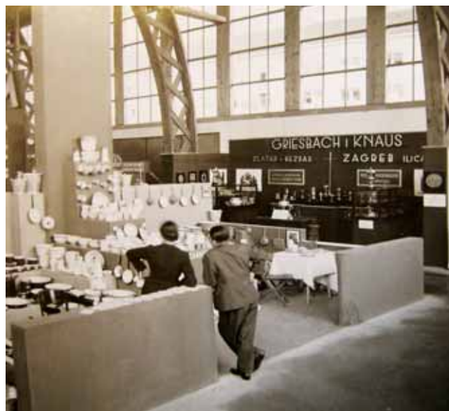
11 Nastup na 30. Zagrebačkom zboru 1938.