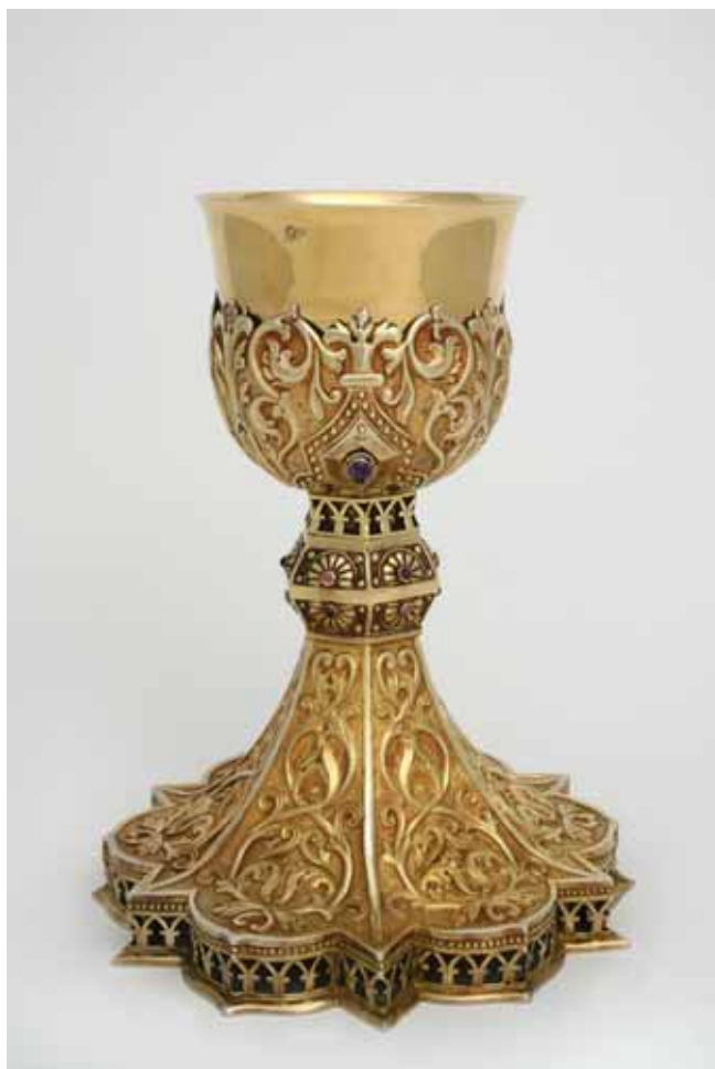
5 Kalež, pozlačeno srebro, vjerojatno prema nacrtu Vinka Rauschera, 1932., Međubiskupijsko sjemenište, Zagreb Chalice, silver gilt, probably from a drawing of Vinko Rauscher, 1932, Archdiocesan Seminary, Zagreb