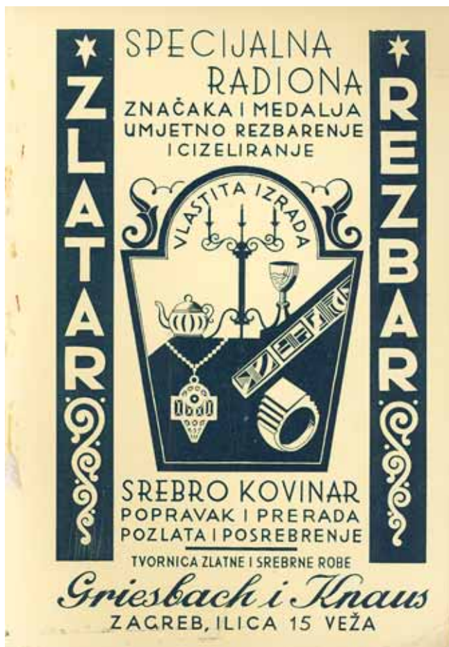
1 Reklama iz foto-cjenika »Griesbach i Knaus«, 1936. Advert from the Photo-Price List of Griesbach and Knaus of 1936.