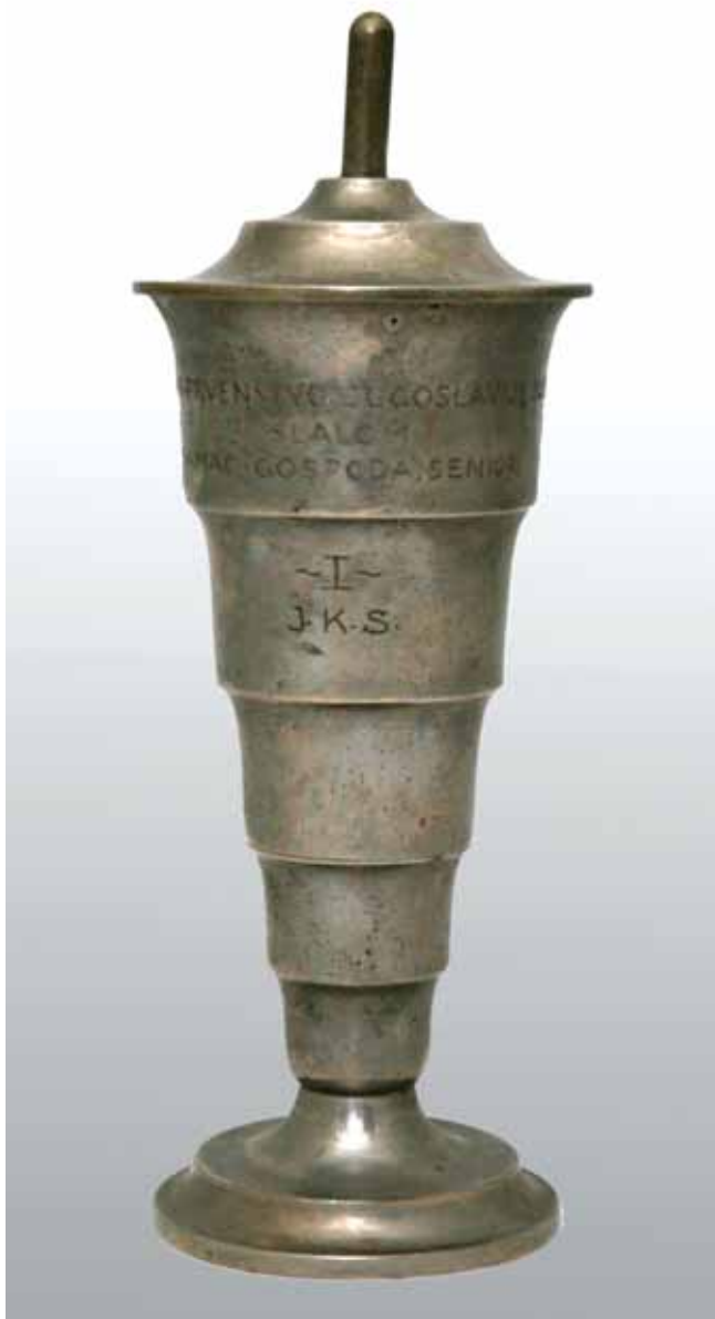
12 Pokal, posrebrnena metalna legura, oko 1936., Hrvatski športski muzej

Cup, nickelled metal alloy, around 1936, Croatian Sports Museum