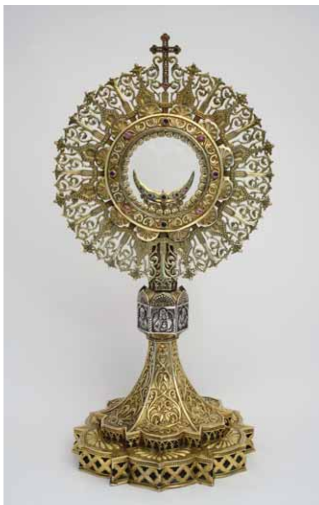
3 Reklama i ponuda sakralnih predmeta iz kataloga s ponudom tvrtke, 1936.

Advert and range of religious objects, from the firm's catalogue of 1936