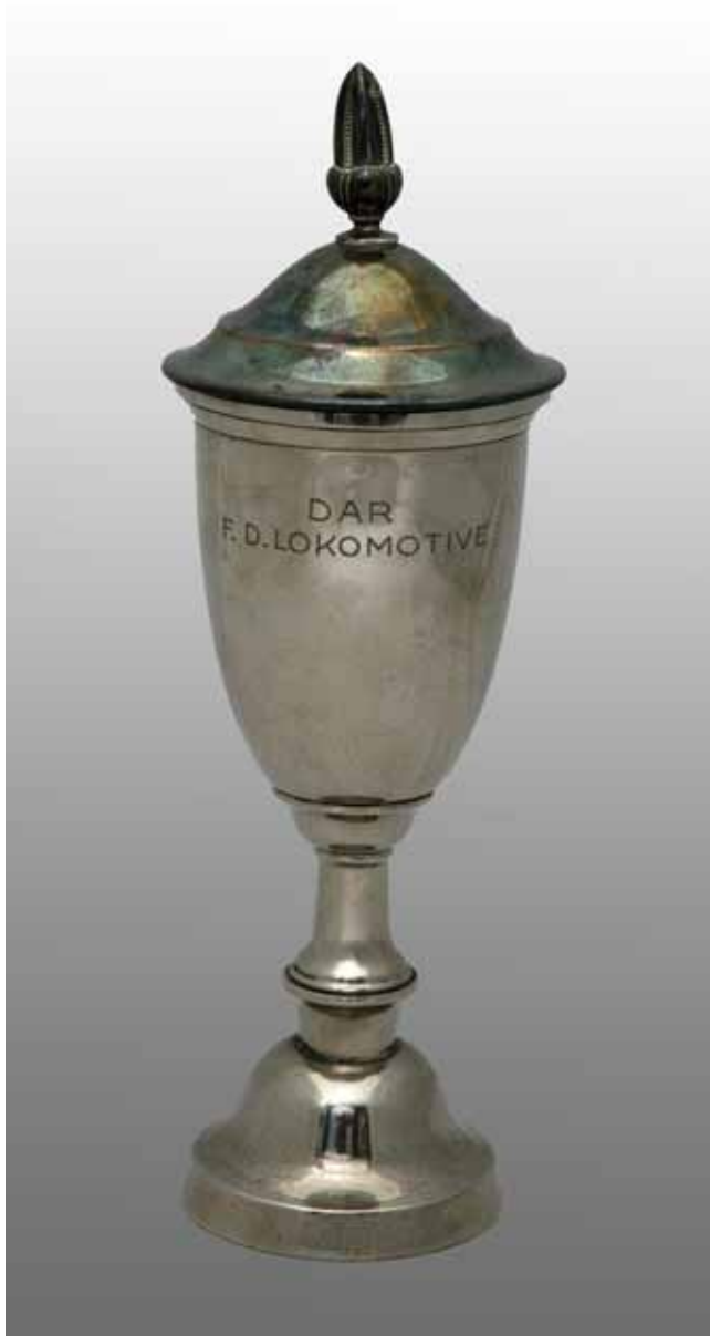
13 Pokal, posrebrnena metalna legura, oko 1936., Hrvatski športski muzej

Cup, nickelled metal alloy, around 1936, Croatian Sports Museum