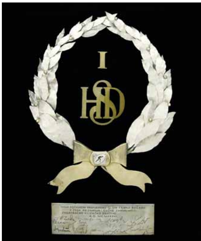
14 Plaketa Zagrebačkog klizačkog društva dr. Franji Bučaru, 1936., Hrvatski sportski muzej

Plaque of the Zagreb Skating Association presented to Dr Franjo Bučaru, 1936, Croatian Sports Museum