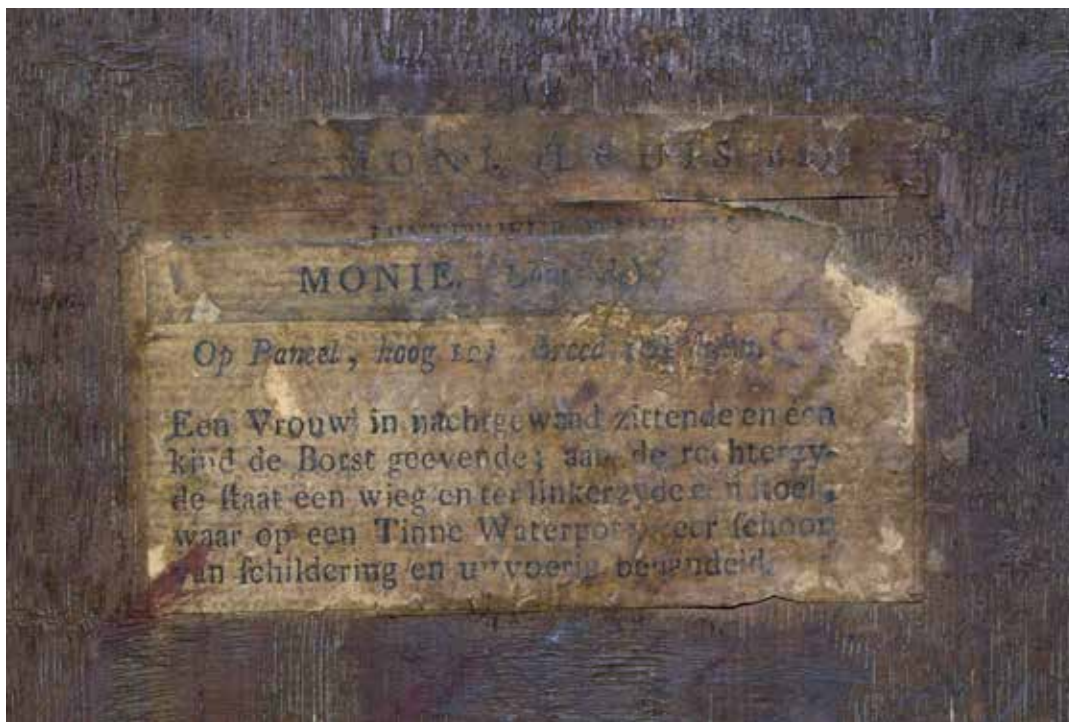
3. Detalj poledine slike Detail of the back of the painting

slikajući istovremeno kopije prema slikama nizozemskoga zlatnog doba, za otvoreno tržište. 18 Poznato je da je Louis de Moni kopirao različite teme i autore, od Rembrandta do Hansa Jordaensa, no upravo su njegove kopije prema genre slikama Gerarda Doua, Gabriela Metsua i Fransa van Mierisa St. ostvarile najviše iznose i bile osobito cijene u 18. stoljeću. De Monijev opus dosad nije monografski obrađen, a istraživanja su usmjerena prvenstveno na kopije koje je slikao. 19