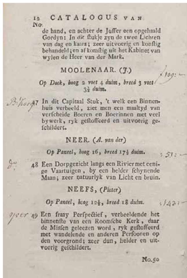
5. Stranica kataloga prodaje zbirke baruna Menna van Coehoorna, Amsterdam, 1801.

Page from the sale catalogue of Baron Menno van Coehoorn's collection, Amsterdam, 1801