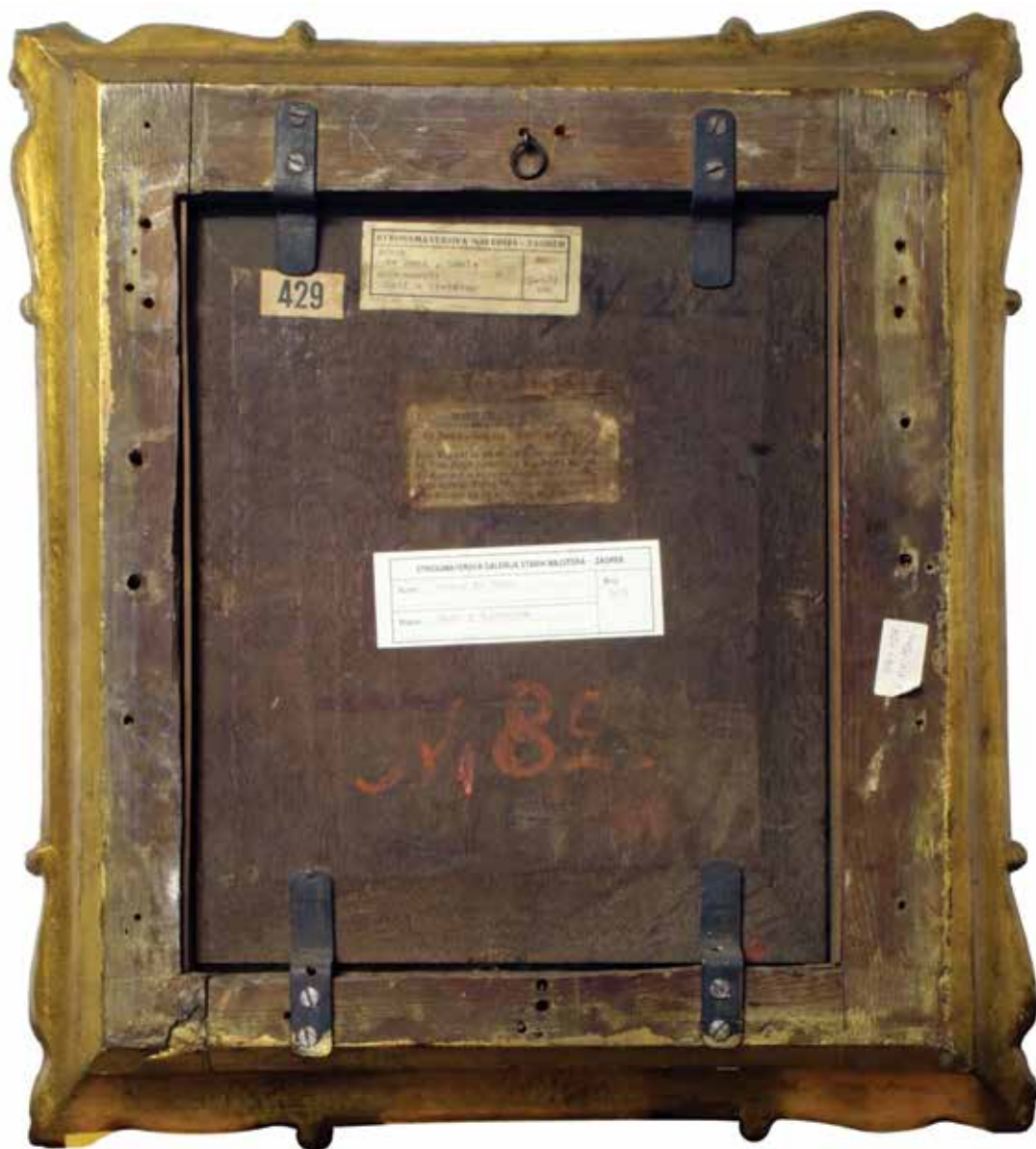
2. Poledina slike Back of the painting

provenijencija slike Majčinstvo nizozemskog slikara Louisa de Monija (1698. – 1771.), pod čijom je atribucijom slika i poklonjena Galeriji (sl. 1). Po prispjeću u Galeriju bila je izložena u stalnom postavu do njene obnove koju je proveo Gabriel pl. Térey 1926. godine, 13 a ponovno je bila uključena u postav povodom obilježavanja sto godina Strossmayerove galerije 1984. godine. 14 Izlagana je na tematskim izložbama Galerije, no dosad nije bila detaljnije razmatrana. 15