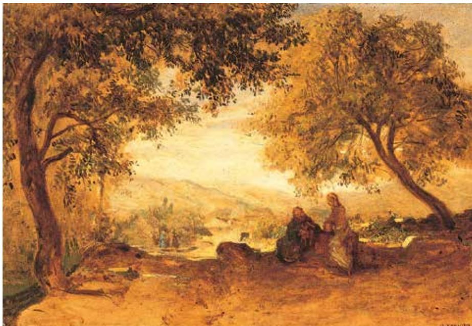
5. Constant Troyon, Krist i Samaritanka , o. 1840., ulje na dasci, 30,8 × 44,2 cm, Zagreb, Muzej Mimara, inv. br. ATM 844 Constant Troyon, Christ and the Samaritan Woman, ca. 1840, oil on panel, 30.8 × 44.2 cm, Zagreb, Mimara Museum, inv. no. ATM 844