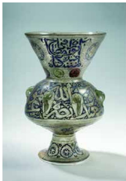
10. Mošejska svjetiljka , Sirija, 14. st., prozirno, smečkasto tonirano staklo, višebojni emajl, vis. 38,3 cm, ø otvora 24,6 cm, Muzej Mimara, inv. br. ATM 1435

Iz te skupine u fondusu Muzeja Mimara još možemo identificirati mošejsku lampu datiranu u 14. stoljeće (sl. 10). 69 U CCP je također pristigla u kolovoza 1945. godine iz Görin-