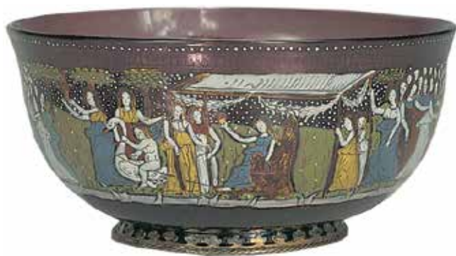
9. Zdjelica , Venecija, o. 1450., prozirno purpurno staklo, višebojni emajl i pozlata, srebro, vis. 6,3 cm, ø otvora 13,5 cm, Muzej Mimara, inv. br. ATM 1783

Small bowl, Venice, ca. 1450, clear purple glass, multicolour enamel and gilding, silver, height 6.3 cm, opening ø 13.5 cm, Mimara Museum, inv. no. ATM 1783