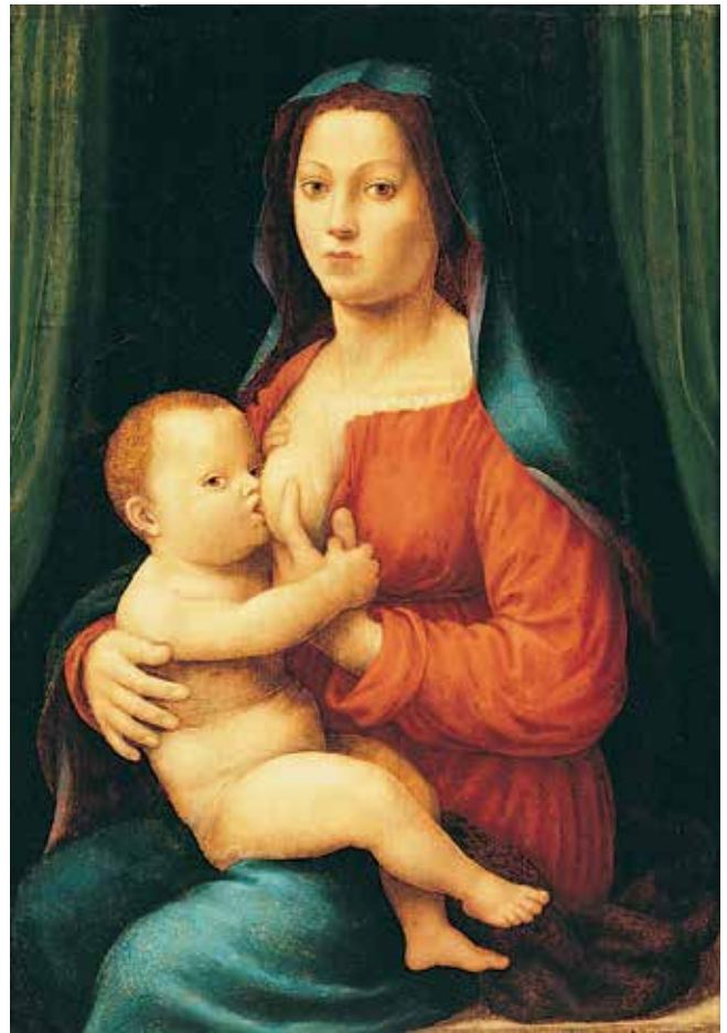
1. Giuliano Bugiardini, Bogorodica s Djetetom , o. 1520., ulje na dasci, 73,3 × 49,5 cm, Zagreb, Muzej Mimara, inv. br. ATM 875

Auction catalogue Sammlung Geheimrat Ottmar Strauss, Teil II (...) , Frankfurt, May 22–24, 1935: a) p. 7, b) table 11