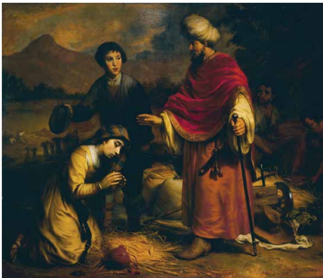
6. Gerbrand van den Eeckhout, Ruta i Boaz , 1661., ulje na platnu, 164 × 198 cm, Zagreb, Muzej Mimara, inv. br. ATM 2000 Gerbrand van den Eeckhout, Ruth and Boaz, 1661, oil on canvas, 164 × 198 cm, Zagreb, Mimara Museum, inv. no. ATM 2000