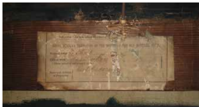
7. Poledina slike Ruta i Boaz , detalj Back of the painting Ruth and Boaz, detail

Izuzev otklona o smještaju Boaza s lijeve strane, zagrebačka slika posve, uključujući potpis i dataciju u 1661. godinu, odgovara djelu koje je za izložbu posuđeno od Earla Cadogana. 42 Dimenzije slike navedene u inčima (približno 147 × 185 cm) odudaraju desetak-dvadesetak centimetara od dimenzija slike u Muzeju Mimara, no nedvojbenu potvrdu da je riječ o istoj slici pruža naljepnica s izložbe sačuvana na poledini slike (sl. 7). Slične diskrepancije između dimenzija zagrebačke slike i onih publiciranih u djelu Sumowskoga uočila je već H. Zoričić (4 i 13 cm), a dotična bi se odstupanja mogla objasniti ne samo pogreškom u bilježenju nego i ukrasnim, lučno zaključenim okvirom koji je ranije sakrivalo sva četiri ruba slike. 43