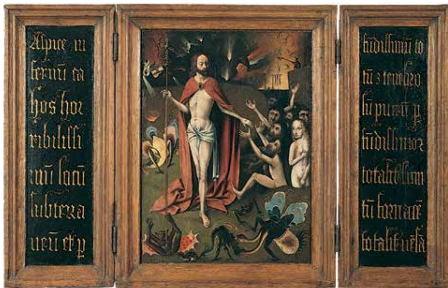
3. Sljedbenik Hieronymusa Boscha, Triptih Kristova silaska u Limb , 16. st. (?), ulje na dasci, 48,6 × 76 cm (rastvoren), Zagreb, Muzej Mimara, inv. br. ATM 937

Follower of Hieronymus Bosch, triptych Christ's Descent into Limbo, 16 th c. (?), oil on panel, 48.6 × 76 cm (opened), Zagreb, Mimara Museum, inv. no. ATM 937