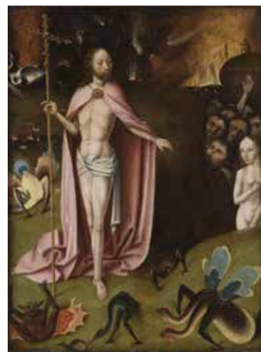
4. Sljedbenik Hieronymusa Boscha, Kristov silazak u Limb , 16. st., ulje na dasci, 54,6 × 41,4 cm, Philadelphia Museum of Art, inv. br. 2055

Follower of Hieronymus Bosch, triptych Christ's Descent into Limbo, 16 th c. (?), oil on panel, 48.6 × 76 cm (opened), Zagreb, Mimara Museum, inv. no. ATM 937